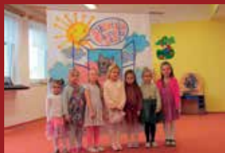
MALÍ RECITÁTOŘI VE STĚŽERÁCH

Karnevalový rej v Dohalicích. ...čtěte na straně 7