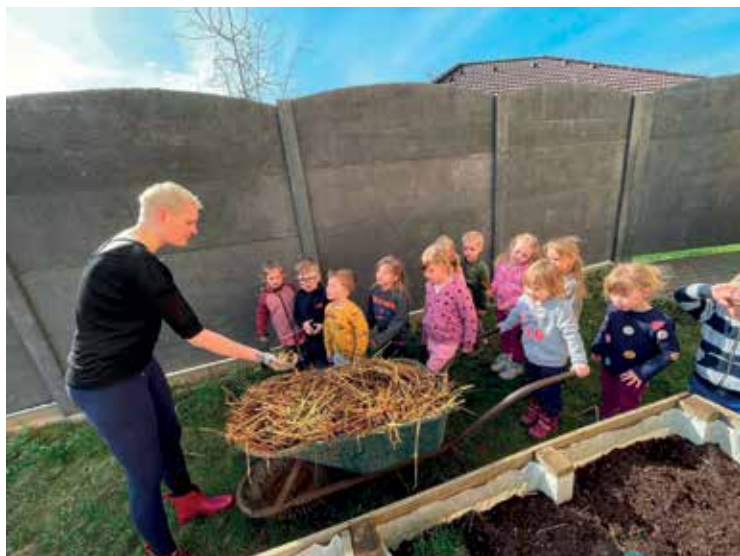
▪ Školkové zahradničení.