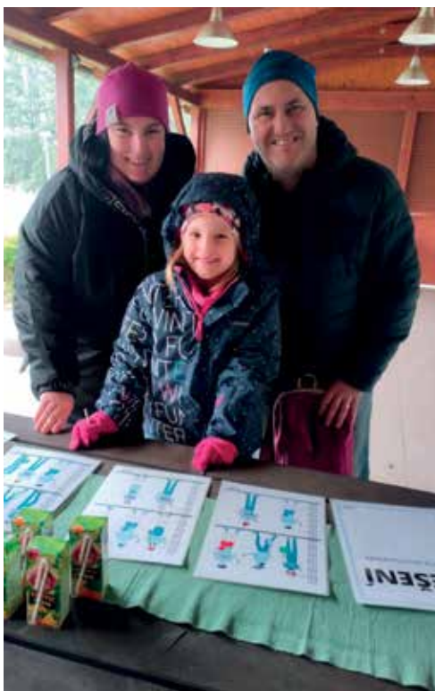
▪ Na konci velikonoční stezky čekala odměna.