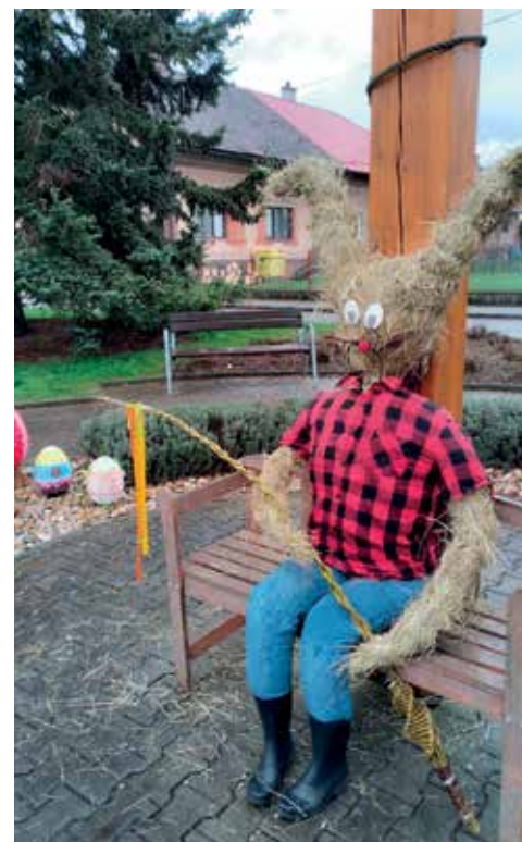
▪ Velikonoční zajíc zdobil pár týdnů obecní náves.