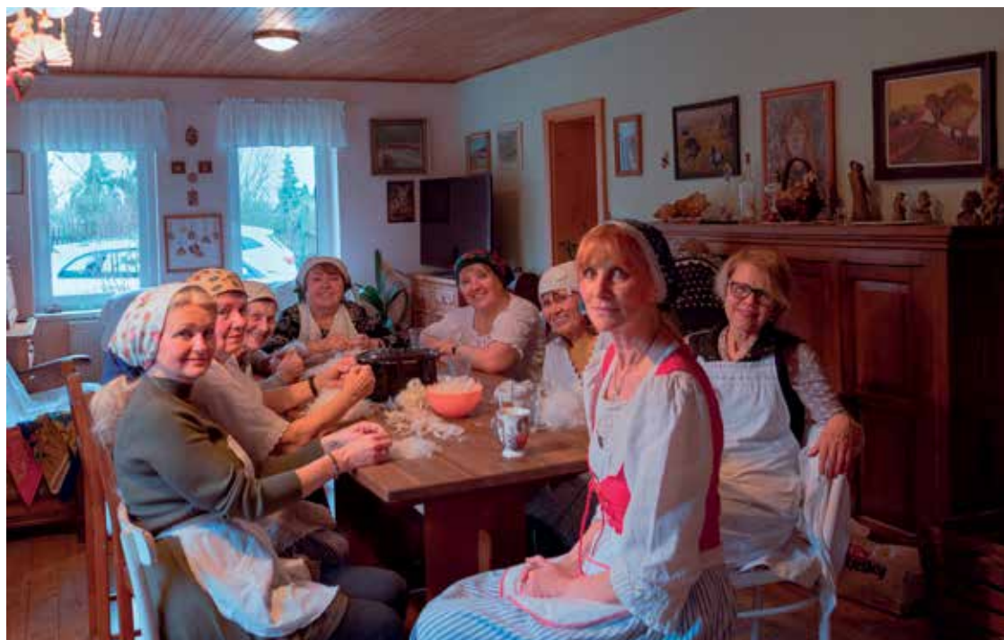
▪ Na společné povídání a vzpomínání se při draní peří vždy těšíme.