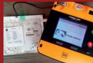
MŽANY MAJÍ "DEFÍK"