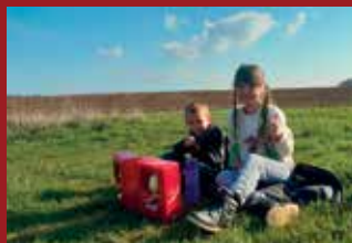
VELIKONOCE NA HRÁDKU