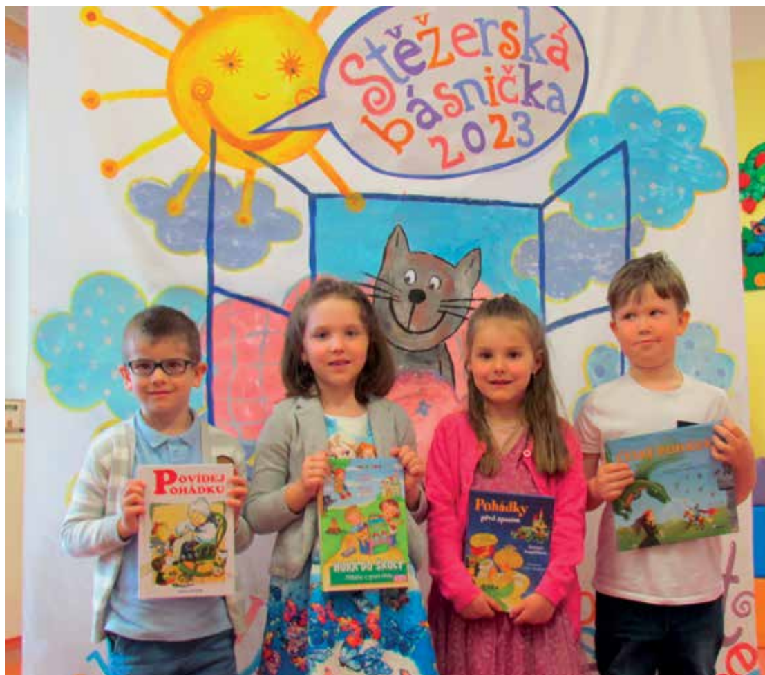
■ Vítězové letošního ročníku Stěžerské básničky.

Za rok doufáme na shledanou Karolína Kafková