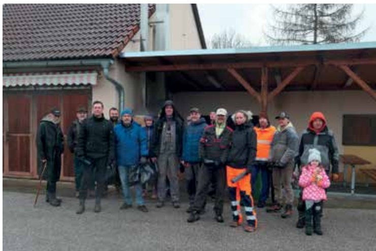
▪ Počasí akci moc nepřálo, i tak se sešla dobrá parta.