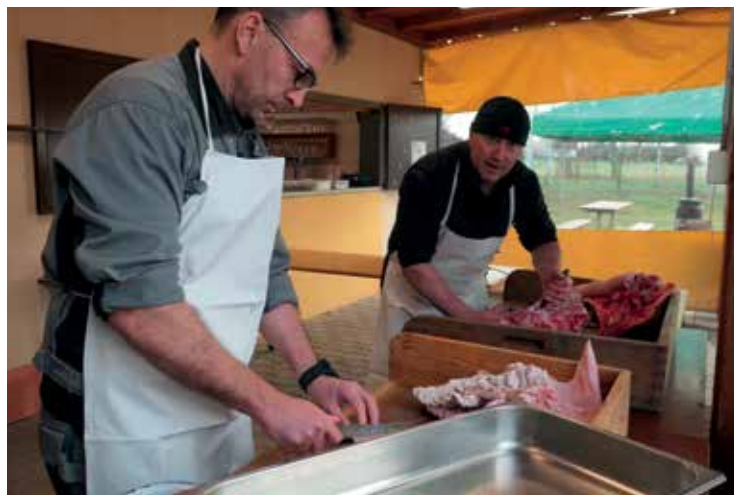
▪ Každoroční zabíjačka je v Sadové už tradicí.