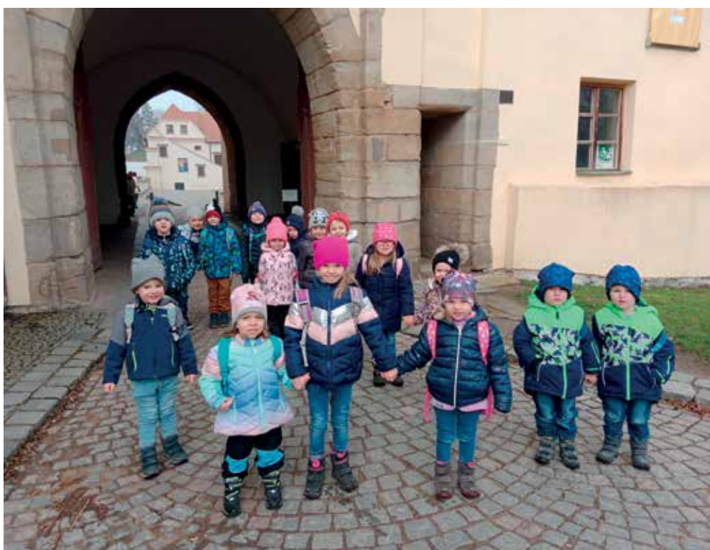
▪ Školní výlet - tentokrát na zámku v Pardubicích.