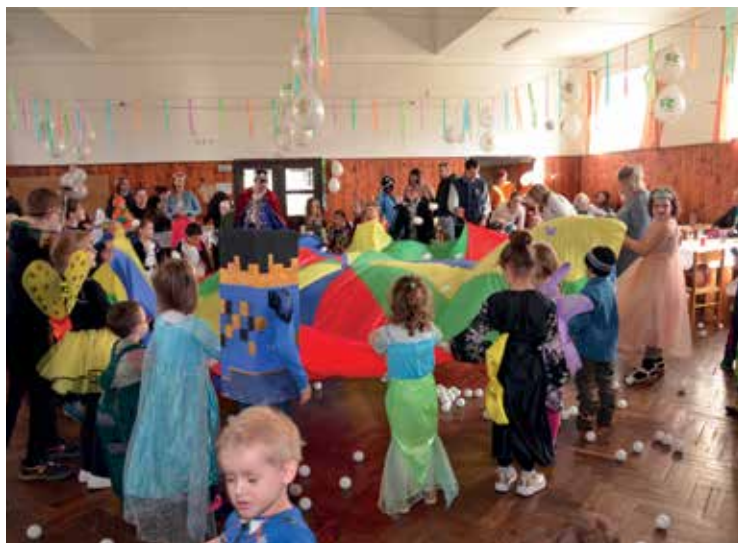
▪ Letošní karnevalové veselí se vydařilo.