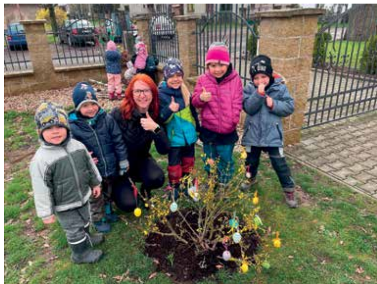
▪ Jarní výzdoba naší zahrady.