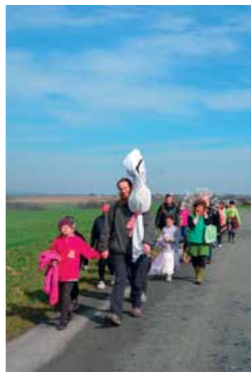
▪ Tradiční průvod vedl přes sousední Petrovice a Petrovičky.