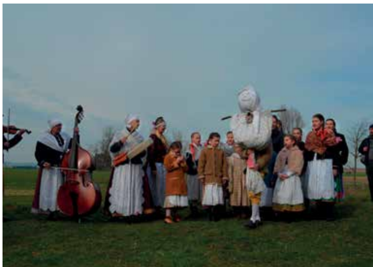
▪ Program zpestřil Dětský folklórní soubor Červánek.