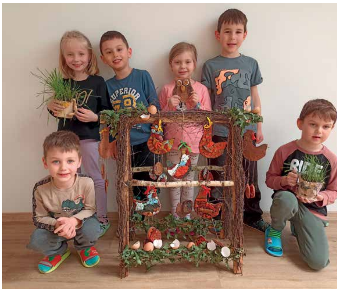
▪ Děti z keramického kroužku.