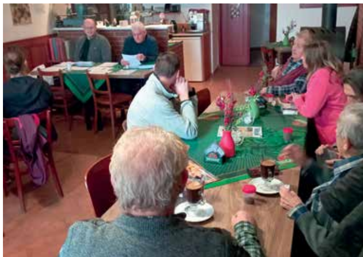
▪ Včelaři se sešli na své výroční schůzi.