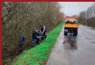
ZABÍJAČKA I ÚKLID V SADOVÉ