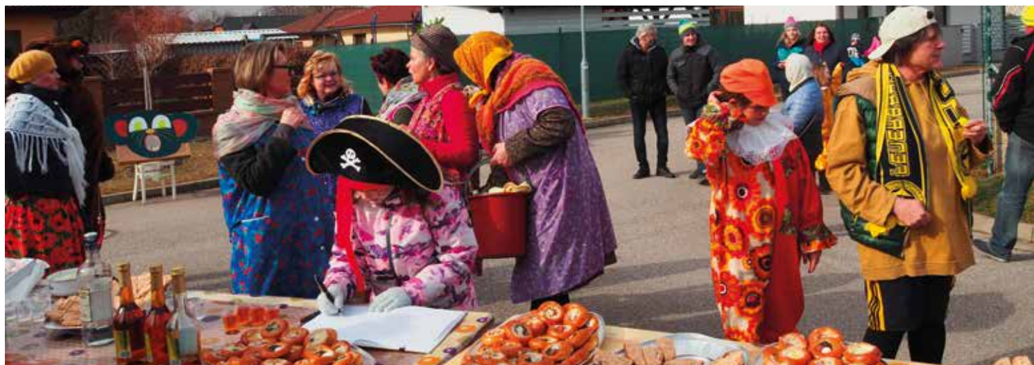
▪ Masopustní setkání po letech i v Boharyni.