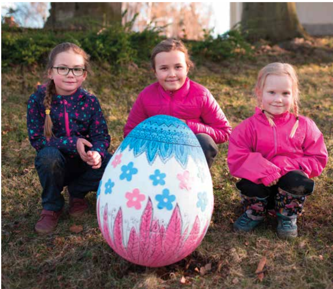
▪ Děti vyráběly exponáty a pak je pomáhaly rozmísťovat.