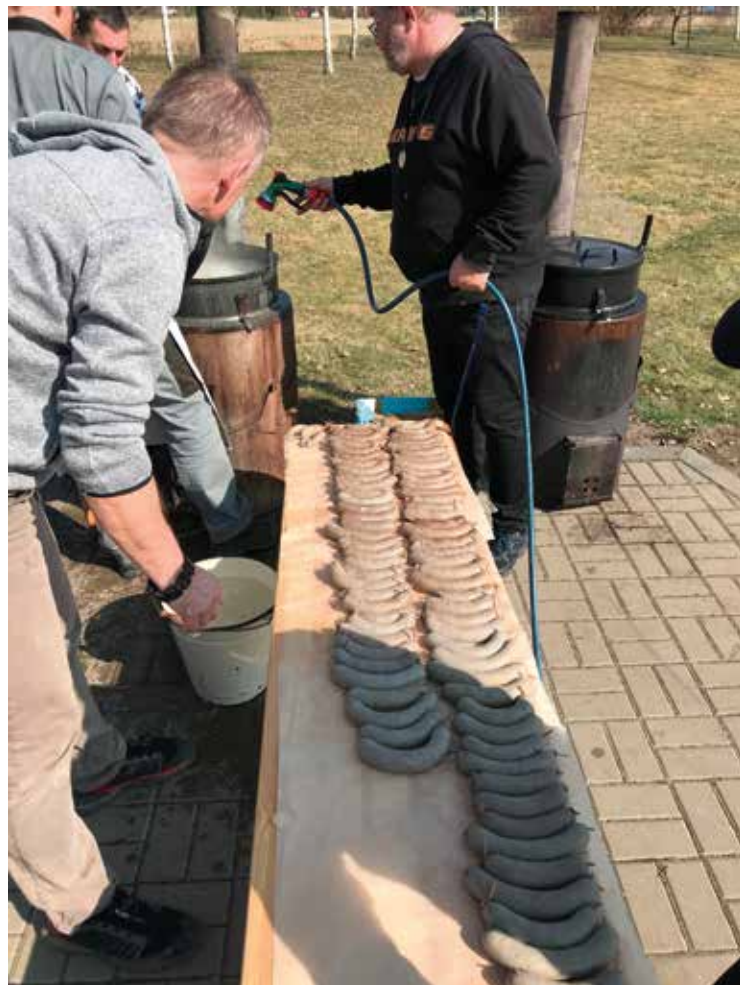
▪ Zabijačkové hody se neobešly bez výborných jitrnic.