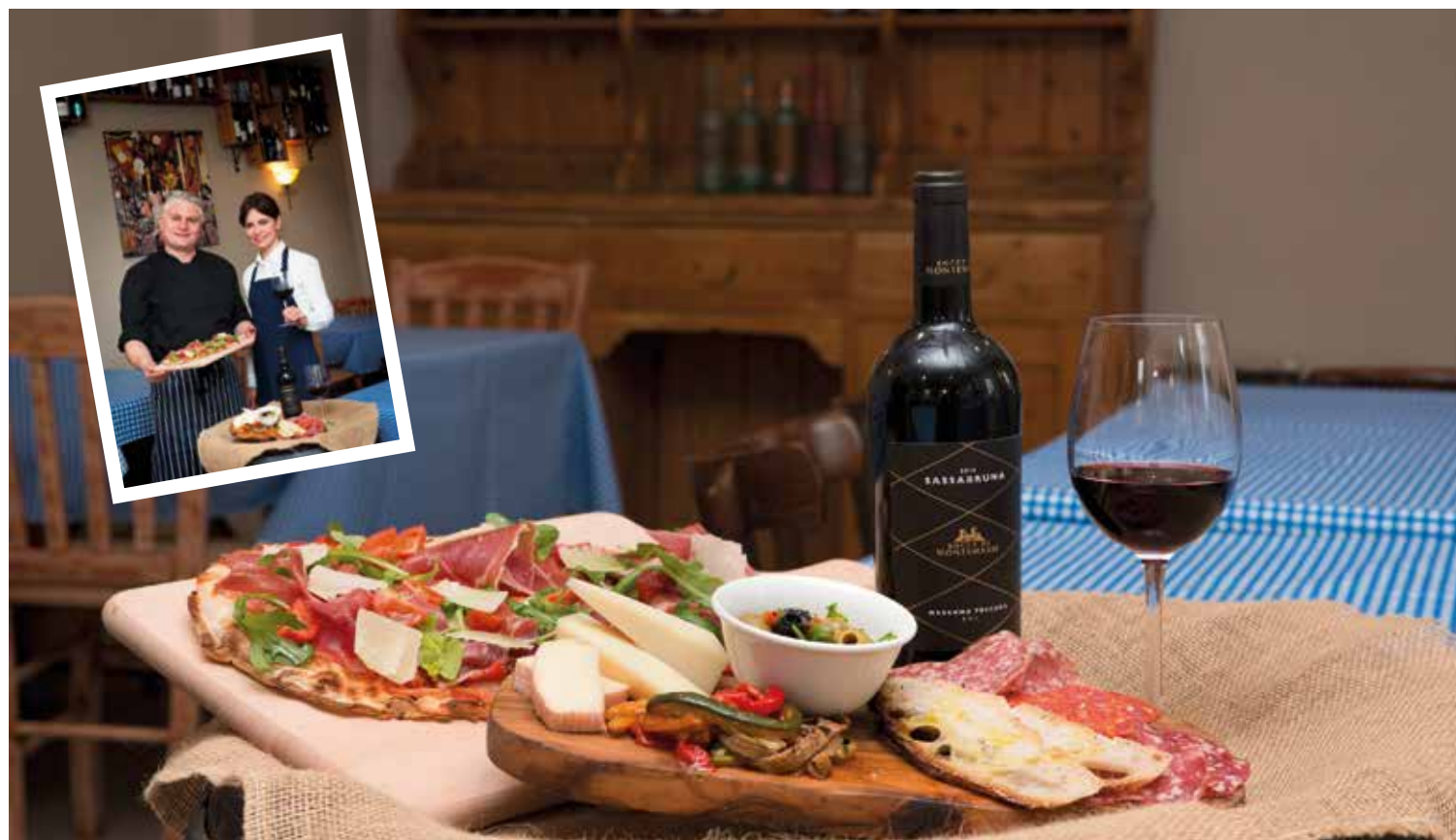
▪ Atmosféru italské restaurace zachytila Petra Kopecká.