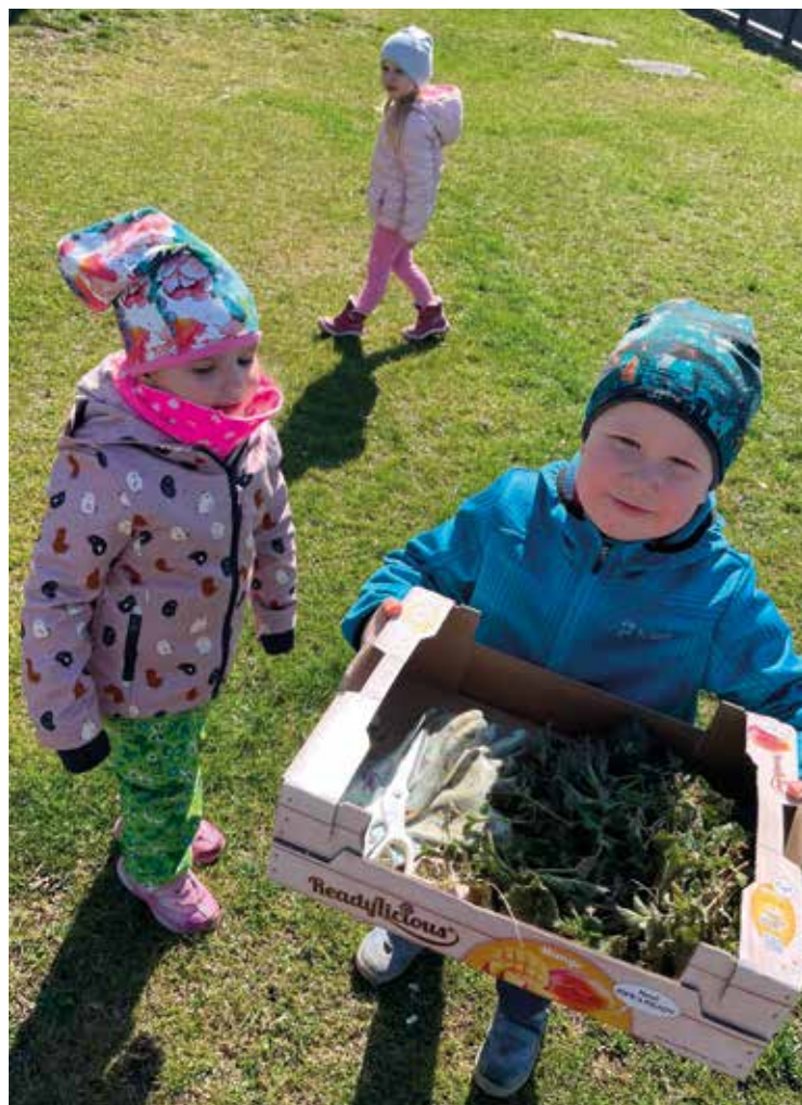
▪ Naši pracovití zahradníci nám dělají radost.