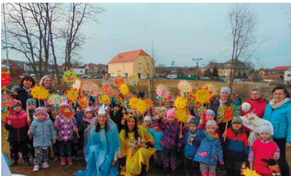
▪ Loučení se zimou a vítání jara.