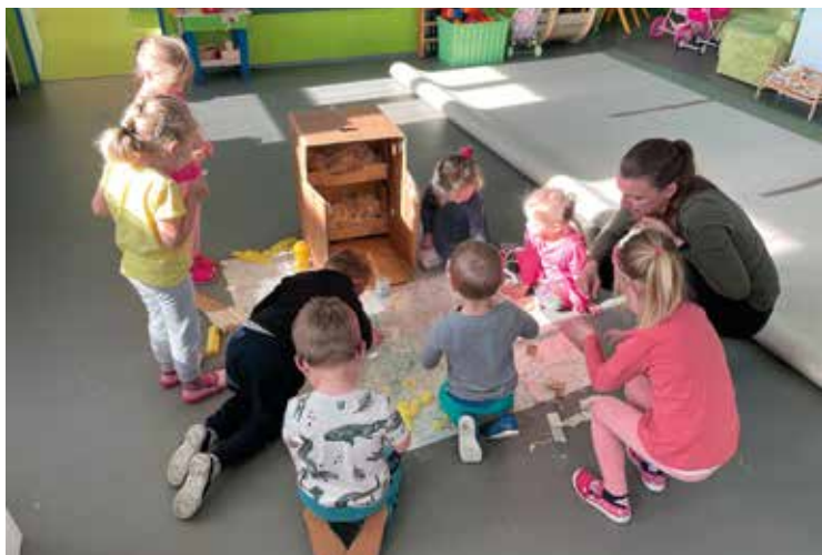
▪ Výroba kurníku z krabic od zeleniny.