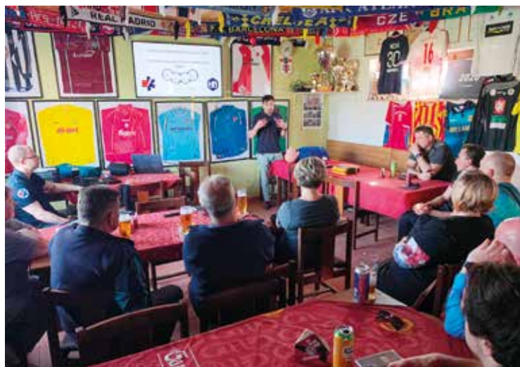
Školení pro používání defibrilátorů se zúčastnili trenéři TJ Sokol Stěžer.