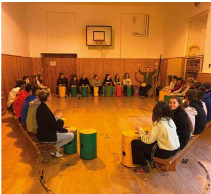
▪ Společné bubnování v tělocvičně.