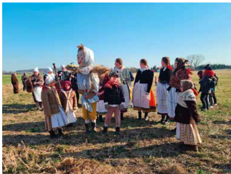
▪ Masopustní veselí jsme u nás spojili s vítáním jara.