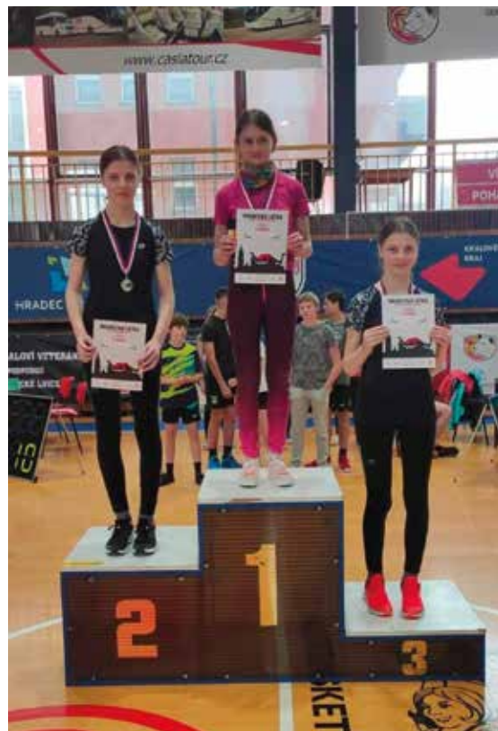
▪ Nechaničtí školáci se zúčastnili několika sportovních klání.