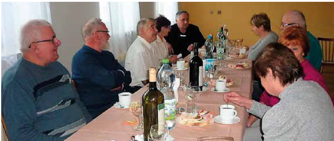
▪ Příjemné setkání seniorů se uskutečnilo právě po roce.