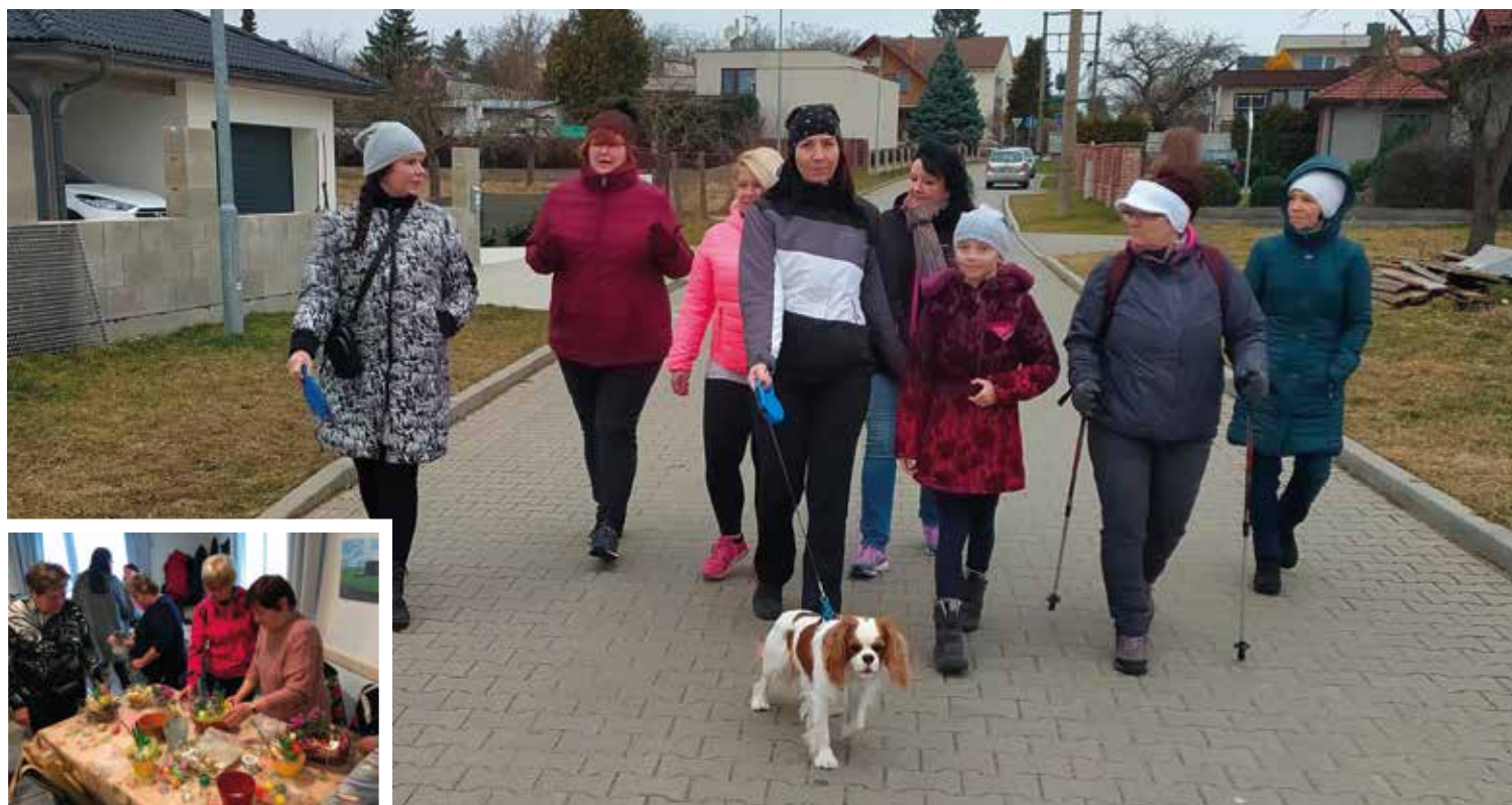
▪ Jarní tvoření proběhlo v Mokrovousích a jedna ze zdravých procházek v Nechanicích.