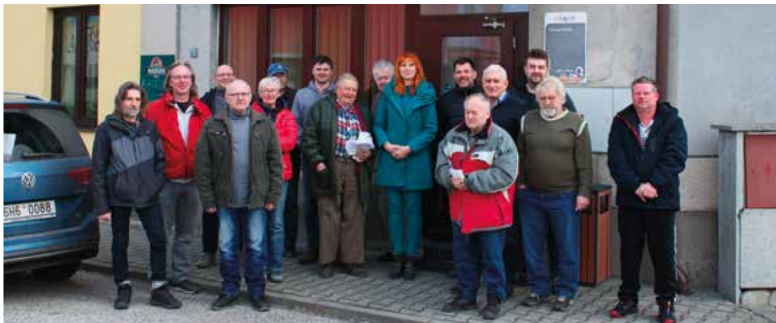
▪ Členská schůze se konala tradičně v hospůdce U Jonešů.