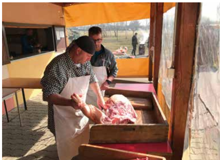
▪ Příprava zabijačkových specialit.