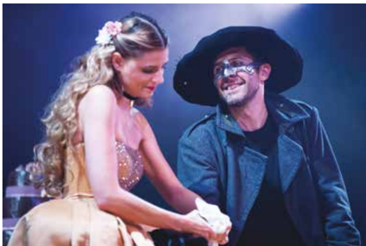
▪ Cyrano z Bergeracu.