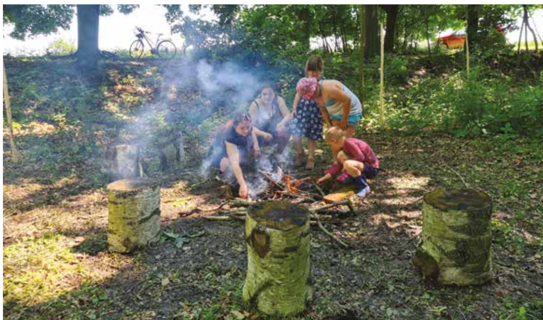
▪ Dětské programy se konají pokaždé, když rodiče pracují.