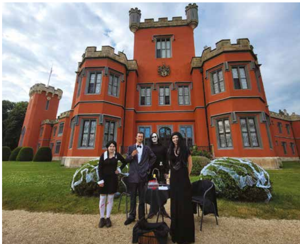
▪ V červnu jste na nádvoří zámku mohli potkat Addamsovu rodinu.