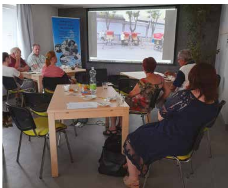
▪ Cestopisná přednáška v Mokrovousích.