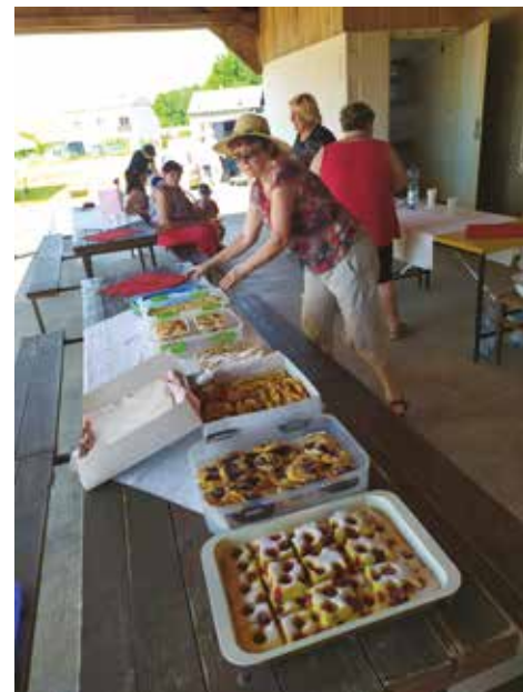
▪ Nechybělo něco na zub.