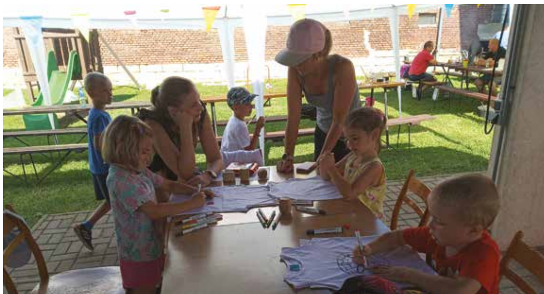
▪ Z dětského dne si mohl každý odnést vlastnoručně vymalované tričko.