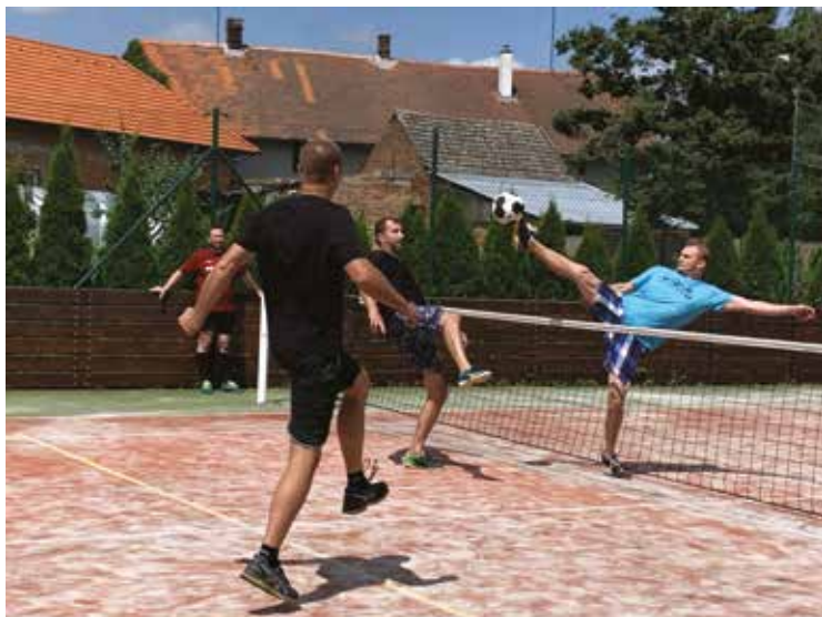
▪ Jedna z momentek turnaje.