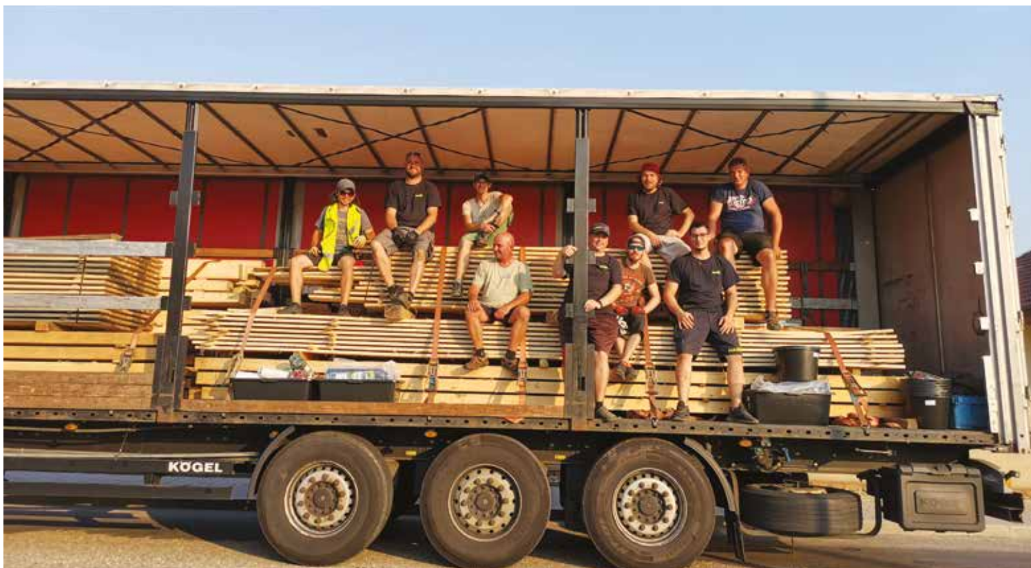
▪ Odvoz trámů a prken z Lodína do Lužice postižené tornádem.