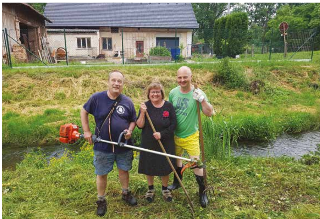
▪ Brigádníci při úklidu Nerošova.