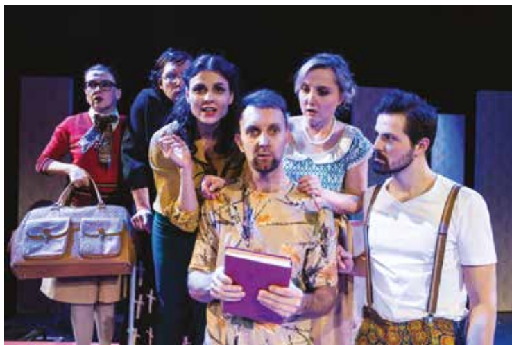
▪ Jak je důležité býti (s) Filipem.