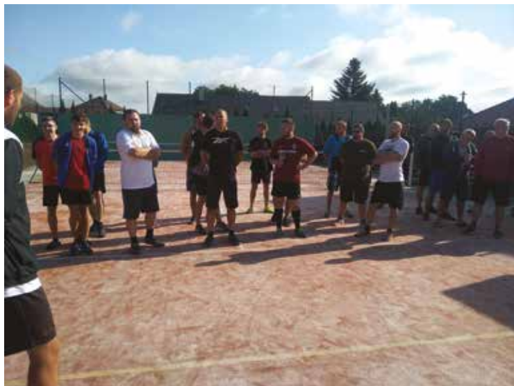
▪ V nohejbalovém turnaji trojic se utkalo šest týmů.