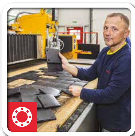
Těsnění na míru