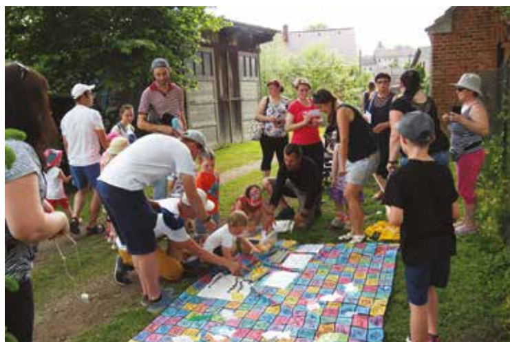
▪ Soutěžní odpoledne mělo několik stanovišť.