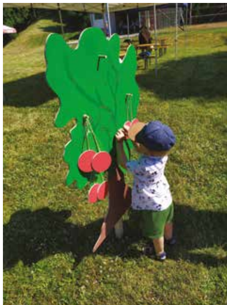
▪ Tematicky laděné soutěžení.