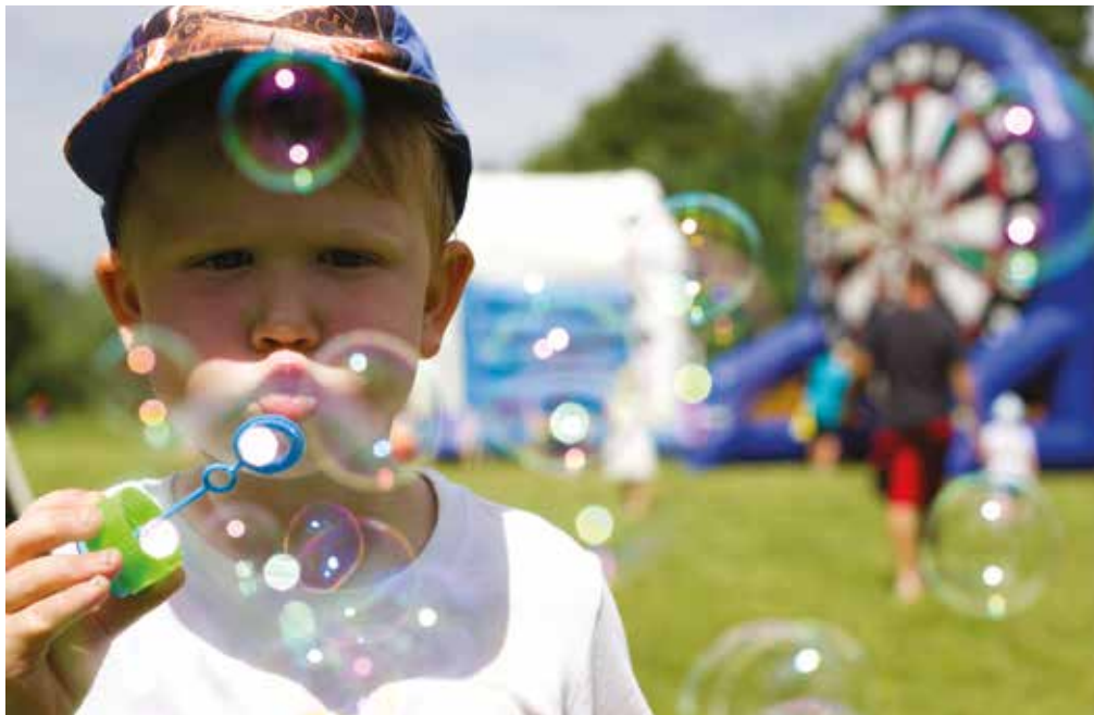
■ Radost dětem přinesly nejen atrakce, ale i drobné dárky.