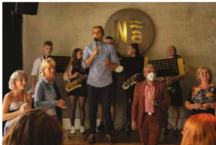
▪ Slavnostní zahájení vernisáže.