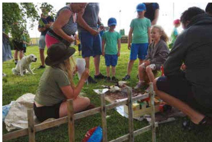
▪ Jedno ze stanovišť bylo i na téma ochrany přírody.