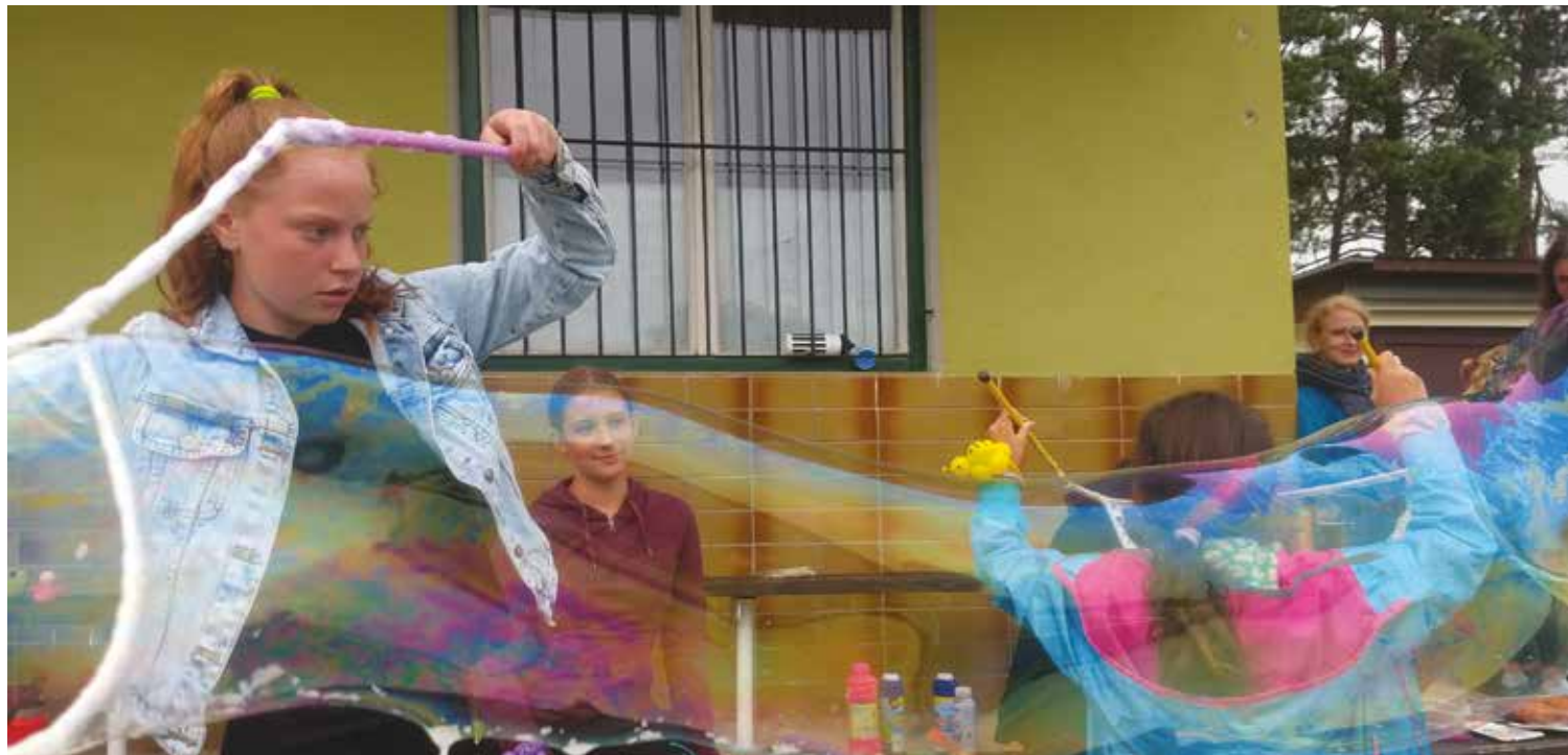
▪ Děti si vyzkoušely jak tvořit veliké bubliny.

Děkujeme všem statečným, které počasí neodradilo a těšíme se zase příště. Ludmila Valešová