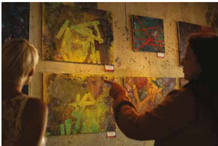
▪ Na výstavě najdete i obrazy z našeho mikroregionu.