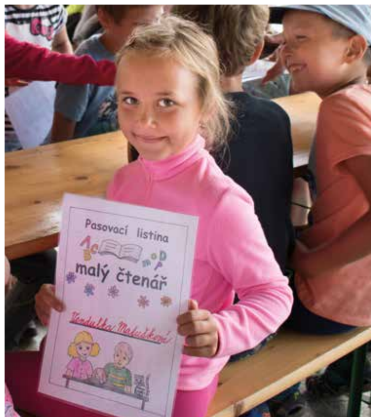
■ Pasování malých čtenářů.