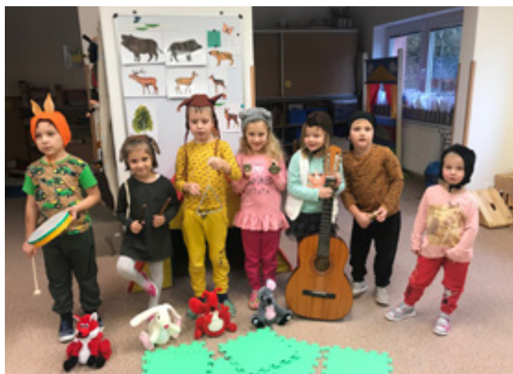
■ Pohádka O ztracené base v podání dětí z těchlovické školky.