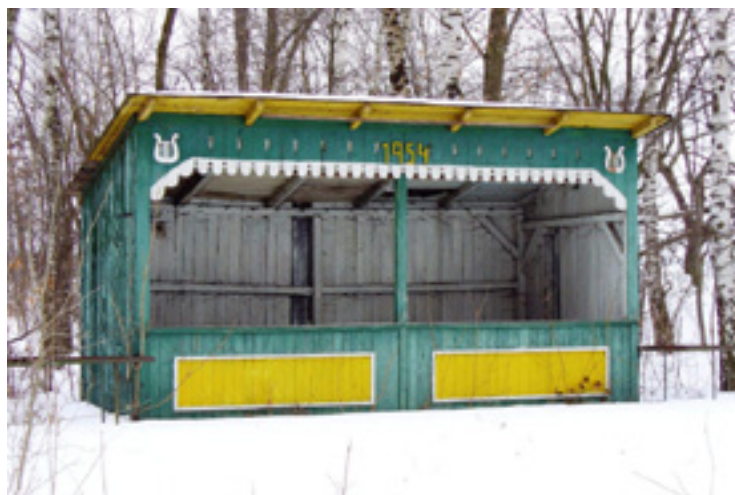
▪ Divadelní pódium foceno kolem roku 2015.