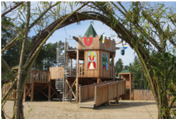
▪ Městské lesy HK lákají k procházkám rodiny s dětmi.