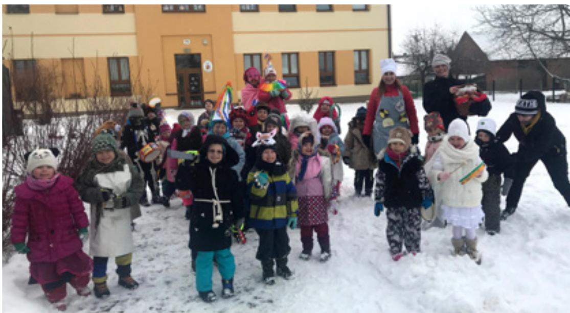
▪ Masopustní průvod je u nás ve školce už tradicí.

Další opravdu zajímavou a hodnotnou zkušeností bylo zapojení do projektu Finanční gramotnost pro MŠ, kdy si naši předškoláčky zábavnou a hravou formou s prvky dramatizace a tvorby přicházeli na odpovědi: Jak a kde vznikají peníze, jak se k lidem dostávají a k čemu vlastně slouží?