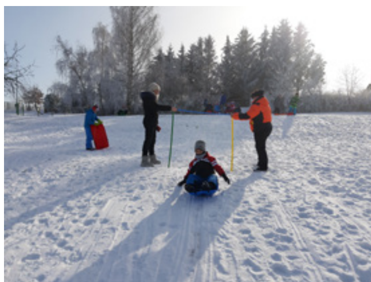
■ Sněhové radovánky na kopci za zahradou školy.