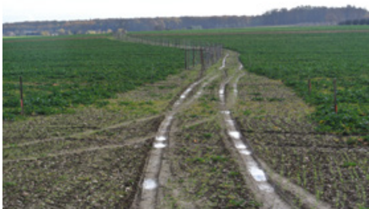
■ Nová mez s výsadbou keřů u Lubna.

Polní cesty, stromořadí, meze a mokrady do zdravé krajiny patří a na Nechanicku to není žádná novina. Probíhá zde řada výsadeb a obnovují se historické polní cesty. Také Česká společnost ornitologická se zde podílela na vzniku křovinatých mezí a dlouhodobě usiluje o zachování druhové rozmanitosti v krajině spoluprací s místními zemědělci. V únoru letošního roku navíc společně s německým spolkem pro péči o krajinu DVL zahájila nový projekt Cesta ke zdravější zemědělské krajině spoluprací ochránců přírody, samosprávy a zemědělců. Projekt založený na komunikaci představuje příležitost pro každého, kdo chce přispět k vytváření pestřejší a odolnější krajiny. Jak známo, právě vzájemné porozumění je v této věci klíčové. Zástupcům samosprávy, zemědělcům, vlastníkům půdy a ochráncům přírody se tak otevírá možnost společně projednat své představy a možná úskalí u kulatých stolů. Velmi vítané je zapojení mysliveckých sdružení, rybářů, včelařů nebo také jednotlivců se zájmem o přírodu.