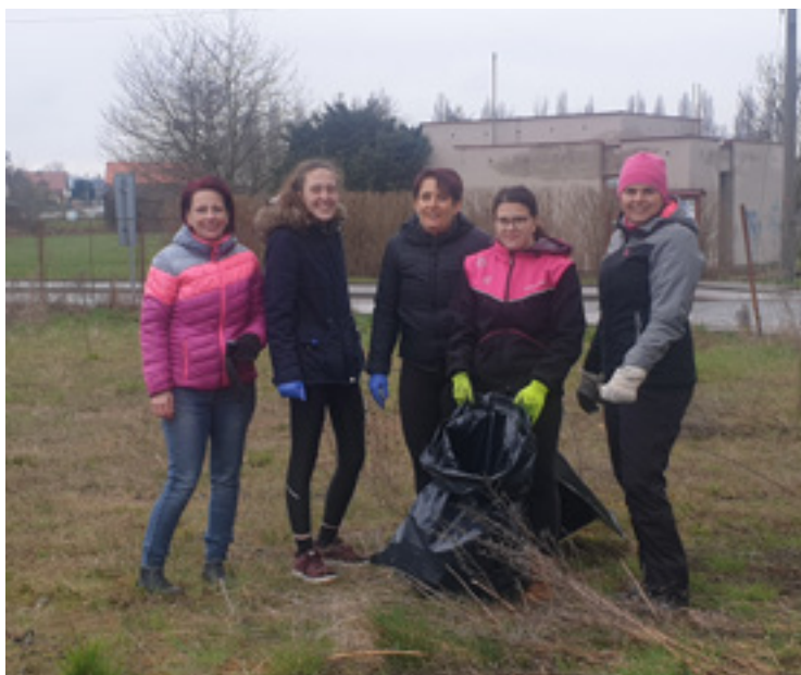
Obecní brigáda byla vyhlášena i letos.