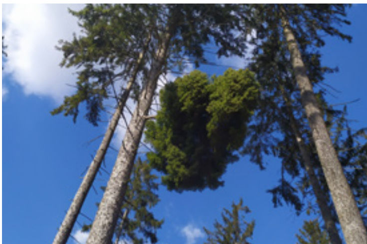
▪ Čarovník v Těchlovickém lese.