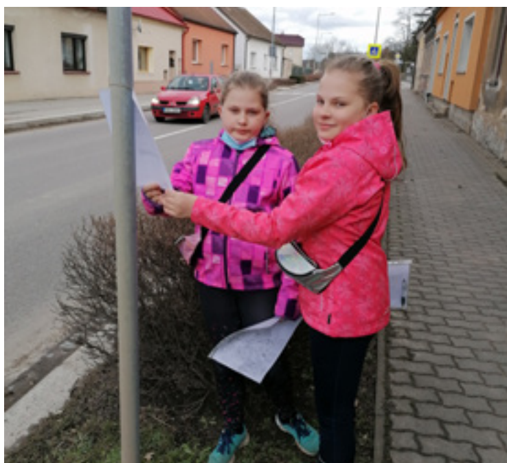
■ O městskou hru byl velký zájem především mezi dětmi.