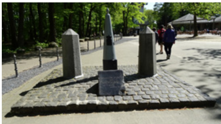
▪ Vaalserberg, nejvyšší bod Nizozemí [322 m].

Na své cestě jsme tak pomyslně navštívili spoustu zemí Evropy a jejich nejvyšších bodů a ani jsme nemuseli přejet hranice našeho krásného kraje. Přeju vám na cestu na jakýkoliv vrchol hodně sil a šťastný návrat zase dolů! Ivan Šenk