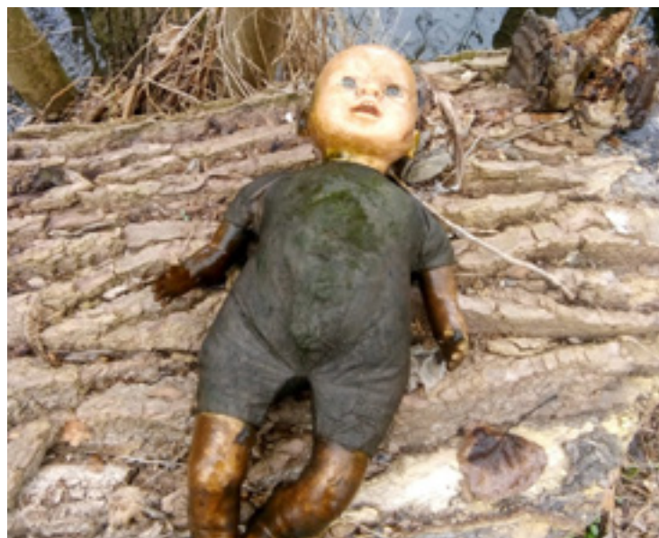
▪ Jeden z mnoha nalezených pokladů.