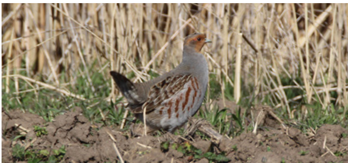
■ Koroptev polní.