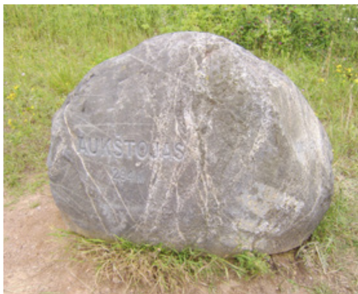
▪ Snad nejmladším nejvyšším bodem v Evropě je litevský kopec Aukštojas [294 m]. Jeho jméno bylo vybráno ve veřejné soutěži v roce 2005. Aukštojas byl litevský pohanský bůh, který byl považován za tvůrce světa.