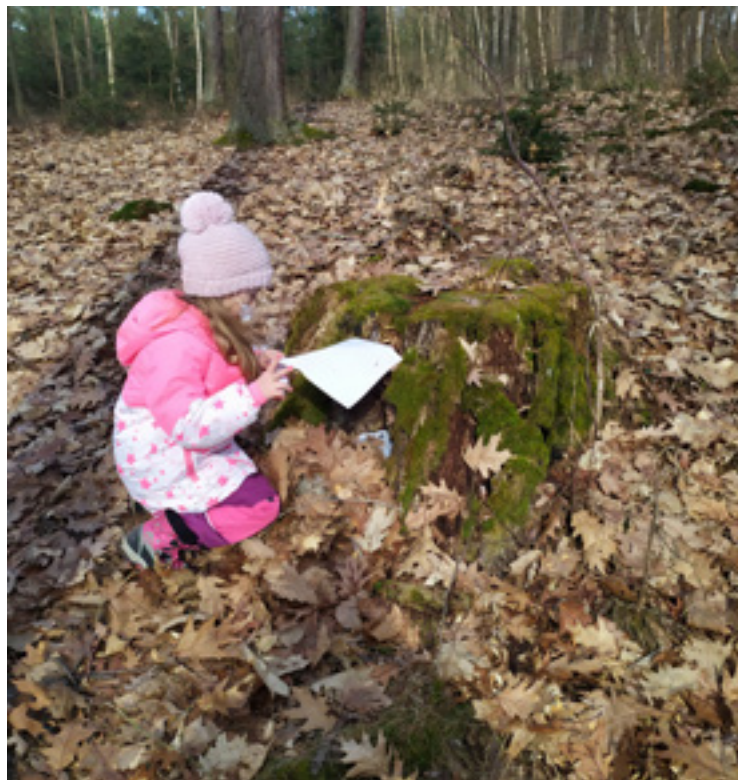
▪ Jedno z osmi zastavení lesní hry O poklad Perchty z Těchlovic.