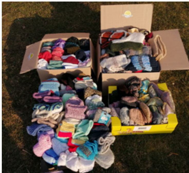
■ Pletené ponožky byly předány do nemocnice v HK.