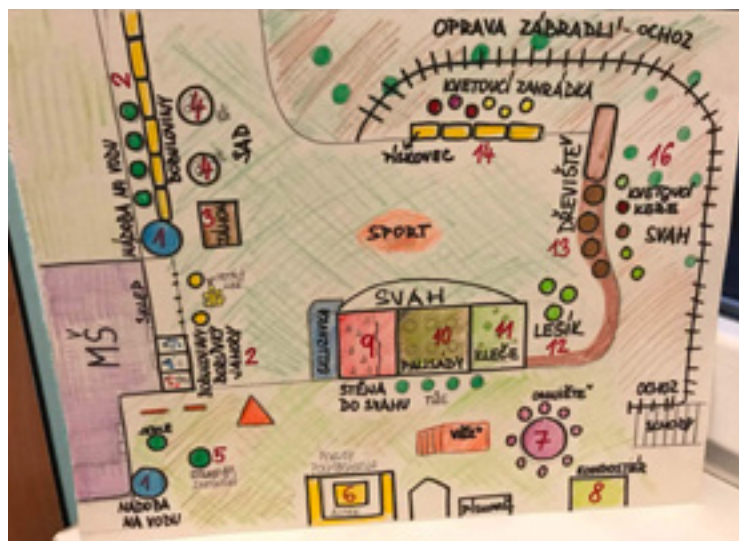
■ K tvorbě naší přírodní zahrady byl zapotřebí plánek.