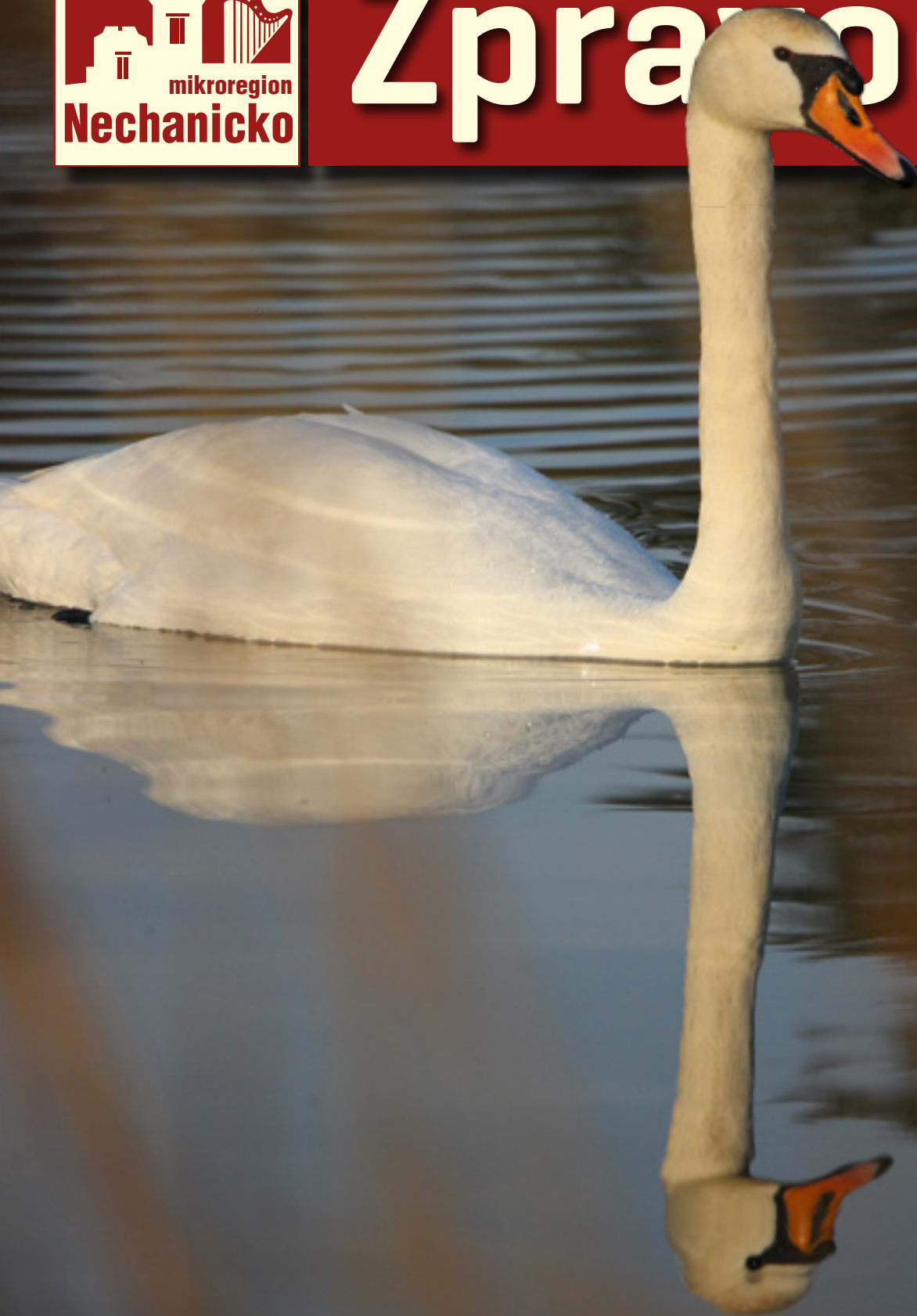
LABUŤ NA RYBNÍKU V HORNÍCH DOHALICÍCH