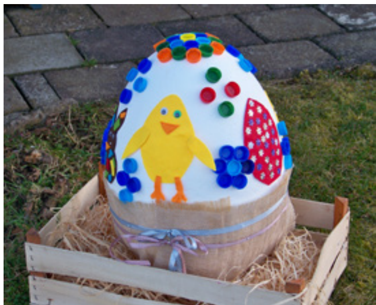
▪ Toto ozdobené velikonoční vajíčko získalo nejvíce hlasů.