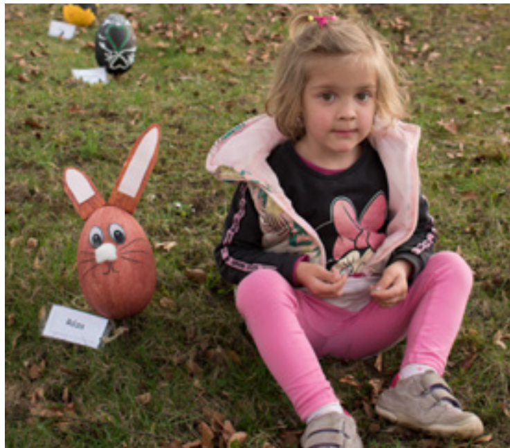
Velikonočního zajíčka vyrobila Rozárka se svou maminkou.