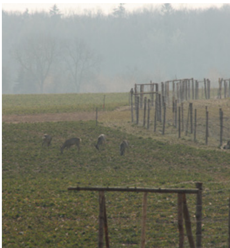
▪ Výsadba u Lubna.

spoluprací ochránců přírody, samosprávy a zemědělců podpořený Německou spolkovou nadací pro životní prostředí DBU. Karolína Mikšlová