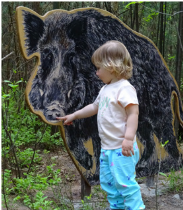
▪ Stezka siluet v Městských lesích HK.