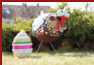
VELIKONOCE NA NÁVSI V MOKROVOUSÍCH