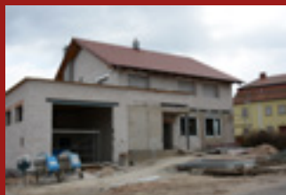
REKONSTRUKCE V HNĚVČEVSI