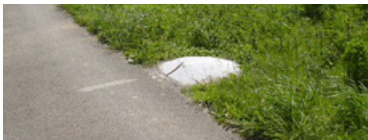
▪ Kneiff, nejvyšší bod Lucemburska [560 m].