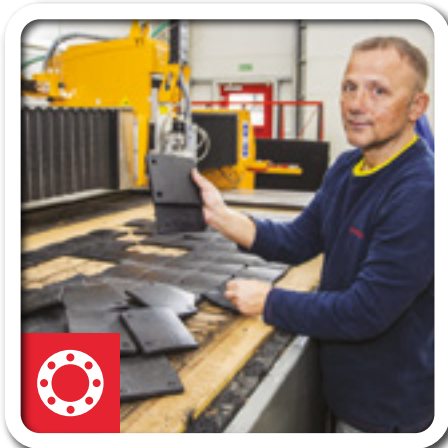
Těsnění na míru