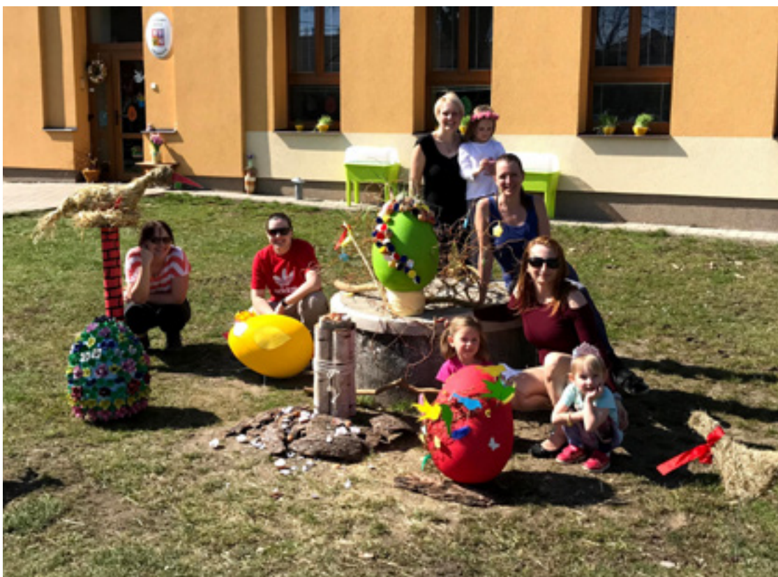
▪ Velikonoční výzdoba před školkou.