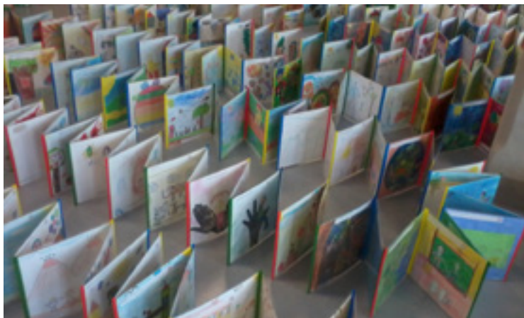
■ Soutěž v tvorbě pohádkových lepoprel vrcholí.