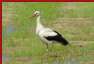
ZDRAVÁ KRAJINA MIKROREGIONU