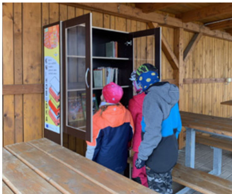
Knihobudka v Sadové má své první zvědavé čtenáře.