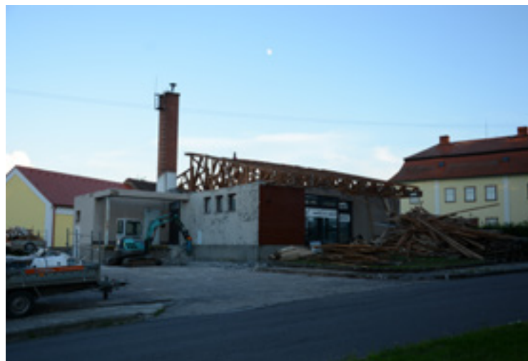
▪ Částečná demolice teď už bývalé prodejny potravin.