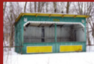
KAMENICE V PŠÁNKÁCH OŽIVÁ