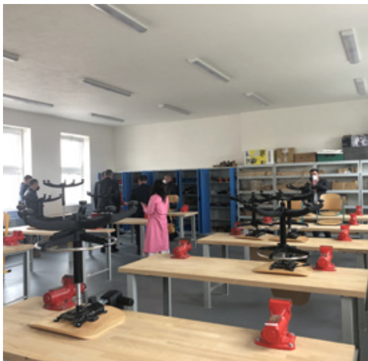
▪ Ukrajinská delegace navštívila nechanickou školu.