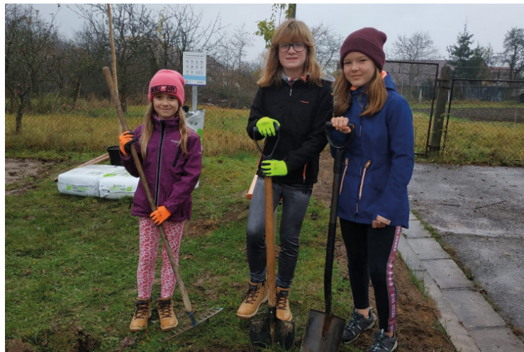
▪ Do sázení stromů se zapojily i děti.