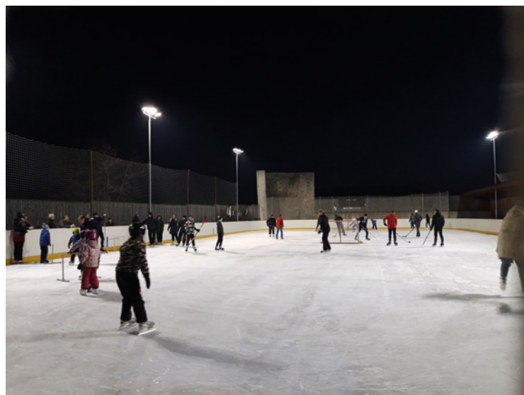
▪ Bruslení na ledové ploše ve Mžanech.