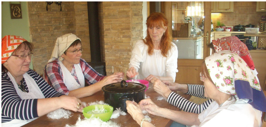
■ Draní peří - jedna z obnovených tradic