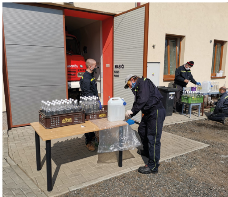
■ Na distribuci dezinfekce spolupracovalo několik obcí.