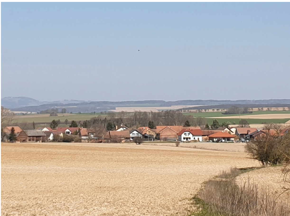
▪ Pohled na obec Pšánky.