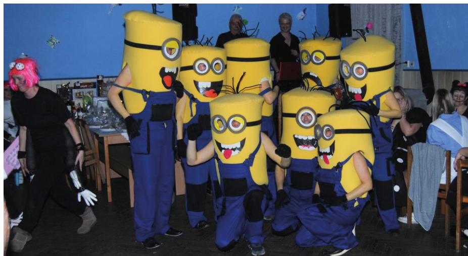
■ Jedna z masek na karnevale – Mimoňové.