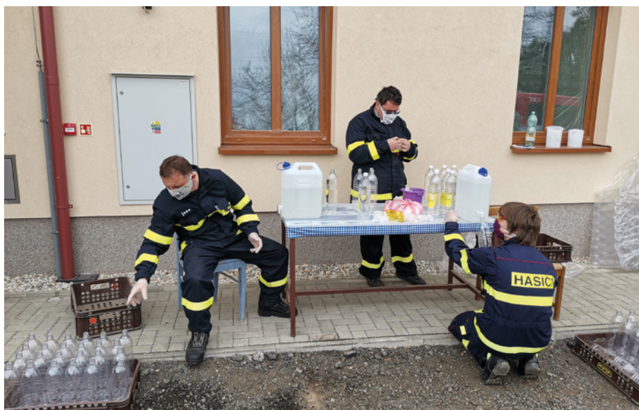
■ Hasiči ze Stračova.