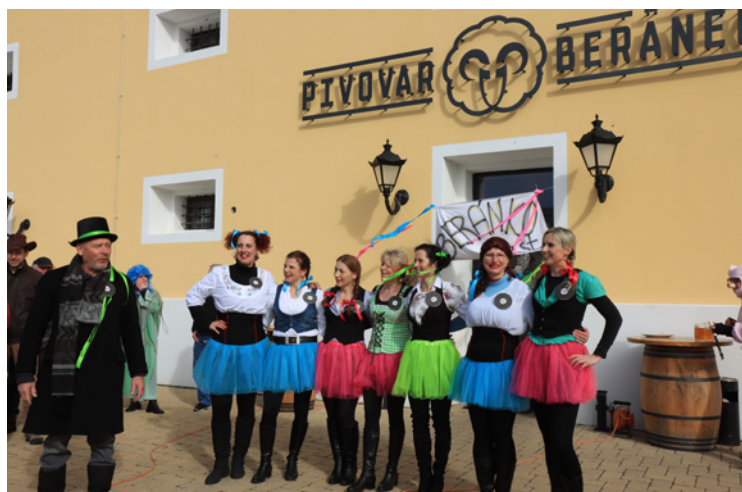
▪ Jedna ze zastávek byla před pivovarem Beránek.