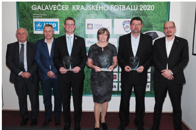
▪ 10. ročník galavečera Královéhradeckého krajského fotbalového svazu.