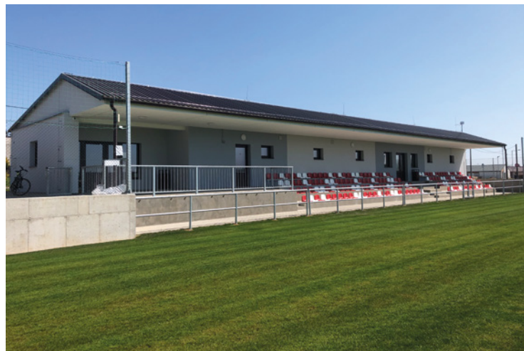
▪ Nový fotbalový areál v Nechanicích.