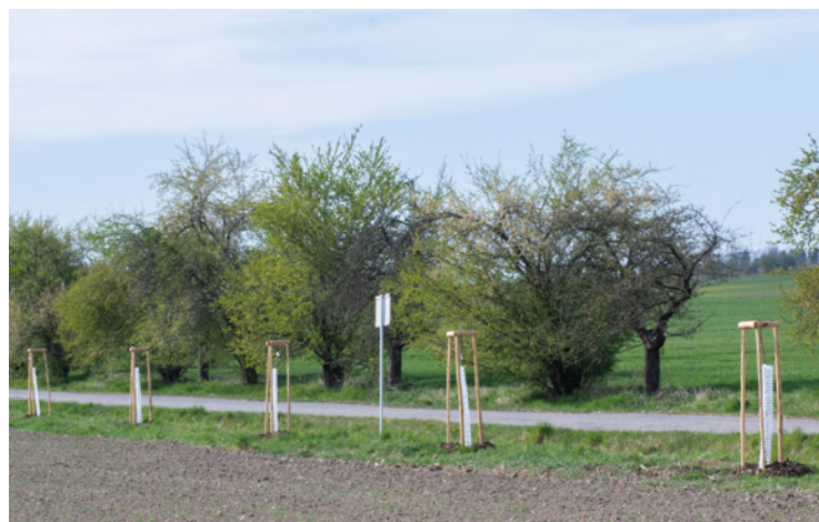
▪ Alej vedoucí do Horních Černůtek.