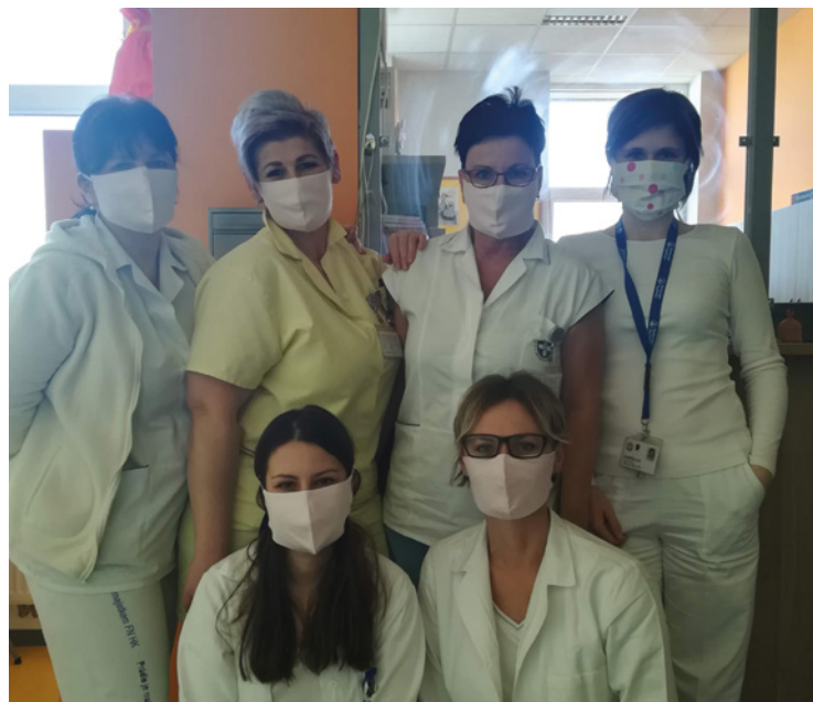
▪ Sadovské roušky slouží v nemocnici v Hradci Králové.