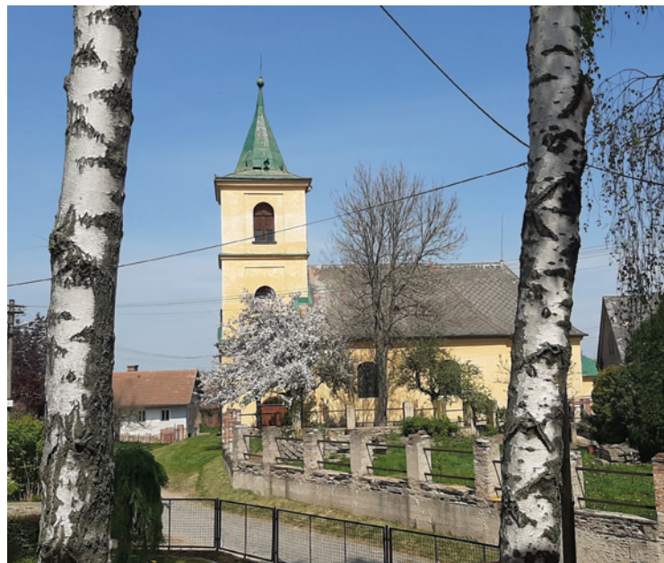
▪ Boharyňský kostelík.