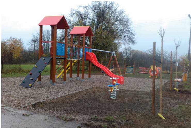
▪ Na sídlišti vyrostlo nové dětské hřiště.