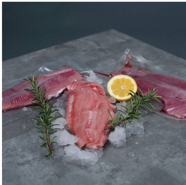
▪ ZAS nabízí Sumečka afrického.