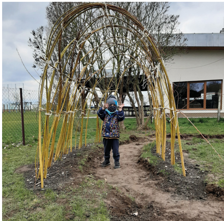
▪ Na zahradě školky vyrostly domečky z vrbového proutí.

Za ZŠ a MŠ Boharyně Kamila Hellerová a Lucie Tomášková