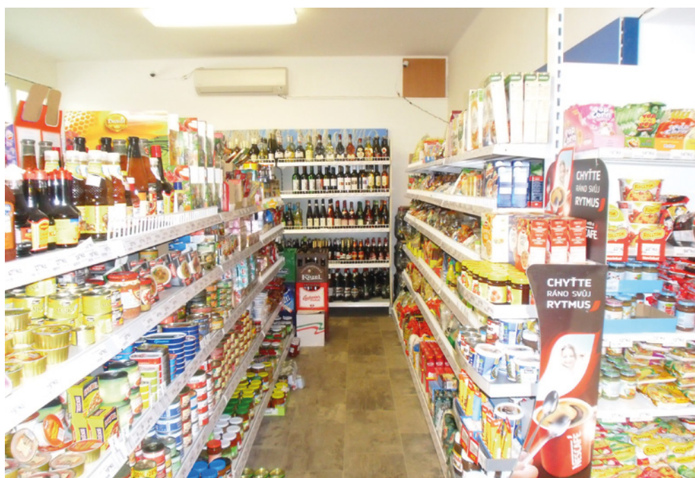
■ Obchod v Dolním Přímě je dobře zásobený.