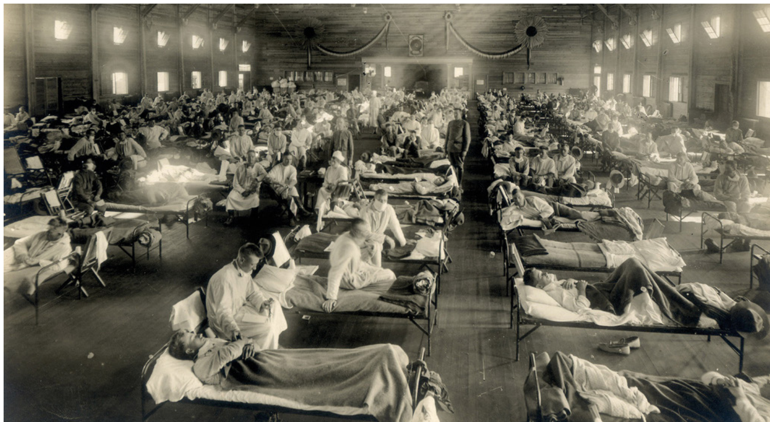
■ ŠPANĚLSKÁ CHŘIPKA