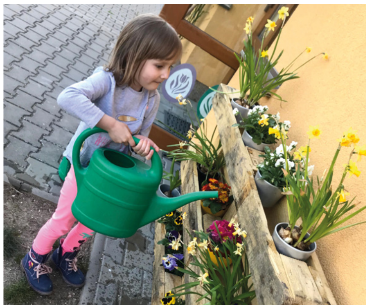
▪ Jarní výzdoba školky.