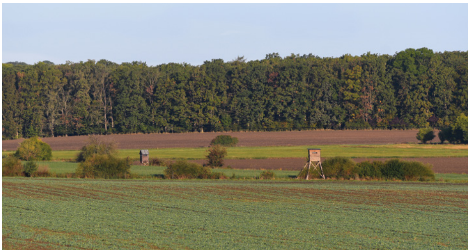
■ Posedy u lesa Borovničky.