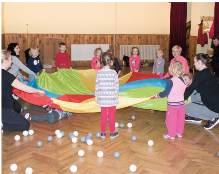
▪ Program pro děti a rodiče "předškoláci a pohyb".

Renata Hladíková manažer projektu Denisa Jenčovská komunitní pracovník