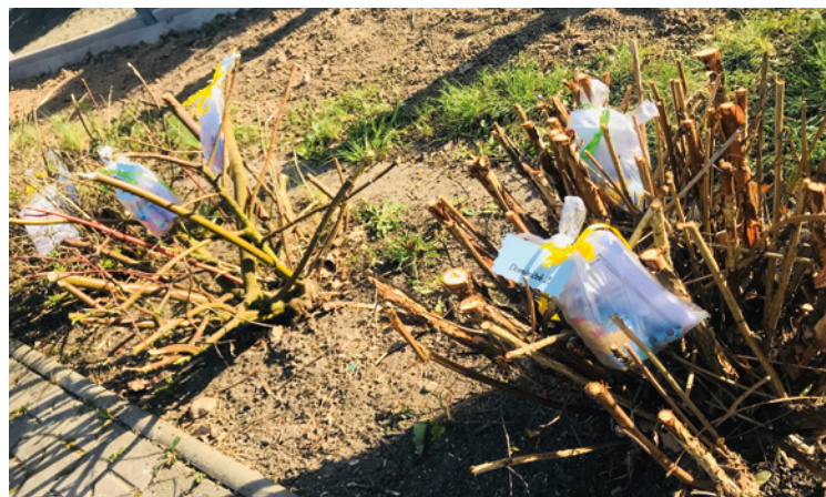
▪ Koleda pro děti z MŠ Třesovice.