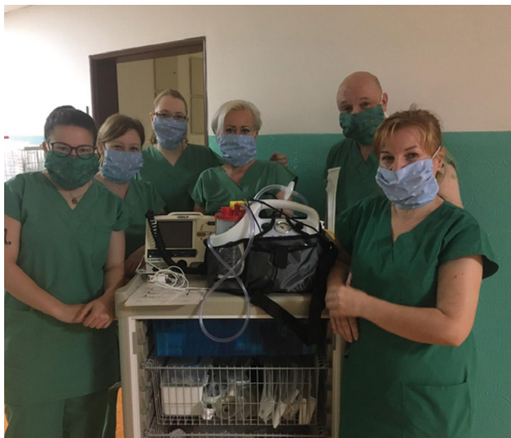
▪ Pozdrav z nemocnice z Vrchlabí.