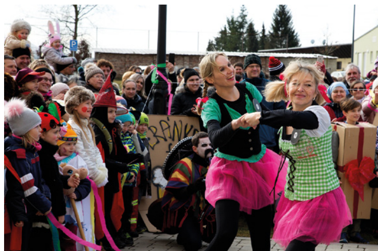
▪ Mezi maskami nechyběly šenkýřky.