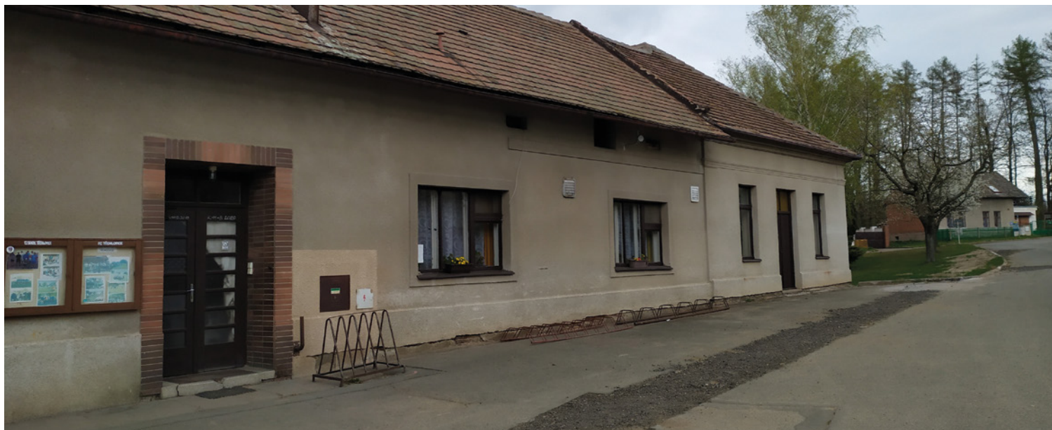
▪ Těchlovická hospoda.