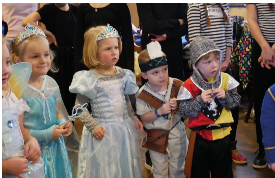
■ Na karnevalu nesměly chybět masky princezen.