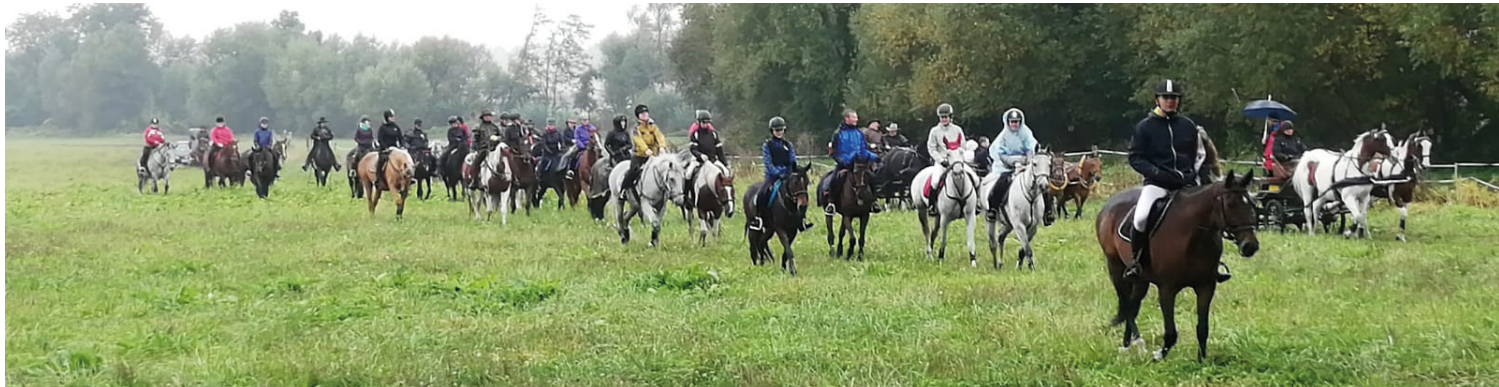
▪ Hubertovu jízdu provázal déšť.