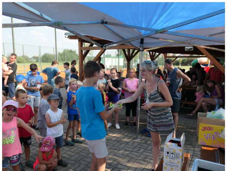
■ Závěrem sportovního dne nechybělo předání cen.