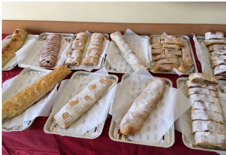
■ Radostovské vzorky štrúdlu.