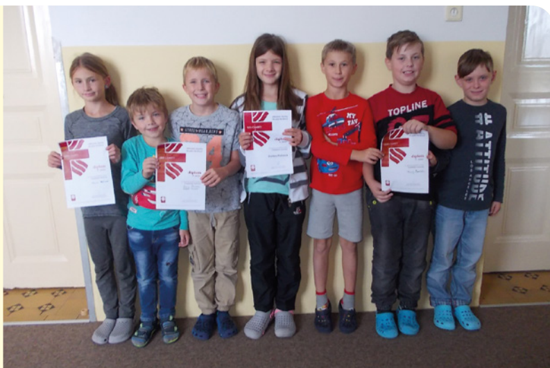
▪ Ocenění výtvarníci z Probluze.