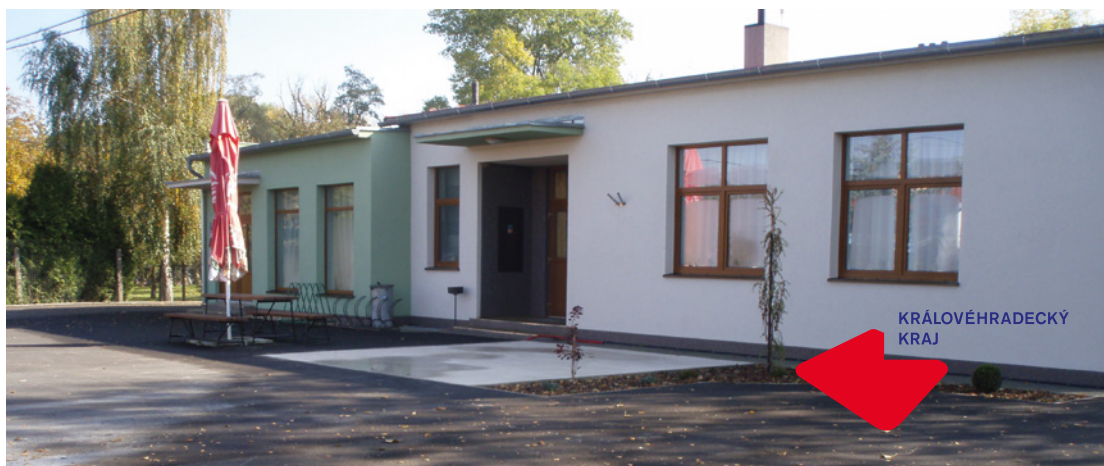
▪ Puchlovice - nová asfaltová plocha s dotační podporou Královéhradeckého kraje.