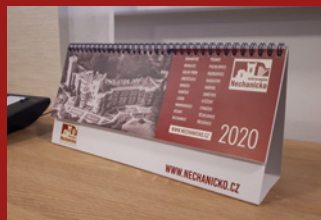
KALENDÁŘ MIKROREGIONU 2020