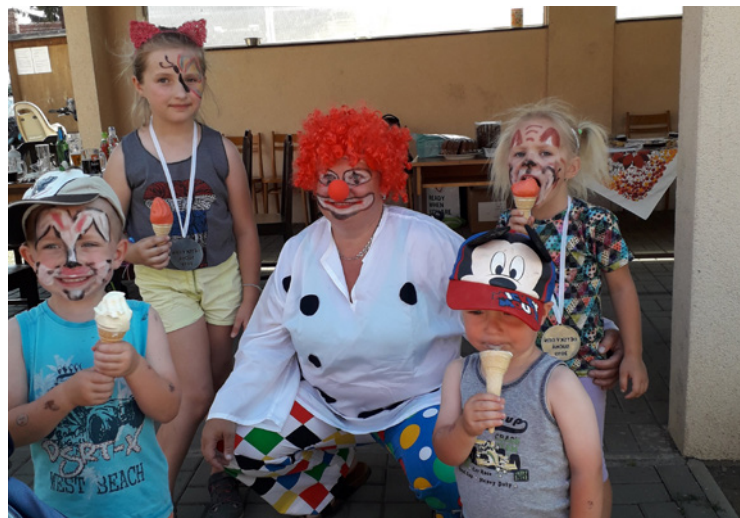
▪ Děti si užili malování na obličeje i společnost klauna.