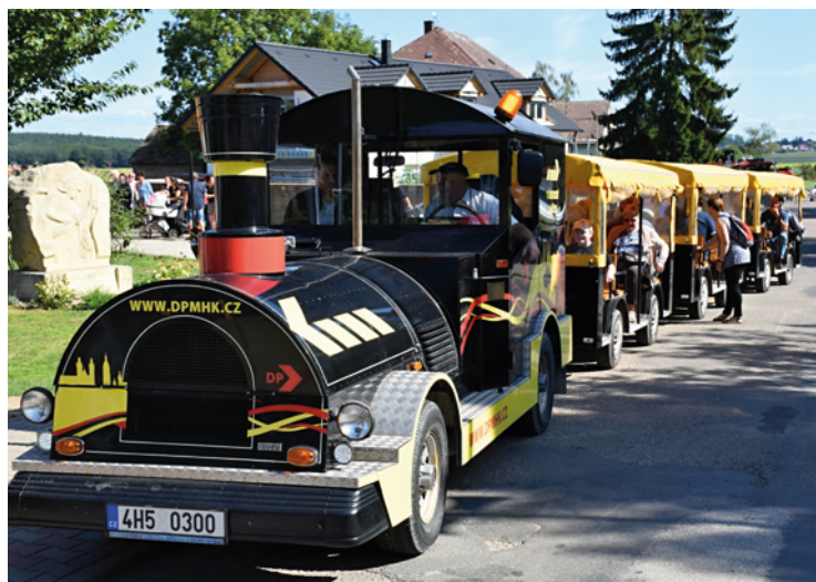
▪ Velkou atrakcí pro děti i dospělé byl bezpochyby turistický vláček.