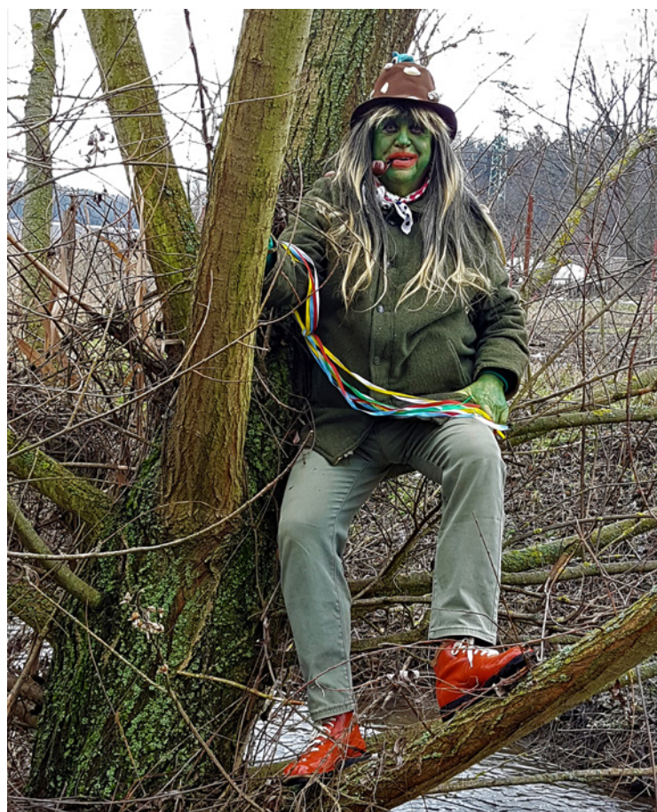
▪ Nerošovský vodník.