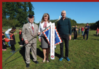
100 LET TJ SOKOL TĚCHLOVICE