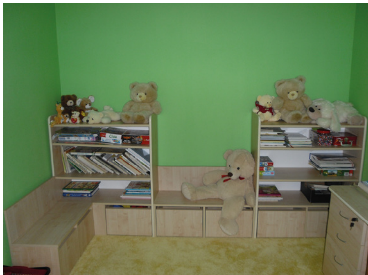
▪ Herny mateřské školy jsme vybavili i novým nábytkem.