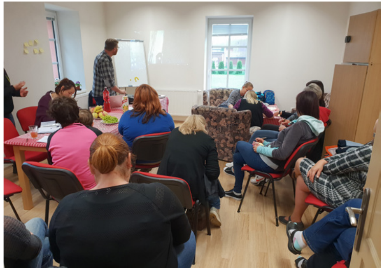
■ Vzdělávací semináře se setkali se zájmem veřejnosti.