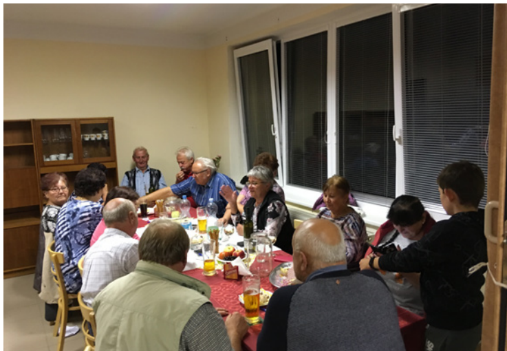
■ Posezení se protáhlo do večerních hodin.