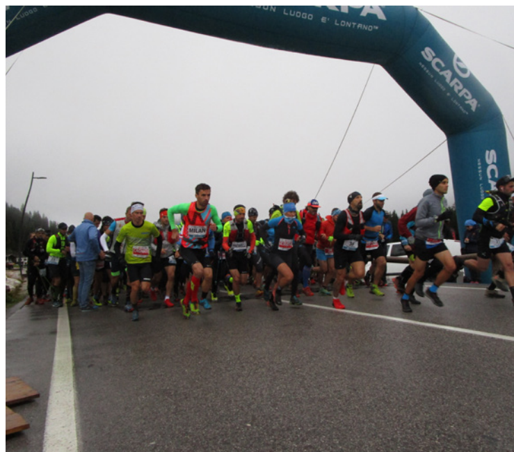
▪ Náročný závodu přilákal spoustu účastníků.