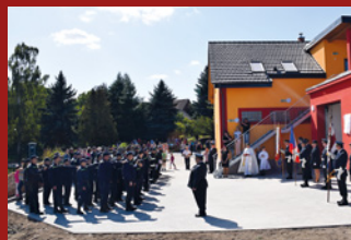
OSLAVY NA HRÁDKU