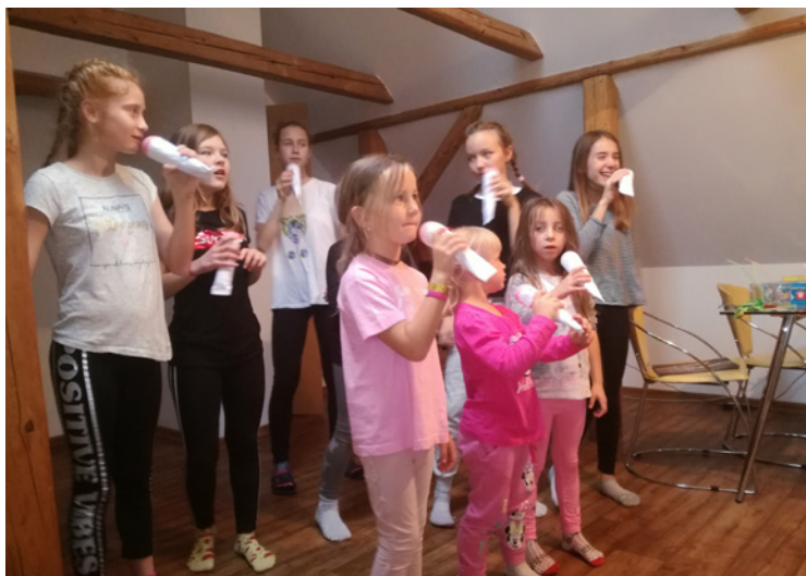
▪ Na soustředění nechyběl ani nácvik zpívání na mikrofon.