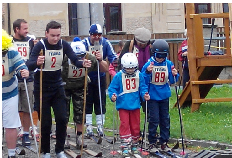
▪ Závodníci se formují na startu.