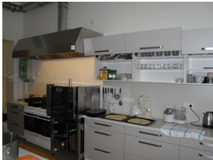
▪ Rekonstrukce ve škole začala v kuchyni.