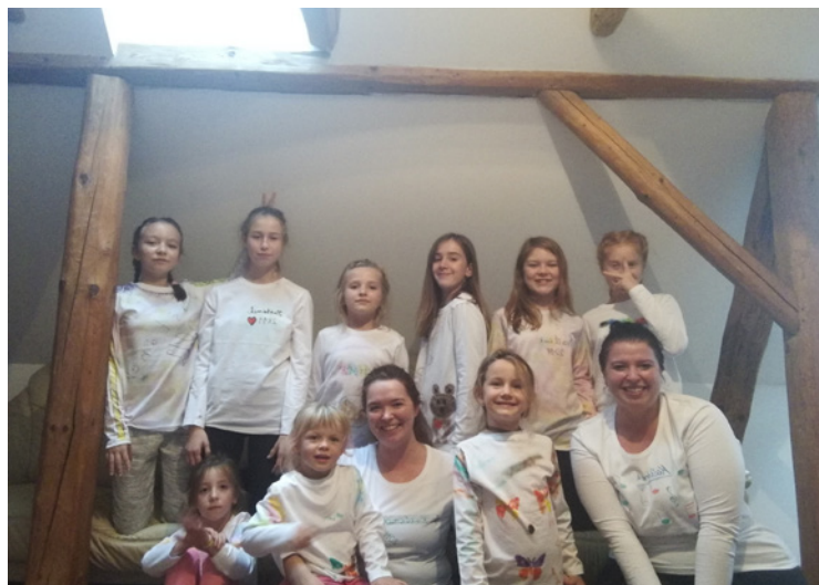
▪ V pauze mezi zpíváním nechybělo malování na trička.