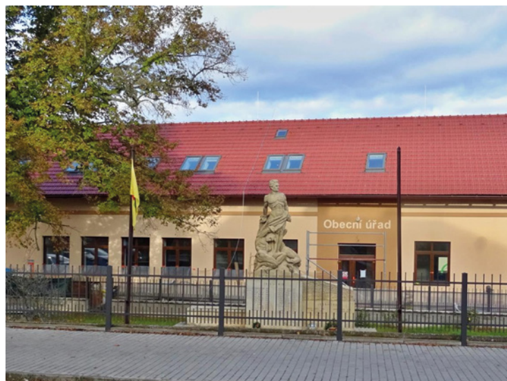
▪ Budova obecního úřadu prošla zásadní rekonstrukcí.