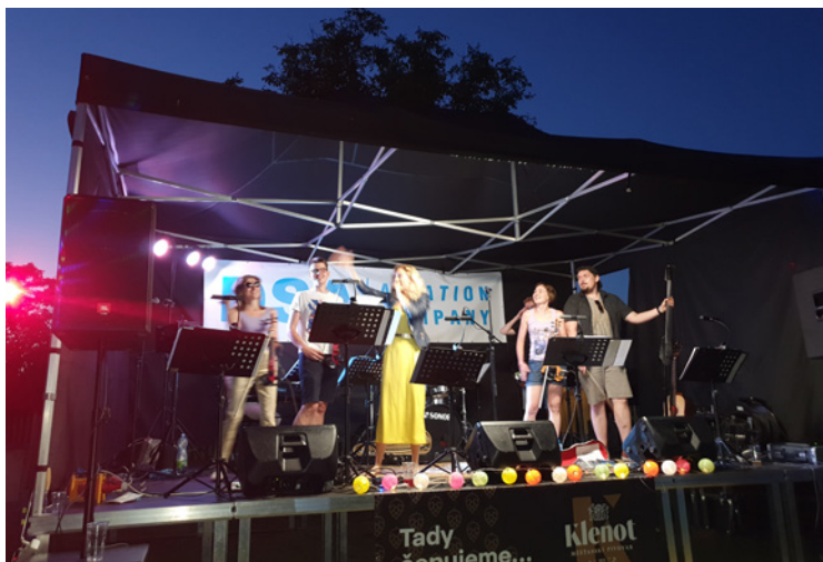
▪ Kulturní festival v Hřibsku měl velký úspěch.