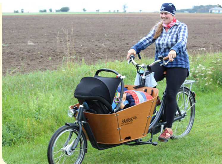
▪ Nejmladší účastník závodu si cestu na kole užil s maminkou.