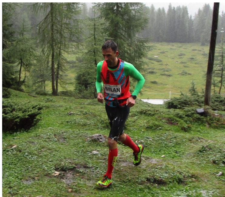
▪ Cesta na mistrovství v Argentině.