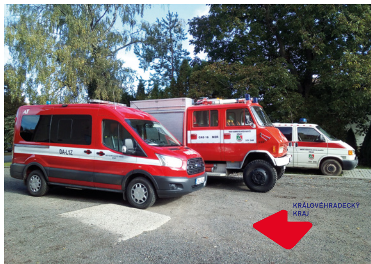
■ Hasičská technika JPO Mžany.