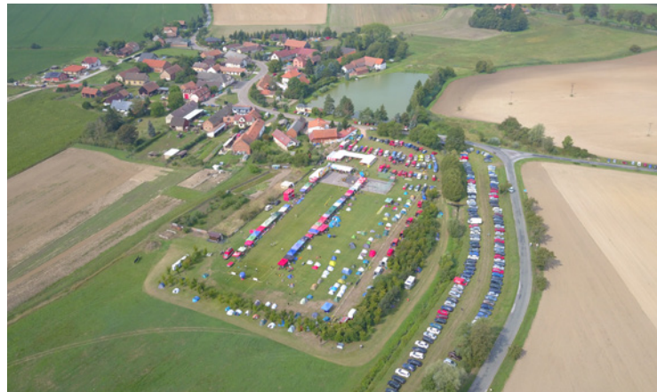
▪ Pšánky měly tento den o 650 návštěvníků více.