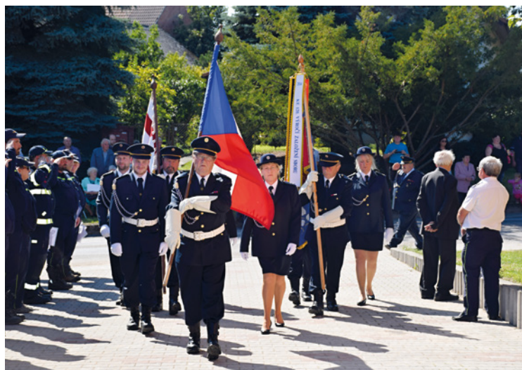
▪ Slavnostní průvod mířil od obchodu k obecnímu hřišti.