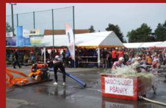
O POHÁR STAROSTY PŠÁNEK