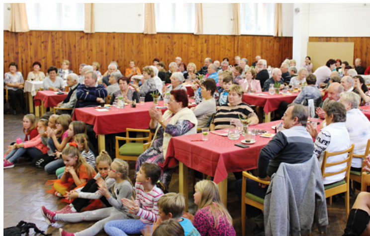
▪ Více než 120 seniorů přijalo pozvání do Dohalic.