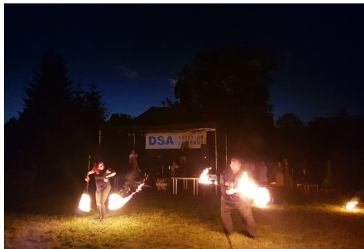
▪ Závěrem nechyběla ohnivá show skupiny Ascarya.