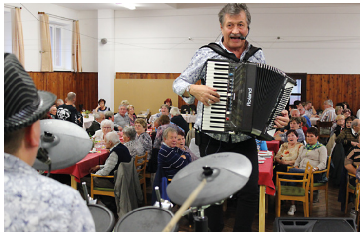
▪ K poslechu a tanci zahrála kapela Pepino Band.