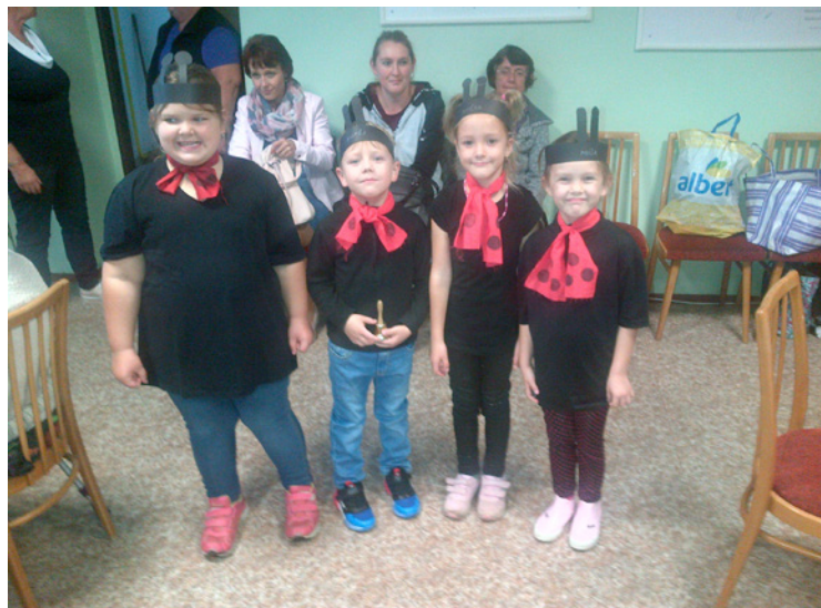
▪ Společné setkání seniorů a dětí bylo pro všechny přínosné.