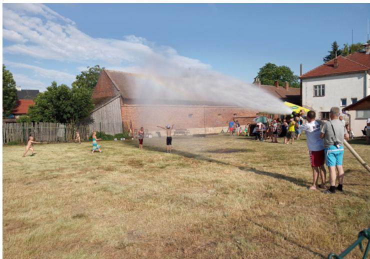
▪ Prohlídku auta a osvěžení nám umožnil SDH Nechanice.