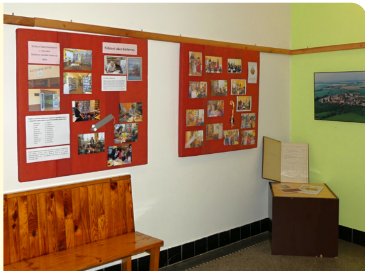
▪ Výstava ve Štolbově městské knihovně.