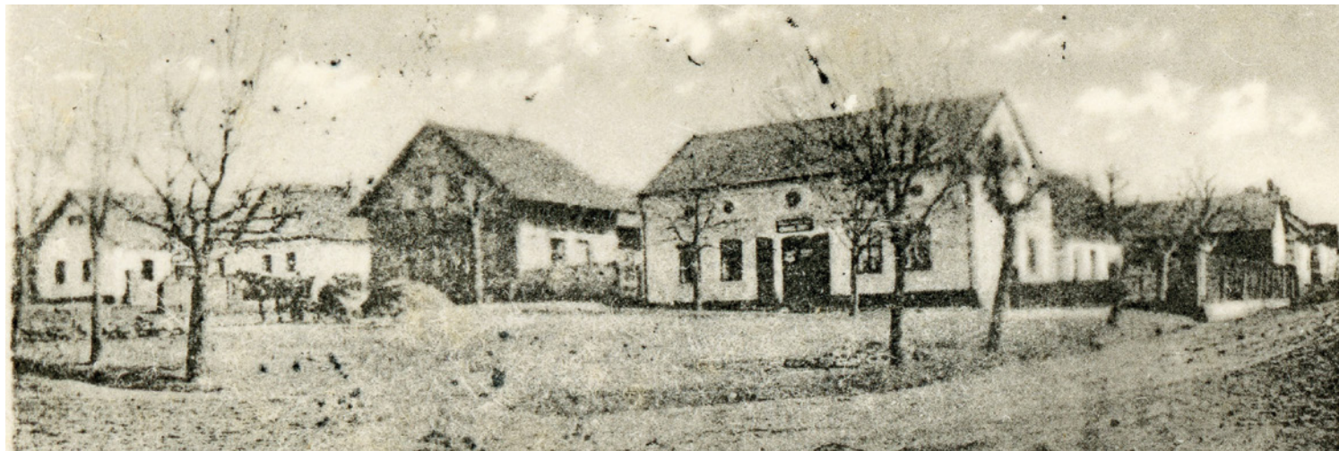
■ Návés ve Stračově z doby kolem 1. světové války