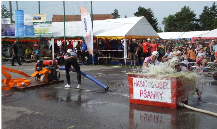
▪ Družstvo muži z Pšánek.

gách umístily hasičky z Dětkovic, na druhém místě s časem 16:45 s se umístily hasičky z Letohradu – Orlice. Třetí místo v Extralize patřilo hasičkám ze Staré Říše (16:45 s) a ve Východočeské hasičské lize se na třetím místě umístily hasičky z Renmotoru Jinolice (16:57 s). Velký dík patří všem sponzorům a pořadatelům, kteří se na realizaci soutěže podíleli a díky nimž soutěž každoročně dosahuje své vysoké kvality. Soutěž byla realizována za finanční podpory Královéhradeckého kraje. Václav Zubr