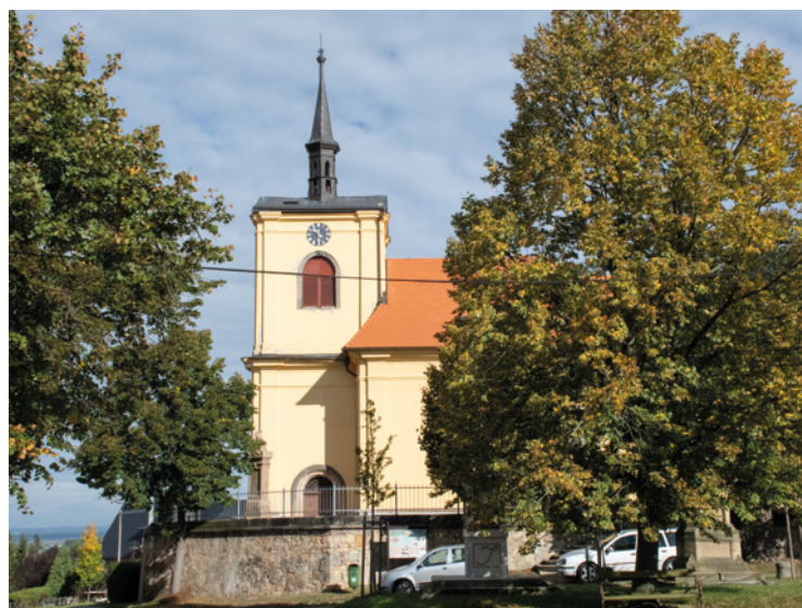
▪ Kostel Probluz - historie a současnost.