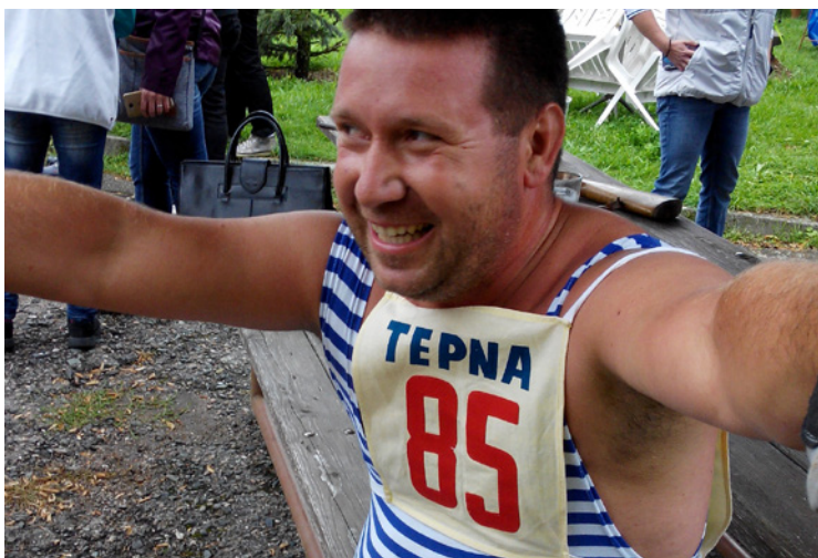
▪ Hříbecká 50 - po doběhu.