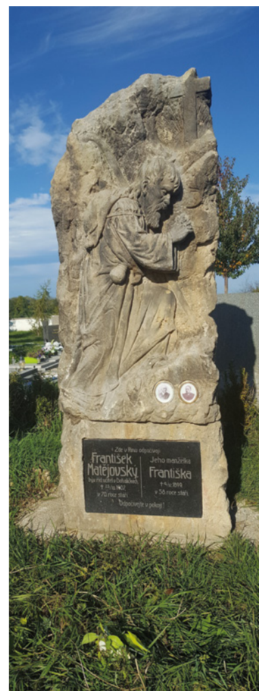
■ Náhrobek Františka Matějovského.