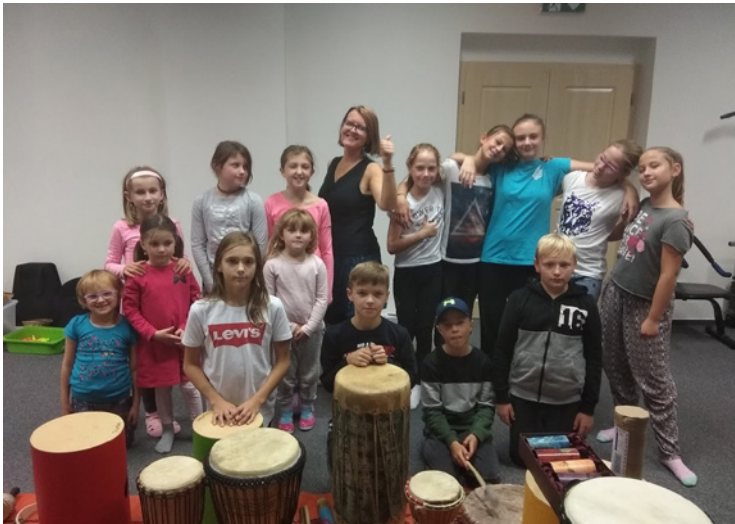
■ Na jednom ze vzdělávacích seminářů nechyběla muzika.