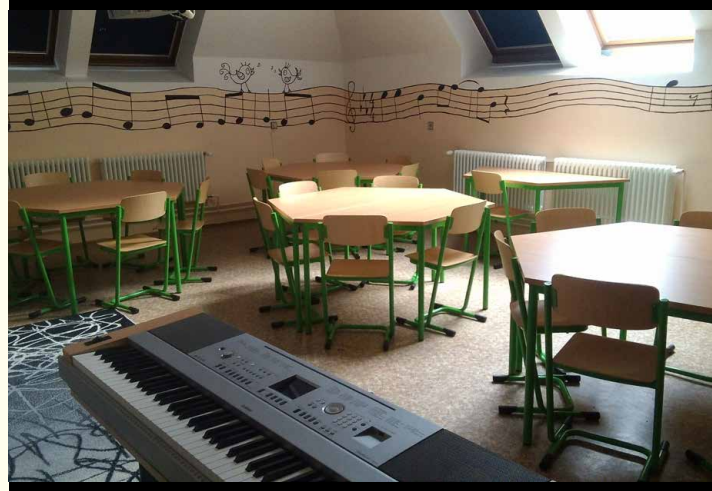
Učebna v ZŠ a MŠ Dukelských bojovníků, Dubenec