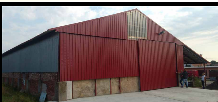
Hala v Boharyni ZS Kratonohy