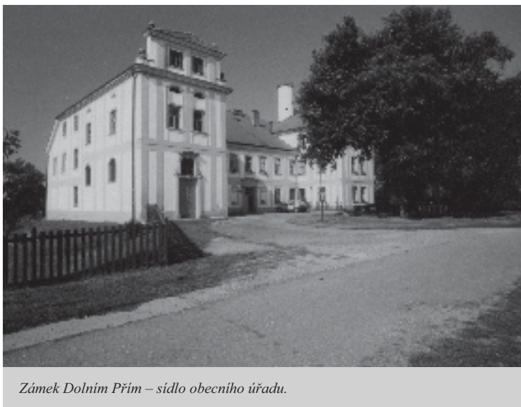
Zámek Dolním Příim – sídlo obecního úřadu.