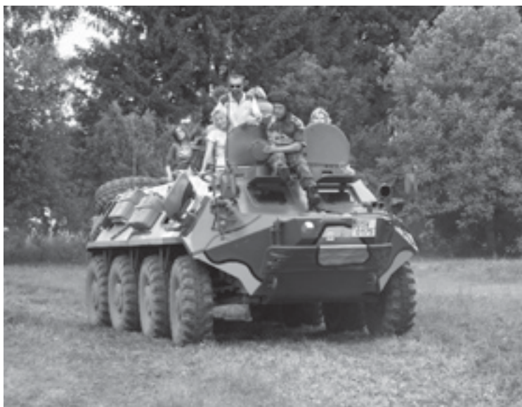
Obrněný transportér v „akci“.