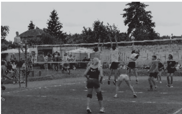
Součástí oslav byl i volejbalový turnaj smíšených družstev.