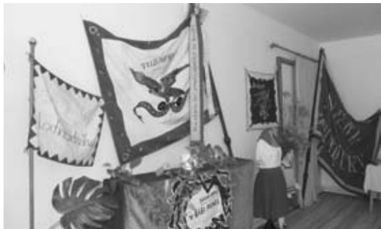
Historické prapory a sokolské kroje - fotografie z výstavy ke 140. výročí založení.

Skromně, ale důstojně proběhly oslavy 140. výročí založení sokolské jednoty v Nechanicích. Byly soustředěny do hlavního termínu v sobotu 16. června, kdy od rána probíhalo několik akcí, o týden později doznávaly již jen turnajem v nohejbalu.