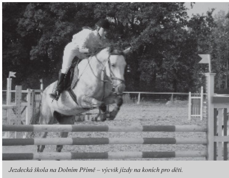
Jezdecká škola na Dolním Příimě – výcvik jízdy na koních pro děti.

Pozn. redakce: historické údaje jsou čerpány z publikace Vlastivěda Královéhradecká.