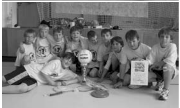
Vítězná družstva vybíjené (nahore Stěžery - 1. kategorie, dole Libčany - 2. kategorie).