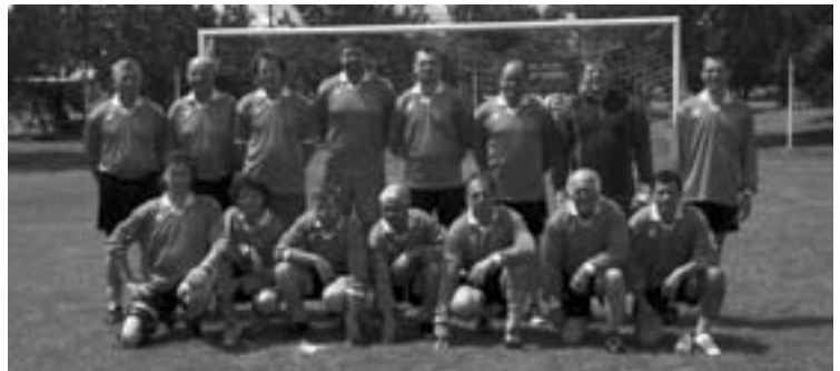
FC LOTŘI (nahore) FC Fotři (dole).