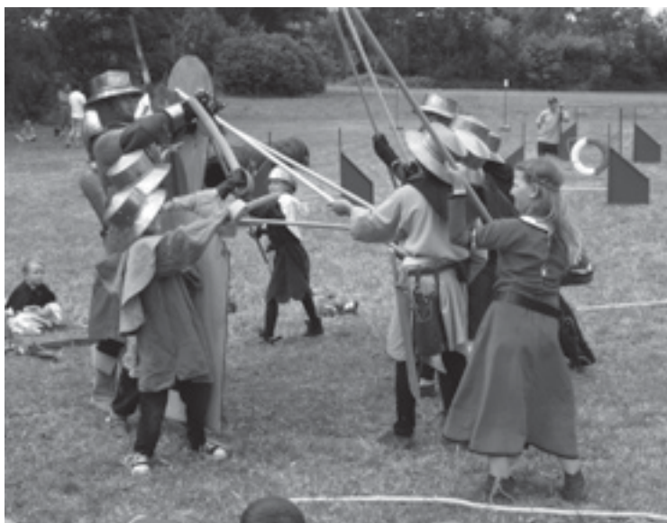
Kroužek historického šermu Tesák Všestary při svém vystoupení.