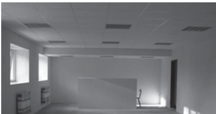
Herna mateřského centra v prostorách kulturního domu.