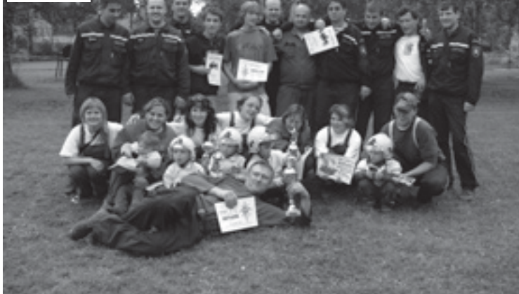
Sbor dobrovolných hasičů Sovětice.