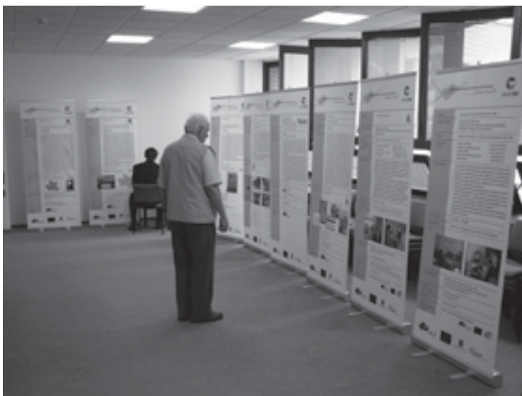
Prezentace projektů tématické skupiny Doprava, infrastruktura a internetizace.