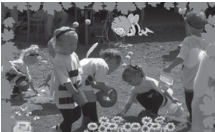
Vystoupení dětí z mateřského centra na Včelařském dni.