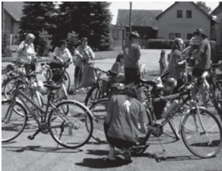
Cíl našeho putování na kolech v Pšánkách před hostincem „U Růženky“.