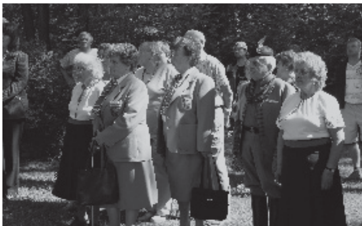
Zástupci Sokolské župy Orlické.