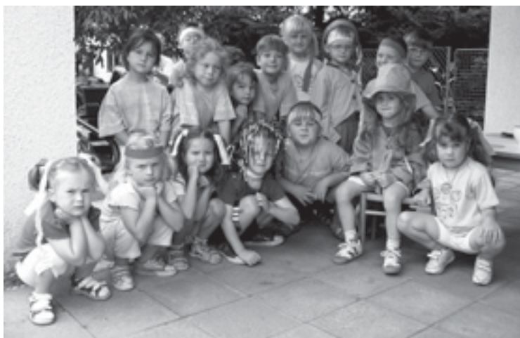
Vodníčky a vodnice z Mateřské školy Boharyně.

Pozn. redakce: Pozor! Slovo vodnice považujeme za novotvar a významný přínos do pokladnice českého jazyka. Neplést se slovem svodnice (viz meliorační a ostatní vodohospodářské práce), či dokonce svůdnice, zejména když malé boharyňské vodnice jistě jsou soudě podle fotografie svůdné, ale vodníčky dosud ještě nesváděly.