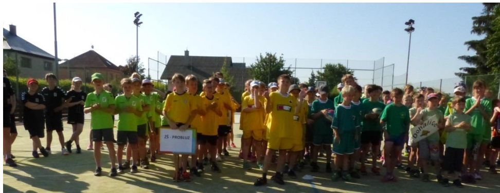
Zahájení turnaje ve vybíjené základních škol mikroregionu

Pro školní a školkové děti jsme v letošním roce připravili sportovní klání – vybijenou základních škol, olympiádu mateřských škol.