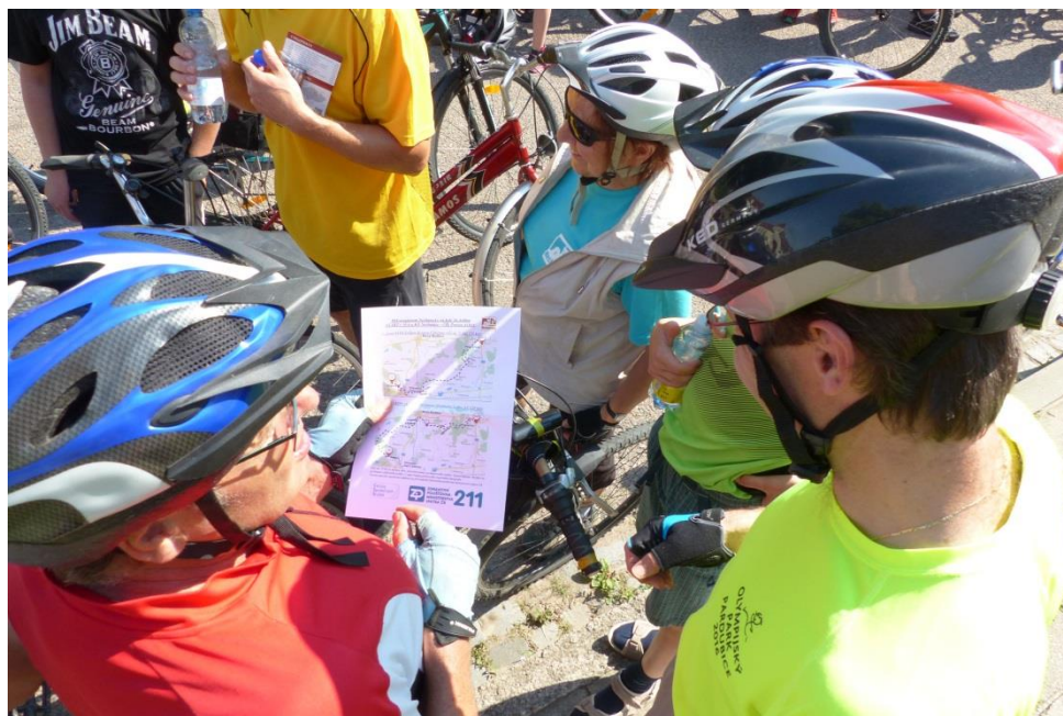
Start cyklistické akce před kulturním domem v Nechanicích

Prioritou letošního roku je realizace projektu výsadby zeleně v extravilánech obcí Boharyně, Hněvčev, Hrádek, Mokrovousy, Nechanice, Radíkovice, Sovětice, Stěžery a Stračov. Venkovní učebny přes prázdniny vyrostou v Dohalicích a ve Stěžerách. Hasičská zbrojnice bude opravena ve Mžanech. V Mateřské škole Třesovice dojde, kromě vnitřních oprav, také k instalaci herních prvků na zahradě školky, v Mokrovousích vyroste všesportovní hřiště, Dolní Přím opraví márnici, na Hrádku bude postaven multifunkční objekt nejen pro hasiče a Pšánky budou mít svůj obecní znak. Za všemi projekty stojí kromě starostů také zaměstnanci CSS. Škála naší činnosti je opravdu široká a jsme rádi, že tu můžeme v regionu odvést práci, která přinese užitek našim občanům a doufejme – je vidět.