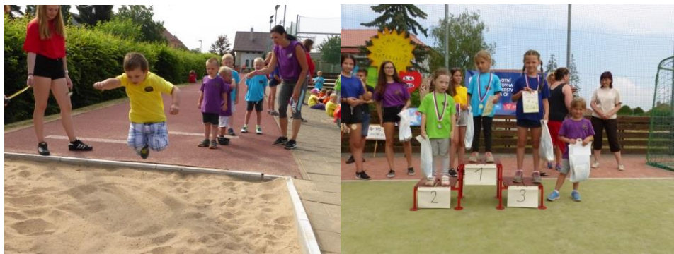
Skok do dálky – jedna z olympijských disciplín.

V obou sportovních projektech budeme určitě pokračovat i v příštích letech. Stejně tak i s cyklistickými výlety na kolech po regionu. Vyzýváme čtenáře – napište nám, jestli se chcete pochlubit se svou vesnicí – pokud ano, přijedeme rádi i k vám.