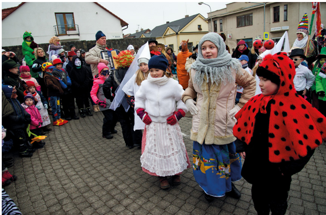
■ Masopust Stěžery.