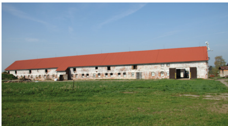
▪ Modernizace v ZAS Mžany.