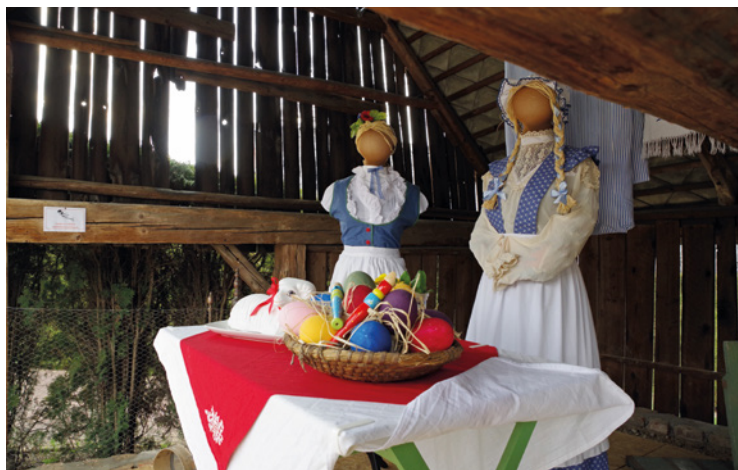
▪ Velikonoční výstava.