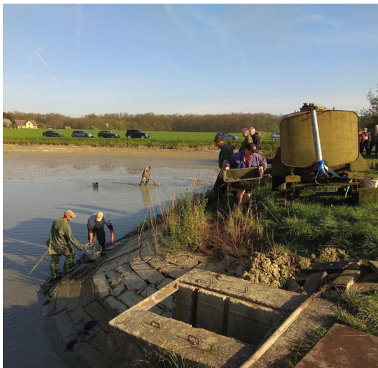
▪ Výlov rybníku Žabínek.