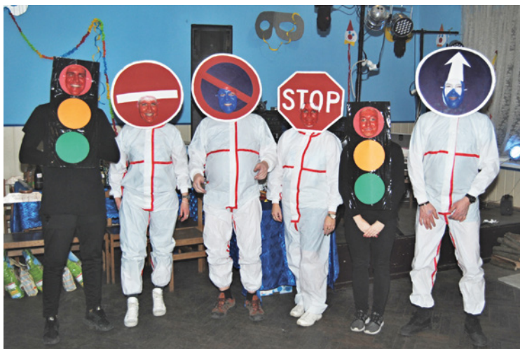
▪ Bábinec 2018.