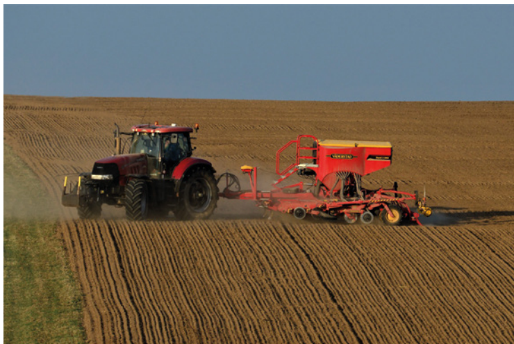
▪ Nový secí stroj v ZAS Mžany.