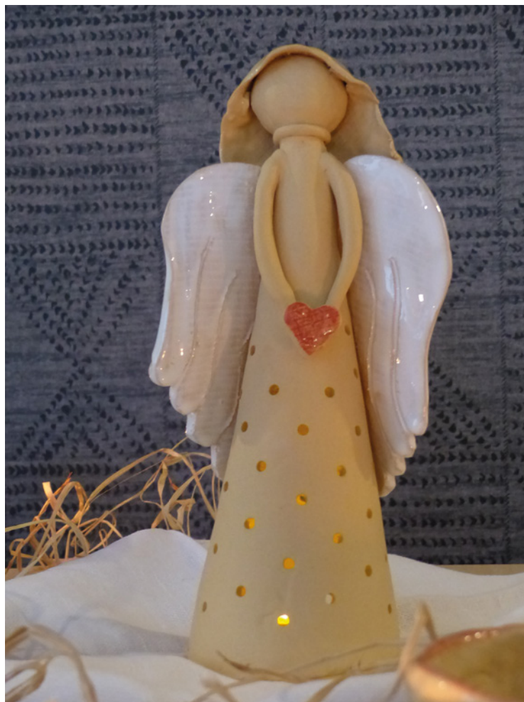
▪ Anděl – jeden z nejhezčích výrobků keramického kurzu.