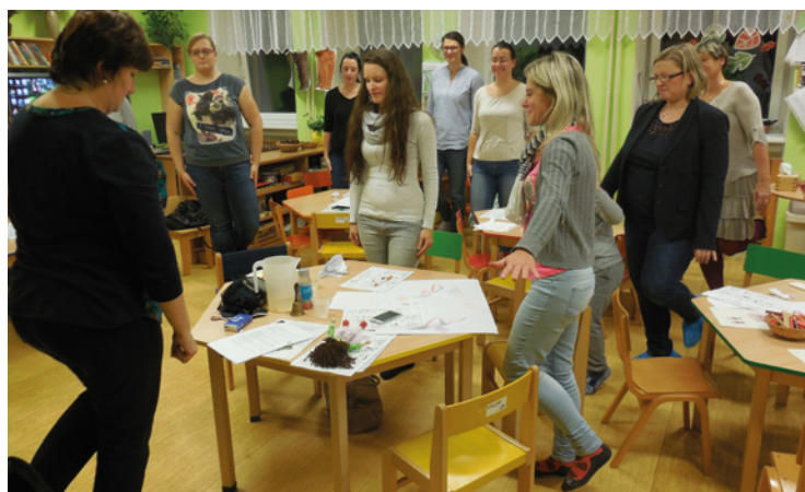
■ Setkání rodičů v MŠ Stěžery na téma grafomotorika.