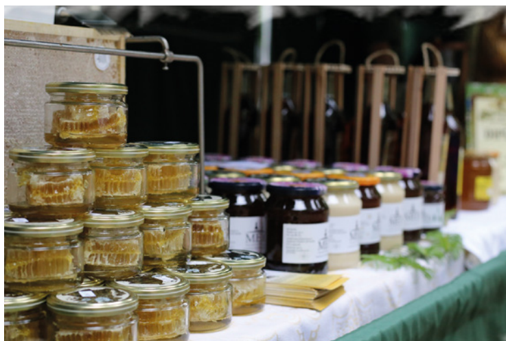
▪ Produkty z medu nesmí na slavnostech chybět.