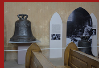
EXPOZICE V SUCHÉ...