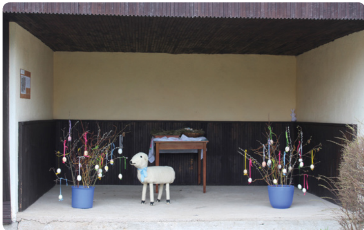
▪ Výzdoba zastávky ve Stračovské Lhotě.