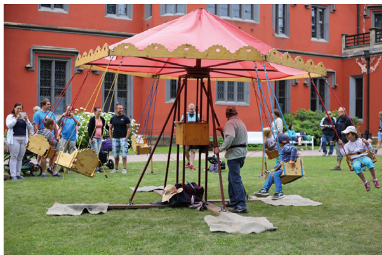
▪ Prostranství zámku je návštěvníkům plně k dispozici.