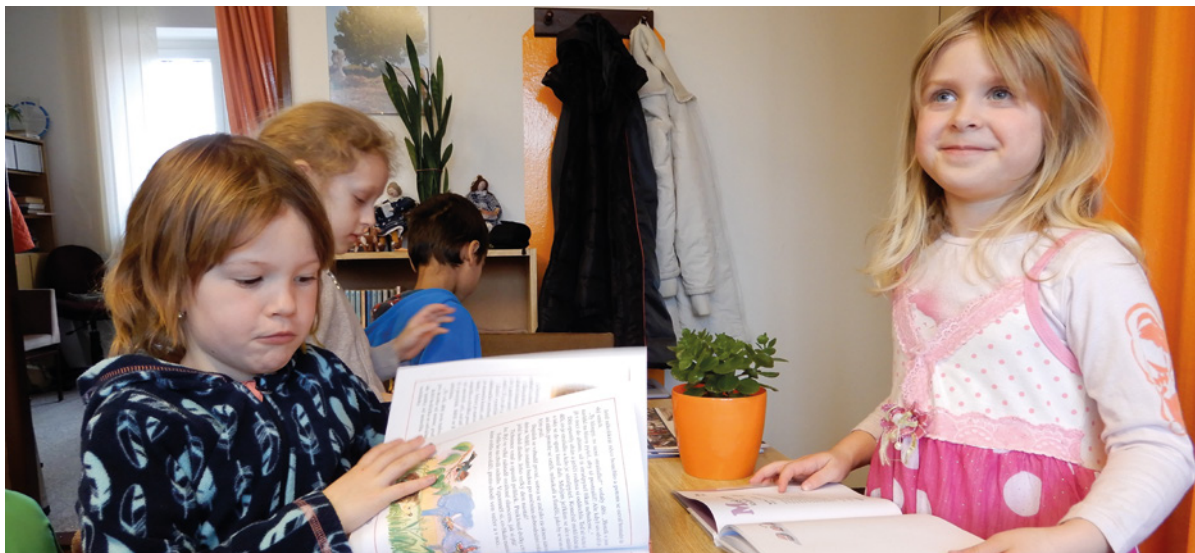
▪ Malí návštěvníci knihovny.