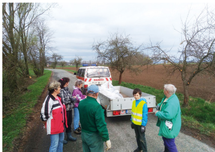
■ Úklid proběhl i ve Stračovské Lhotě.