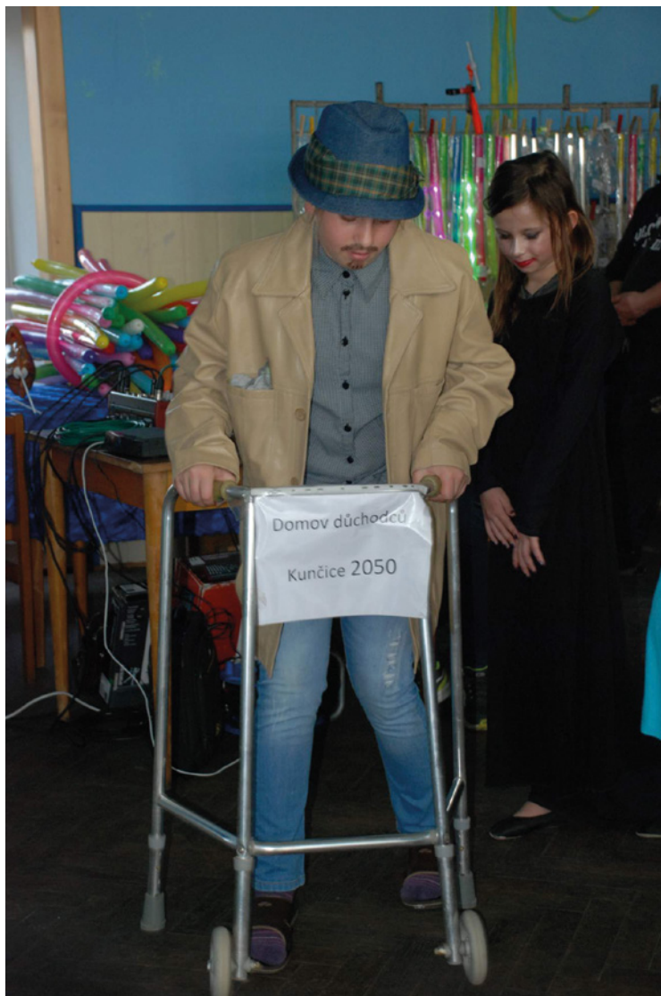
▪ Dětský karneval 2018.