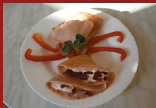
ZDRAVÁ ŠKOLNÍ JÍDELNA...