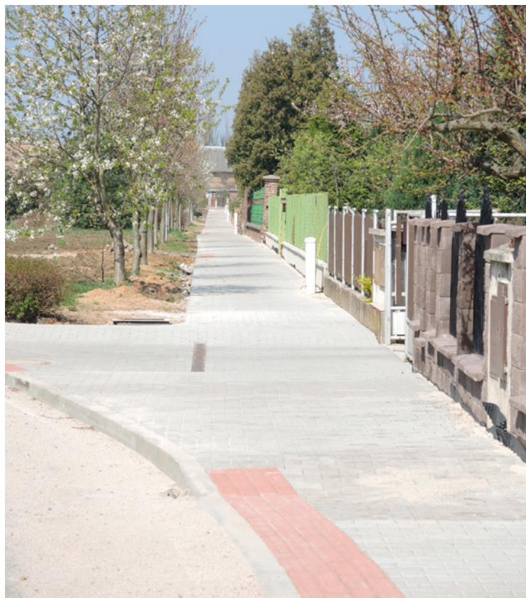
▪ Rekonstrukce chodníku v Urbanicích.