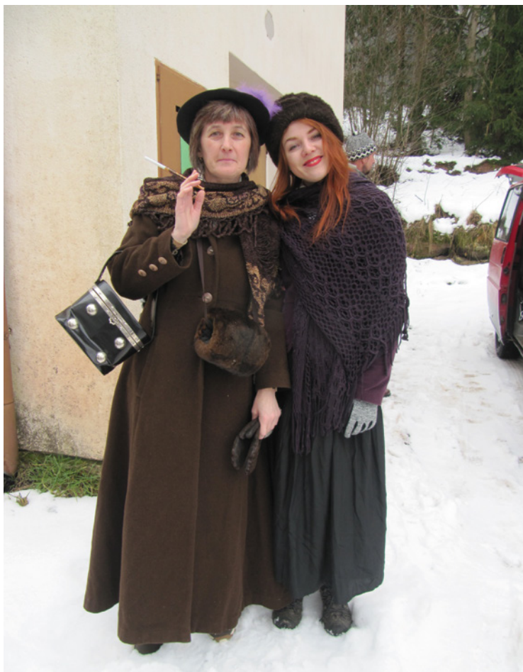
▪ Dámy z Černůtek vzorně reprezentovaly.