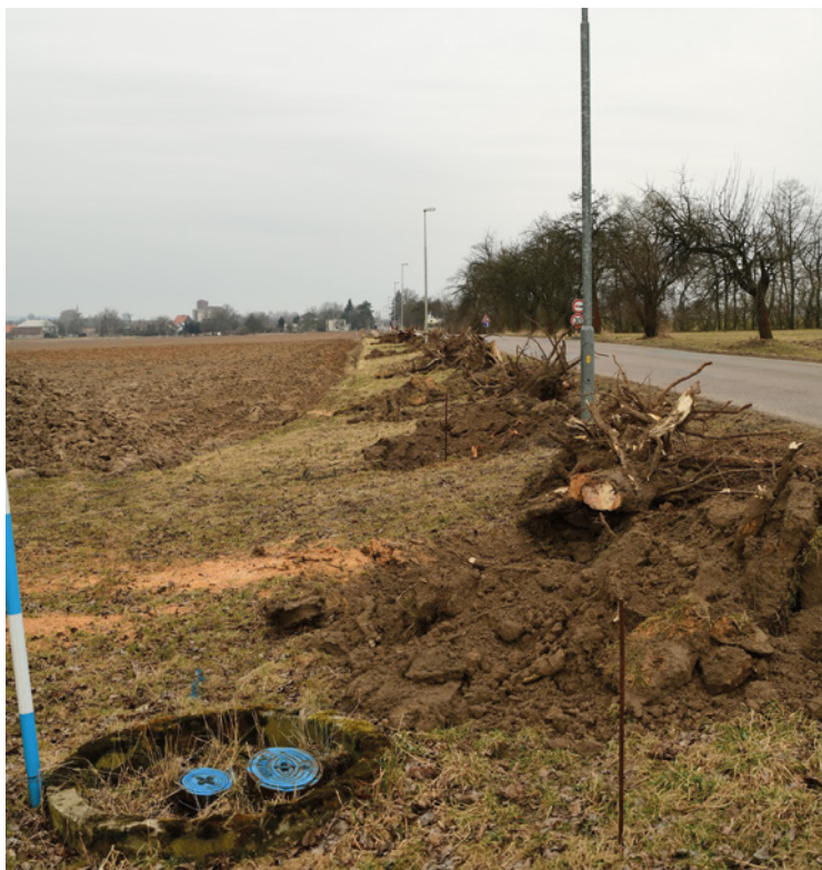
▪ Březen 2018 - zahájení prací.