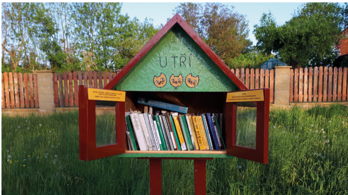
▪ Lubenská knihobudka.