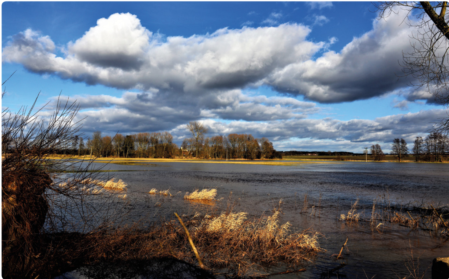
▪ Jarní louky mezi Suchou a Třesovicemi.