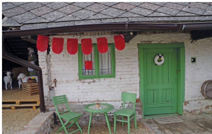
▪ Vejměnek.