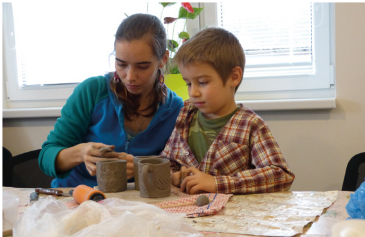
▪ Soustředění kurzisté.