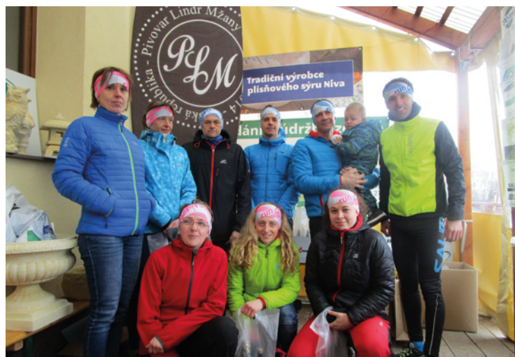
▪ Odměny na závěr nesměly chybět.