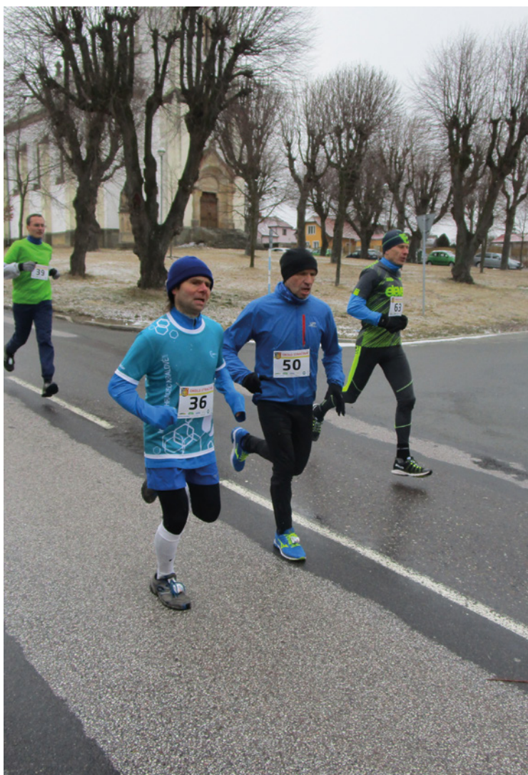
▪ Závodníci běželi i obcí Stračov.