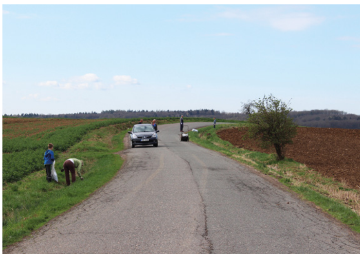
■ Úklid místní části Zavadilka.