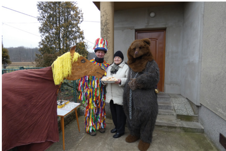
▪ Nerošovský masopust.