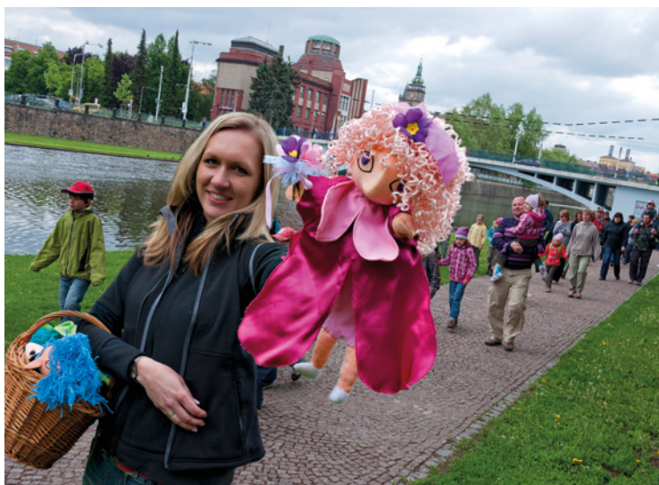
▪ Pohádkové putování