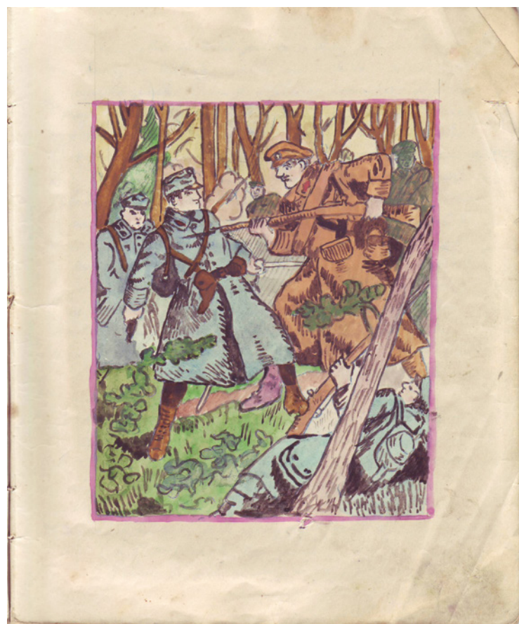
■ Malované obrázky z památníku