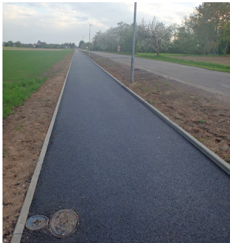
▪ Květen 2018 - finální podoba cyklostezky.