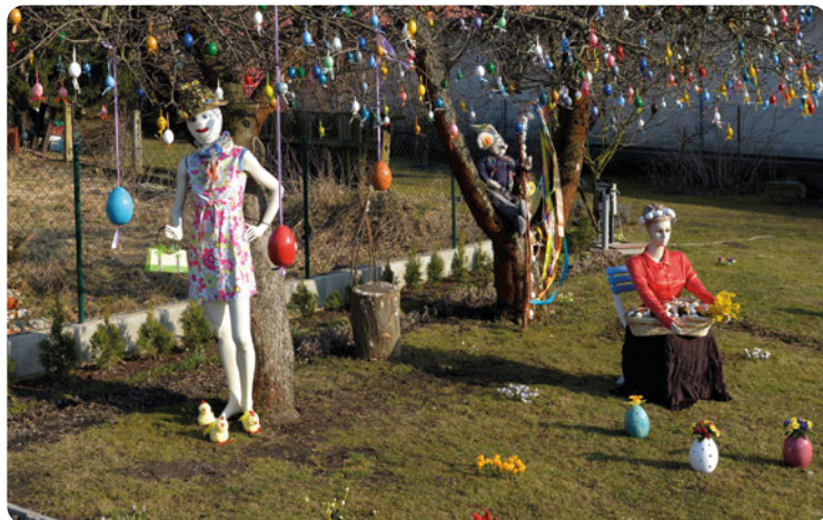
▪ Velikonoční výzdoba nechyběla ani v Nechanicích.