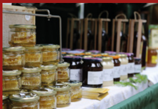
MEDOVÉ SLAVNOSTI ...