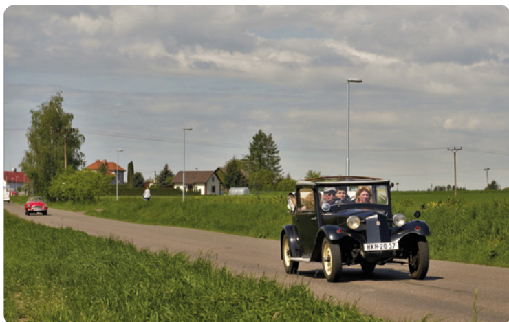
▪ 1. května projížděla regionem kolona veteránů.