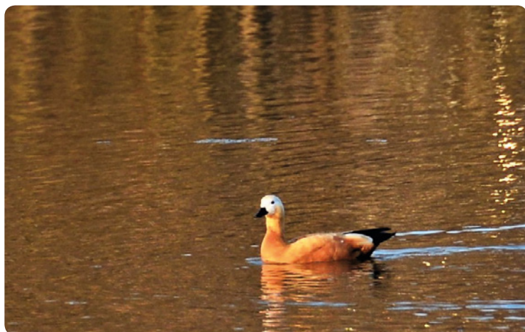
▪ Husice rezává na rybníku v Horních Dohalicích.