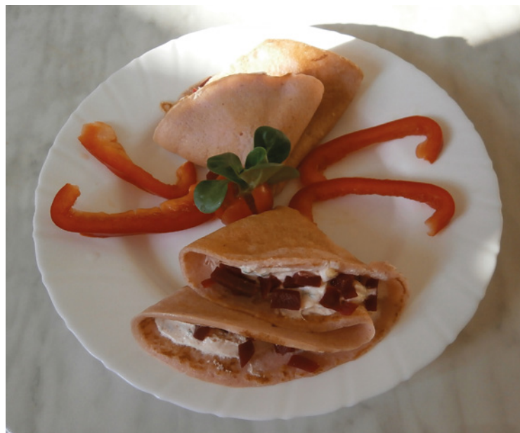
▪ Špaldové palačinky s červenou řepou a tvarohem.