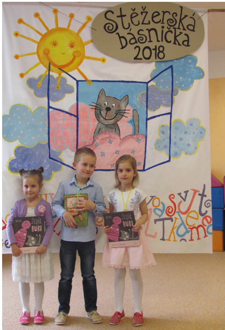
▪ Letošní vítězové Stěžerské básničky.