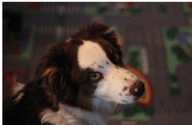
■ Hlavní hvězda rubriky Psí hlídka - Tobi.

Redakce: Děkujeme za odpovědi a přejeme všem Radostovským, ať se jim daří.