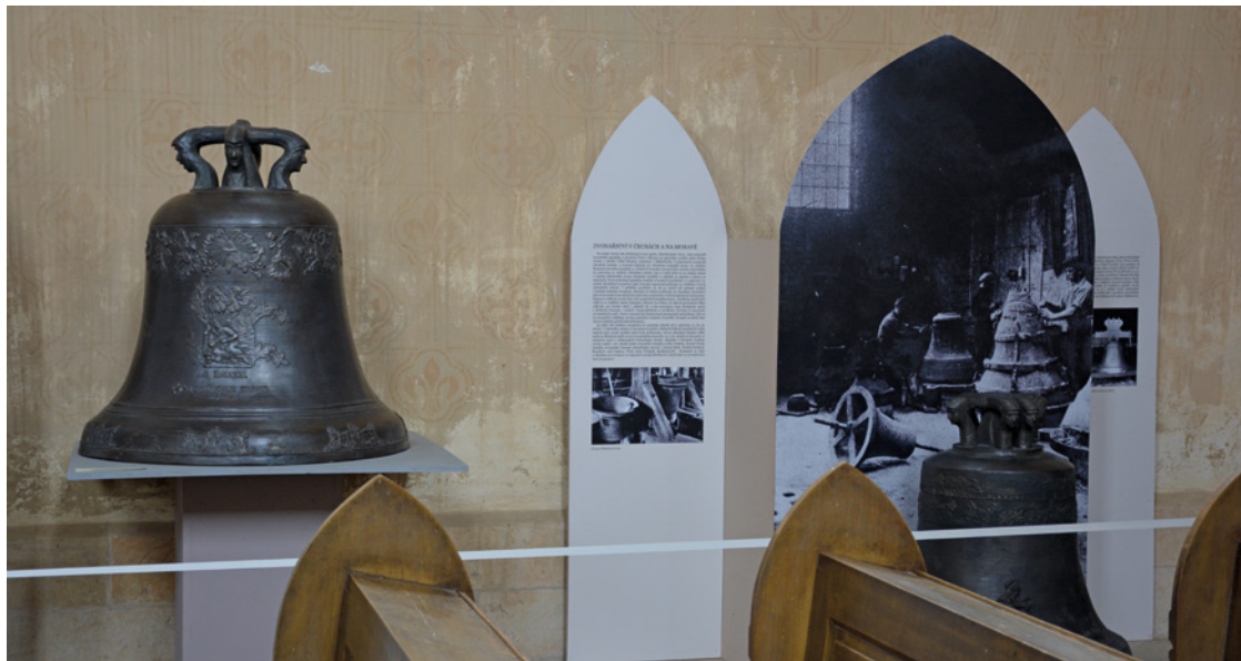
▪ Kampanologická sbírka v kostele v Suché zůstává i po udržitelnosti projektu.