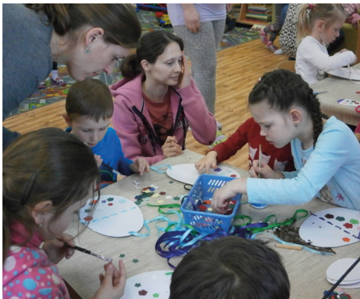
▪ Velikonoční dílna - březen 2018.