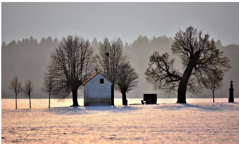
Vánoční pohled do jedné z členských obcí – do Mžan

V závěru roku se podařilo vydat i mikroregionální kalendář, který se ve většině obcí dostal do každé z domácností. Jednalo se o autorský kalendář – amatérského fotografa Ing. Jana Vratislava. V kalendáři najdete fotografie ze všech členských obcí i jejich místních částí.