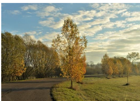
Jedna z fotografií v mikroregionálním kalendáři Cesta Sovětuš – Popovice