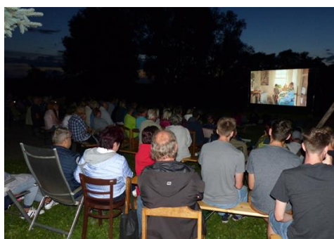
Letní kino - Bezva ženská na krku – Mokrovousy