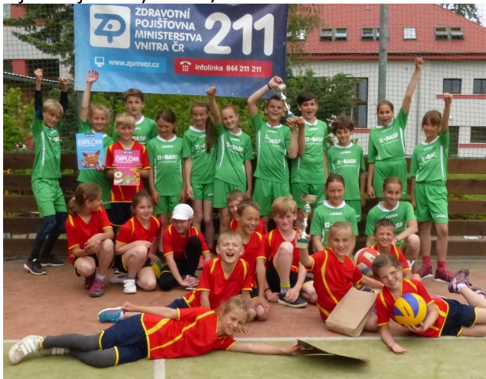
Vybíjená ZŠ – vítězná družstva v kategorii starších a mladších žáků

S básničkou do Stěžer, Uklidíme svět, uklidíme Česko, Mikroregionem Nechanicko na kole, Olympiáda pro děti z MŠ, Vybíjená pro děti ze ZŠ, produkce letních kin, Kalendář mikroregionu na rok 2018 – nejdůležitější aktivity roku 2017