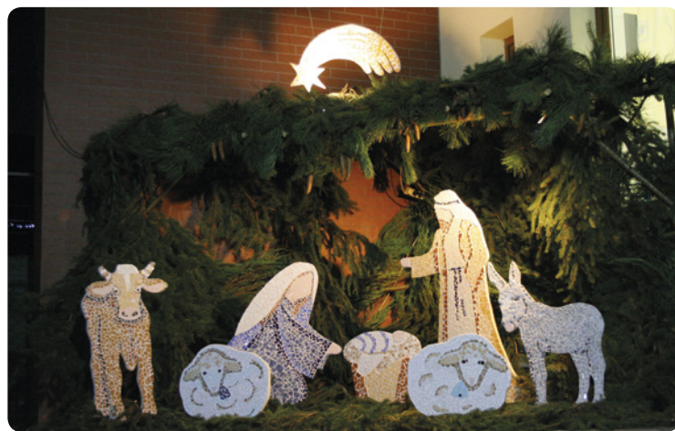
▪ Mozaikový betlém v Horních Černůtkách.