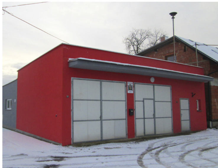
▪ Opravená hasičská zbrojnice v Boharyni. Foto: JUDr. Věra Macháčková