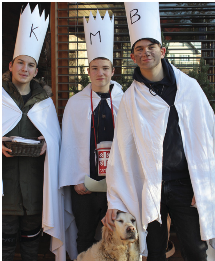
▪ Tříkrálová sbírka Mžany.