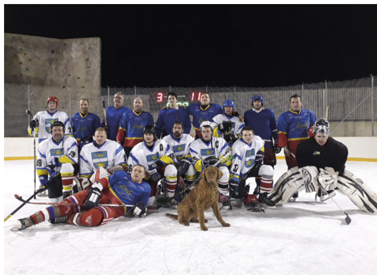
▪ Hokejové týmy Mokrovous a Sadové.