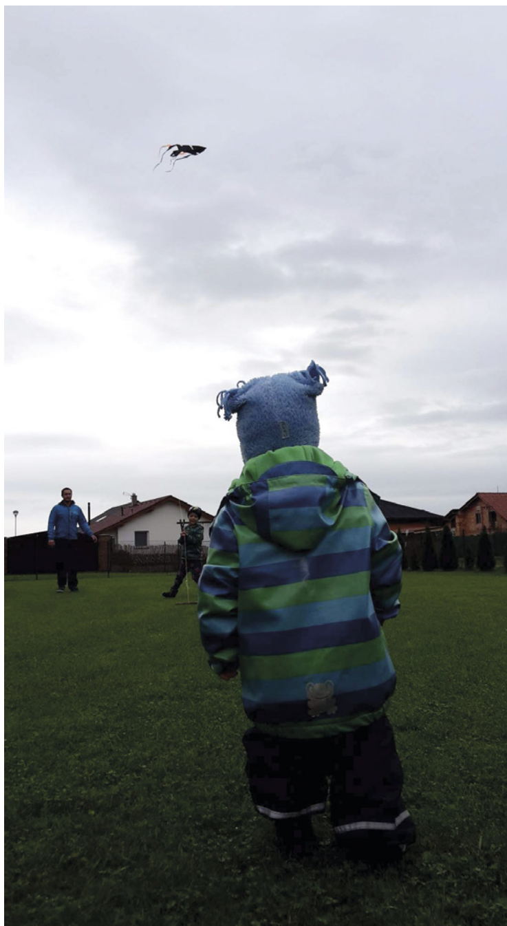
▪ Drakiáda zahrada CVČ Kunčice.