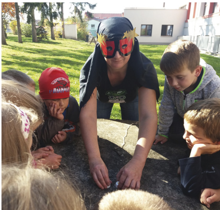
▪ Děti bojují s Pánem temnot o klíč.