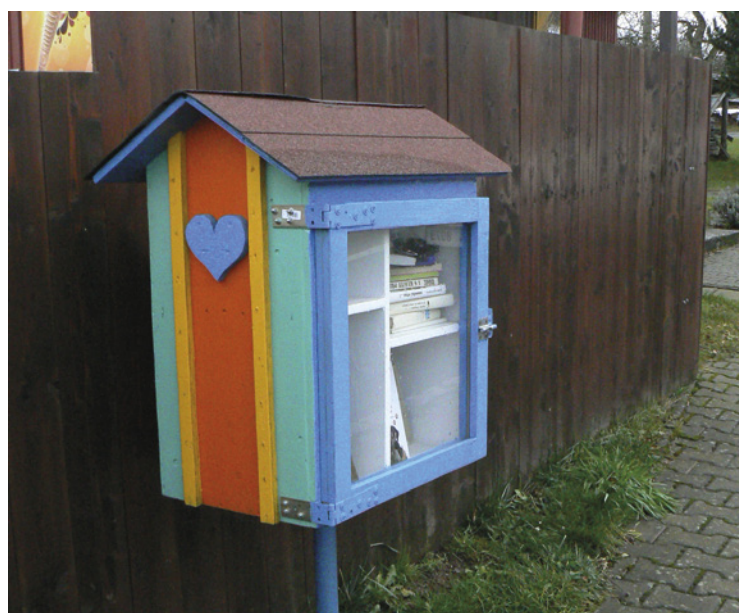
▪ Podobná "knihobudka" může být i ve vaší obci.