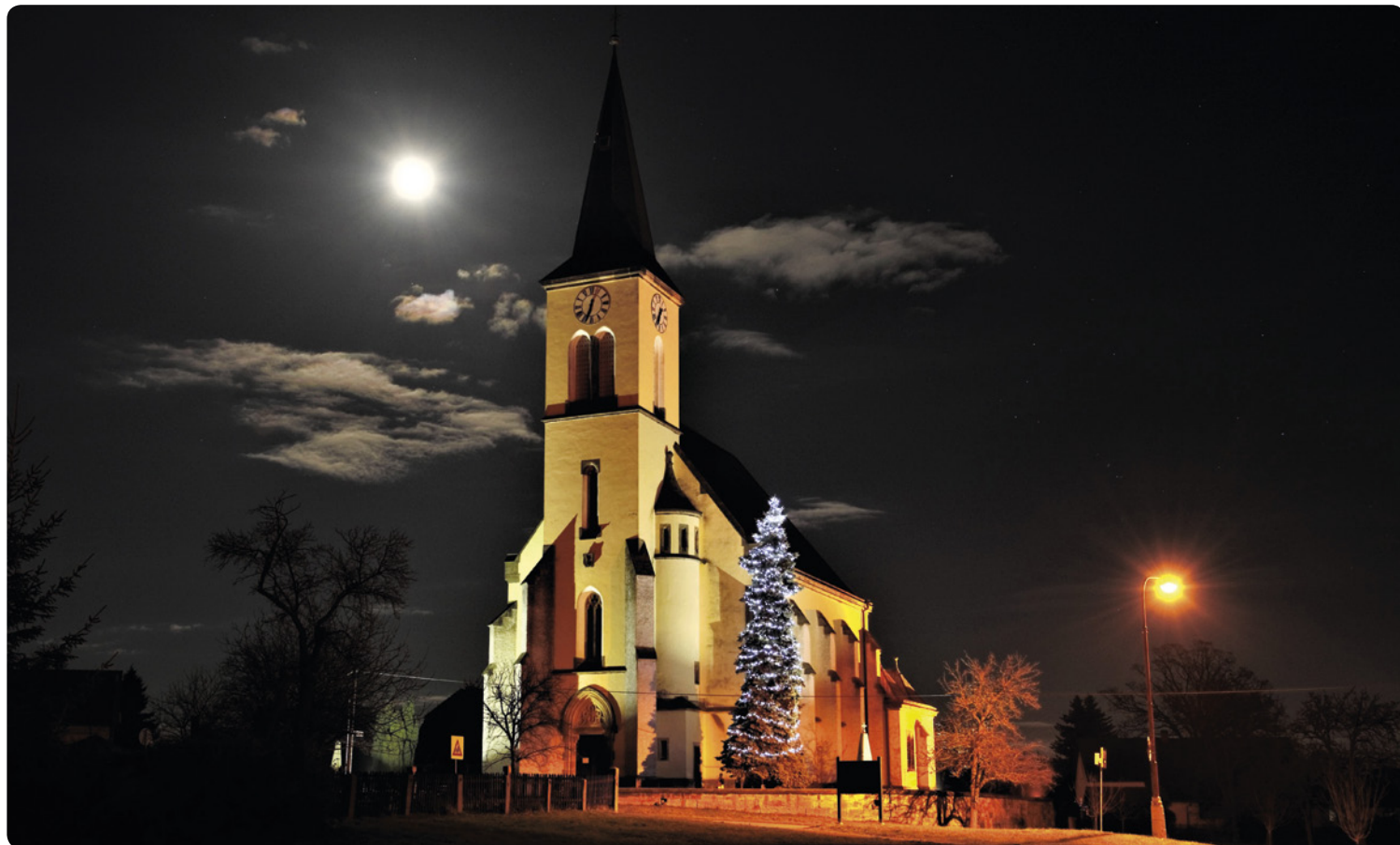
▪ Dohalický kostel o vánocích.