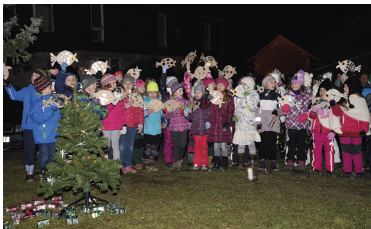
▪ Adventní vystoupení všech žáků školy.