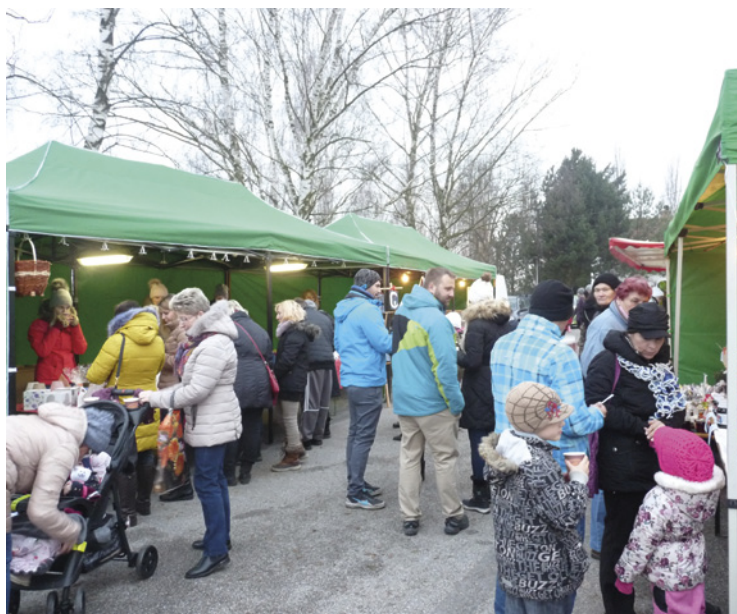
■ Adventní trh v Sadové.