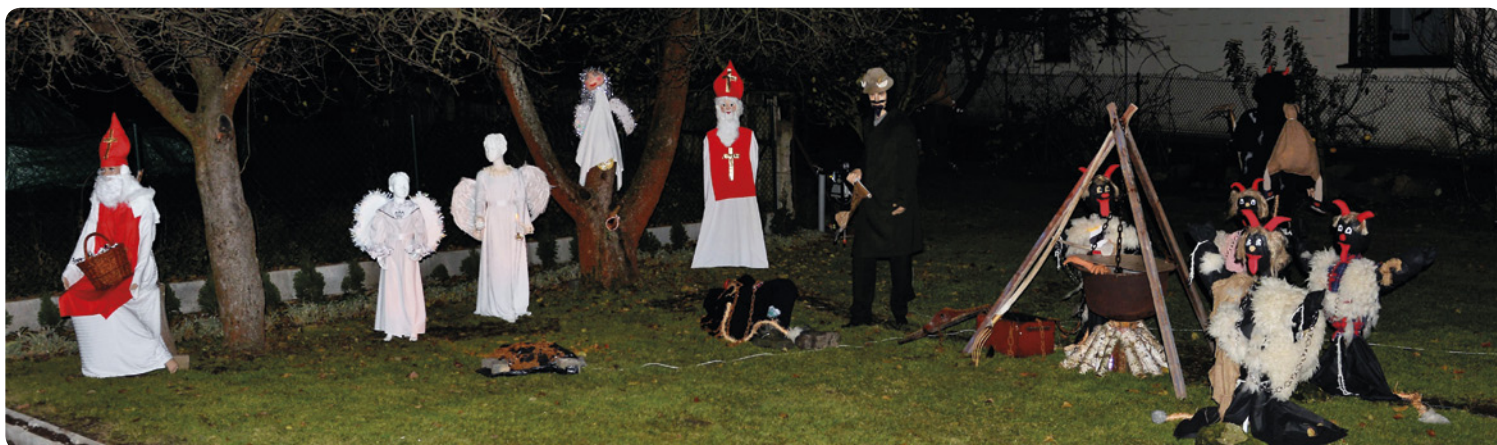
▪ Nechanice - čertovská nadílka.