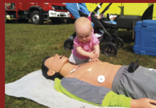
UNIKÁTNÍ SYSTÉM PÉČE...