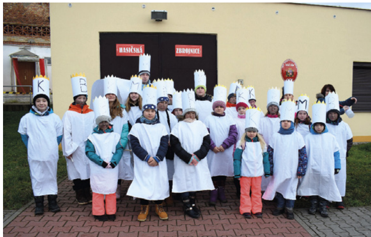
▪ Dolní Přím - Tříkrálová sbírka 2018.