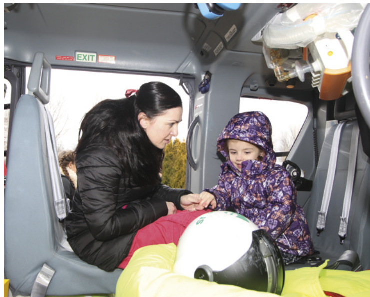
▪ Prohlídka kabiny vrtulníku přilákala děti i dospělé.