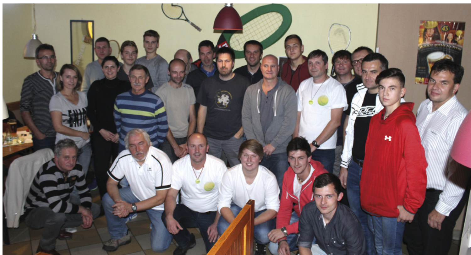
■ Vyhlášení tenisové ligy.