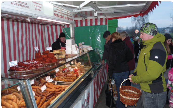
▪ Sadová - adventní trhy.