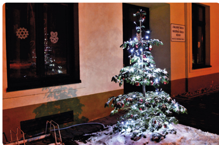
▪ Vánoční výzdoba před mžanskou školou.