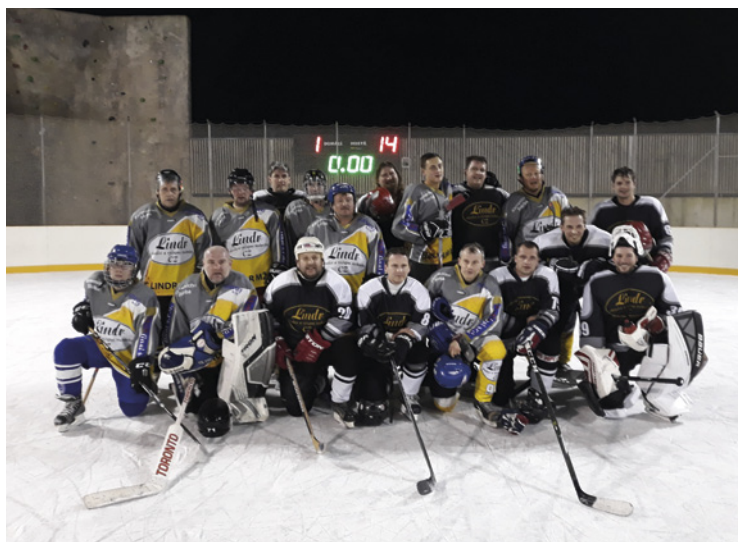
▪ Hokejové týmy Mžan a Dohalic.