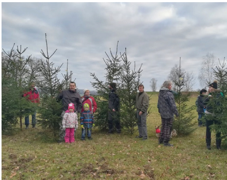
▪ Každý si našel svůj smrček.