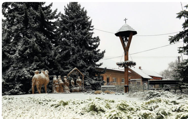
▪ Slaměný betlém v Mokrovousích.