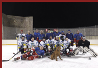
OBCNÍ HOKEJOVÁ LIGA...