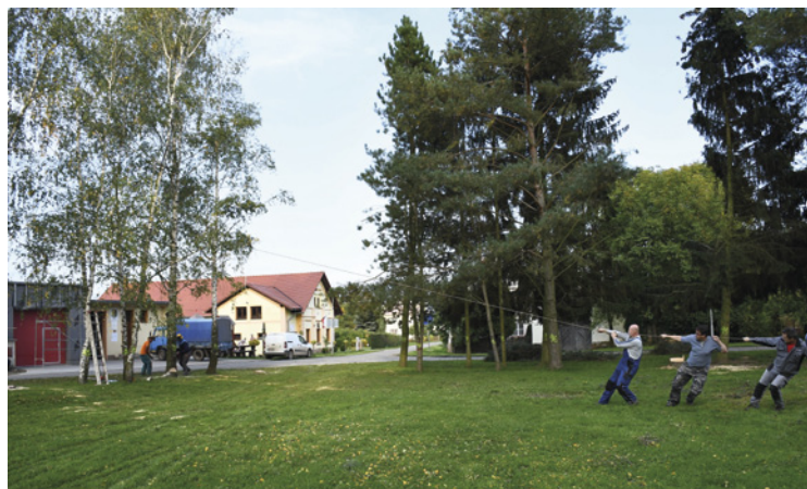
▪ Hřiště Sovětice - kácení.