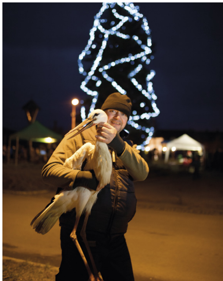
▪ Rozsvícení vánočního stromčeka na návěs v Mokrovousích s netradičním návštěvníkem.