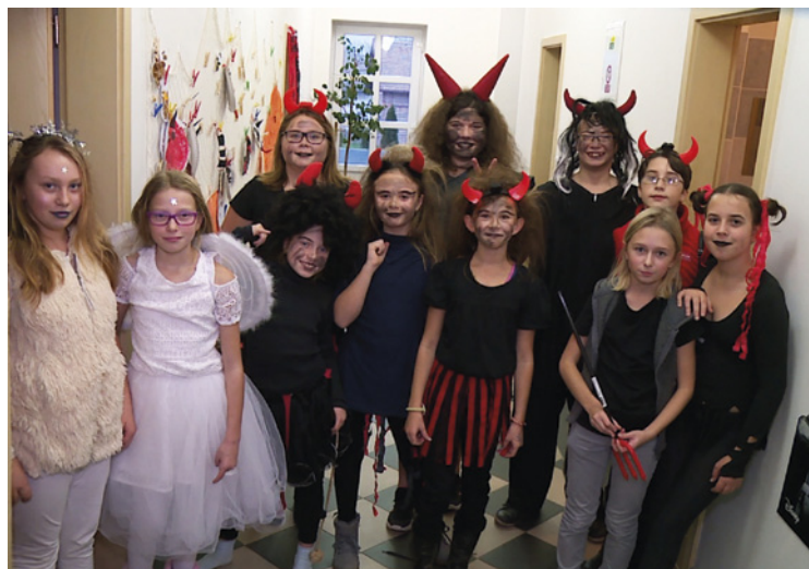
▪ Setkání s Mikulášem CVČ Kunčice.