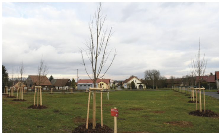
▪ Hřiště Sovětice - nová výsadba.