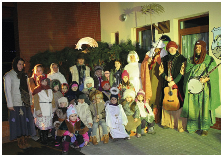
▪ Adventní a divadelní koledování.