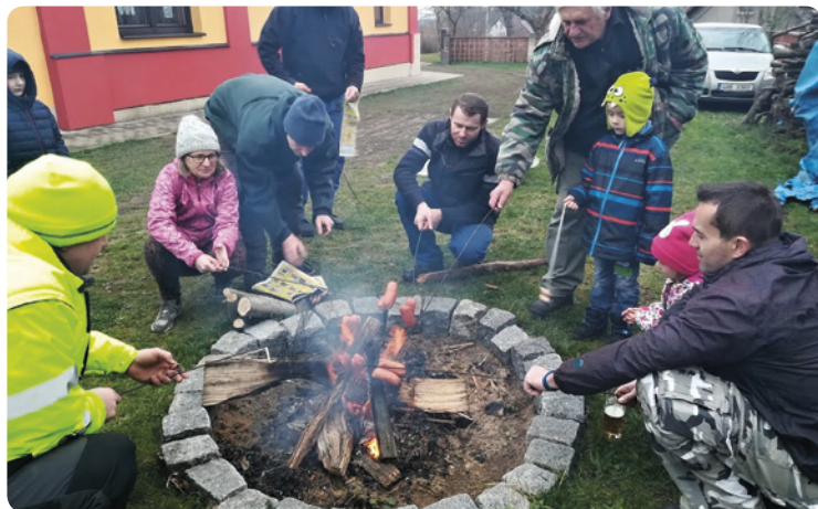
▪ Hrádek - předvánoční opékání buřtů.