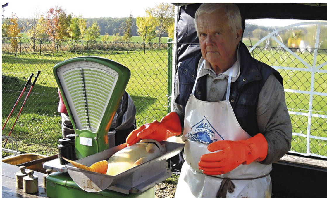
■ Ani při výlovu rybníka senioři nechyběli.