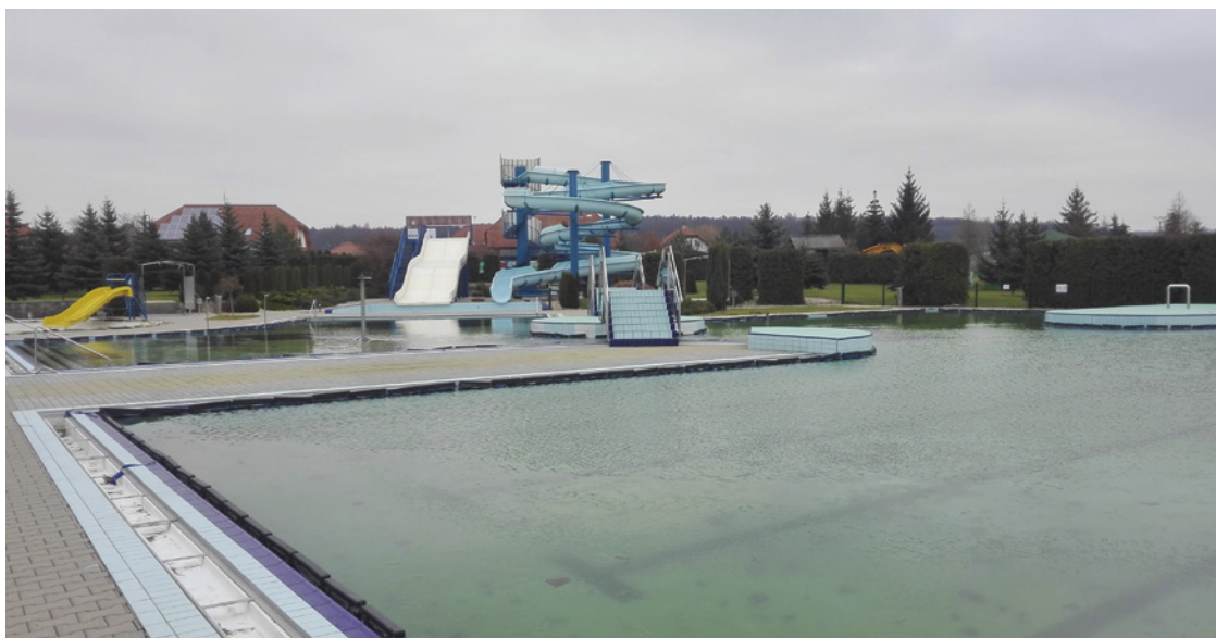
▪ Smutný pohled na zimní koupaliště bez návštěvníků.