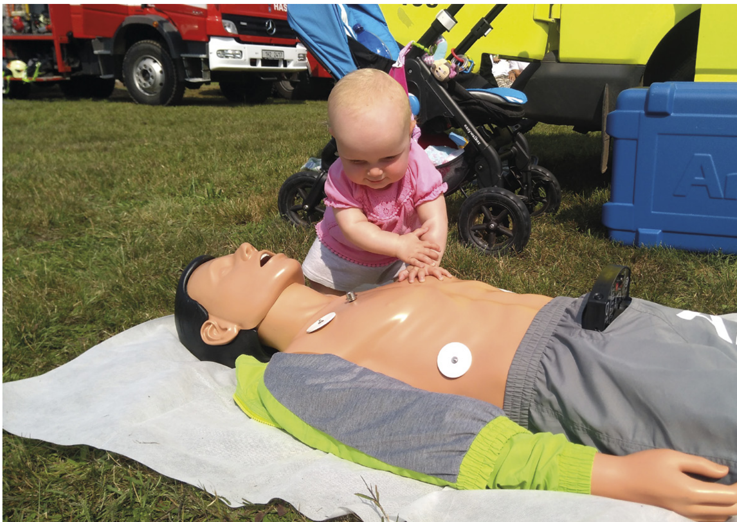
▪ Návčik první pomoci přilákal i ty nejmenší.