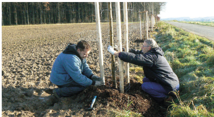
■ Výsadba stromořadí do Radostova se vydařila.