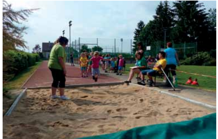
▲ Mezi jednu z disciplín Olympiády MŠ patří i skok daleký.

Poděkování patří sponzorům, a to Zdravotní pojišťovně Mi-