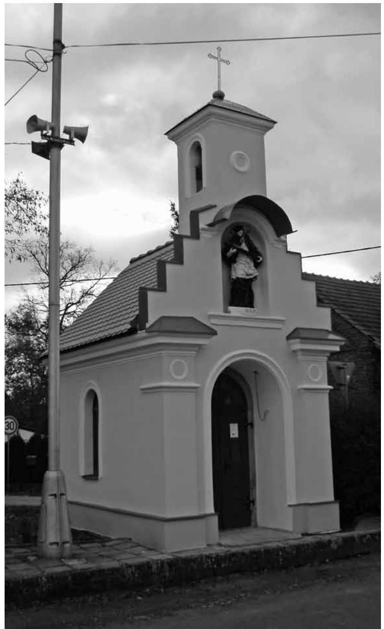
▲ Kaplička v Puchlovicích po rekonstrukci.