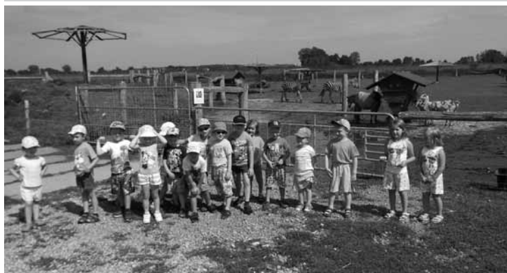
▲ Děti z mateřských školek jsou častými návštěvníky Zooparku.

Kč. Otevřeno máme denně od 10 do 17 hodin. Sledovat novinky a dění kolem našich zvířat můžete na facebooku www.facebook.com/Zoopark-Stezery