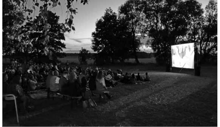
▲ Letní kino zavítalo 22. července i do Mokrovous.