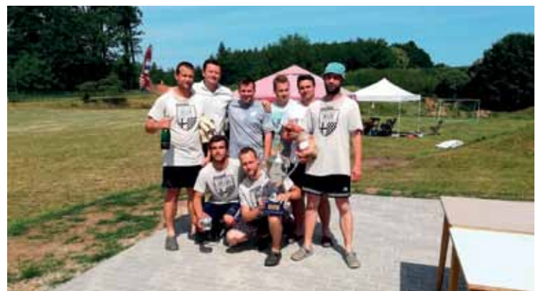
▲ Hrádek - vítězné družstvo fotbalového turnaje.