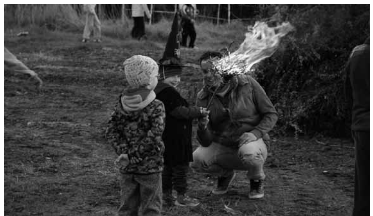
▲ Setkání malých i velkých čarodějů a čarodějnic na Kunčickém hřišti.