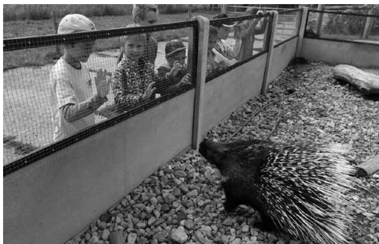
▲ Jednou z aktivit Zooparku je příměstský tábor.

V našem ZOOPARKU vybíráme příspěvek na provoz a krmení, a to za děti 40 Kč a za dospělého 60