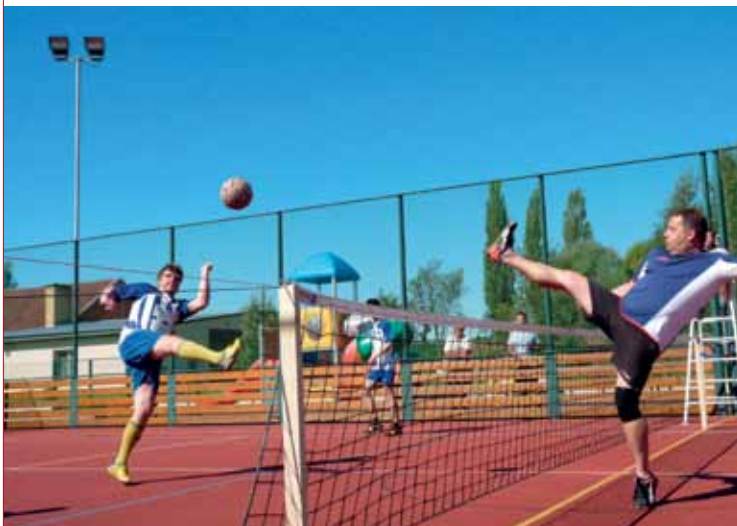
▲ Nohejbalový turnaj - družstva SK Snů Třebechovice a Náplavy.