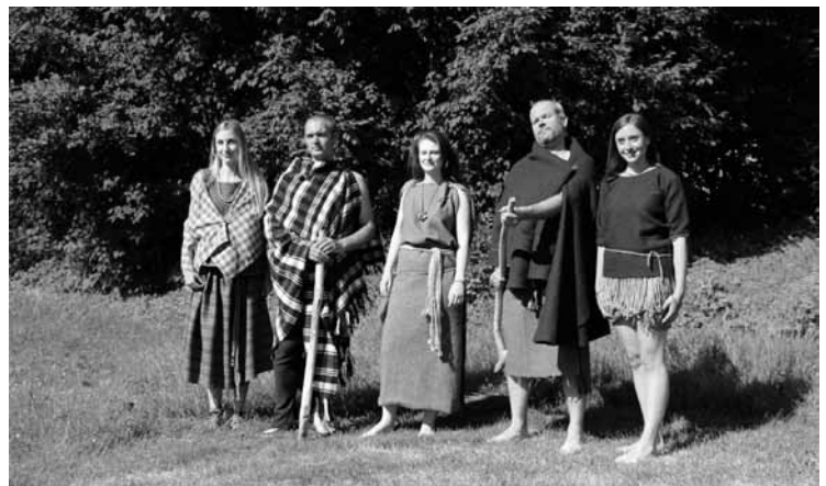
▲ Módní přehlídka se účastníci zhostili na jedničku i přesto, že to byla jejich první modelingová zkušenost.