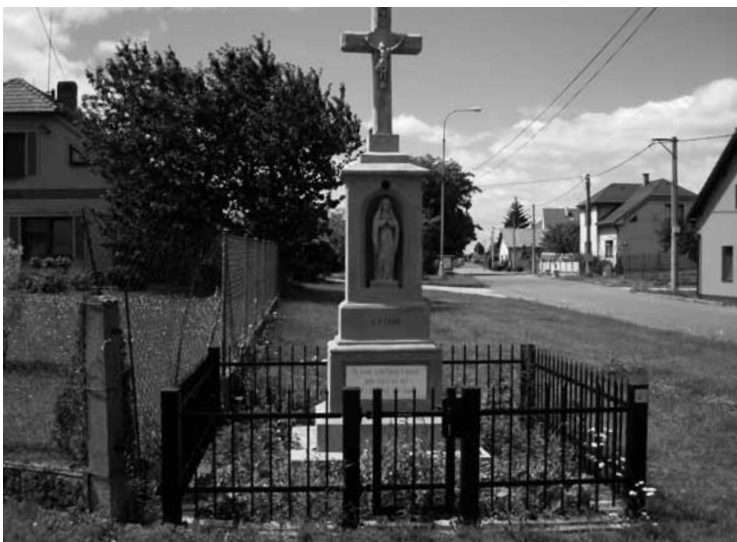
▲ Křížek Boží muka byl opraven včetně kovového oplocení.