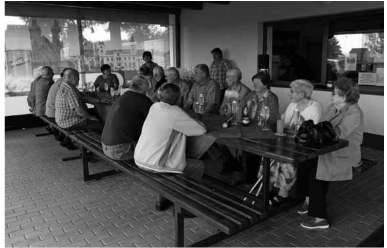
▲ Červnové setkání s jubilanty ve sportovním areálu v Boharyně.