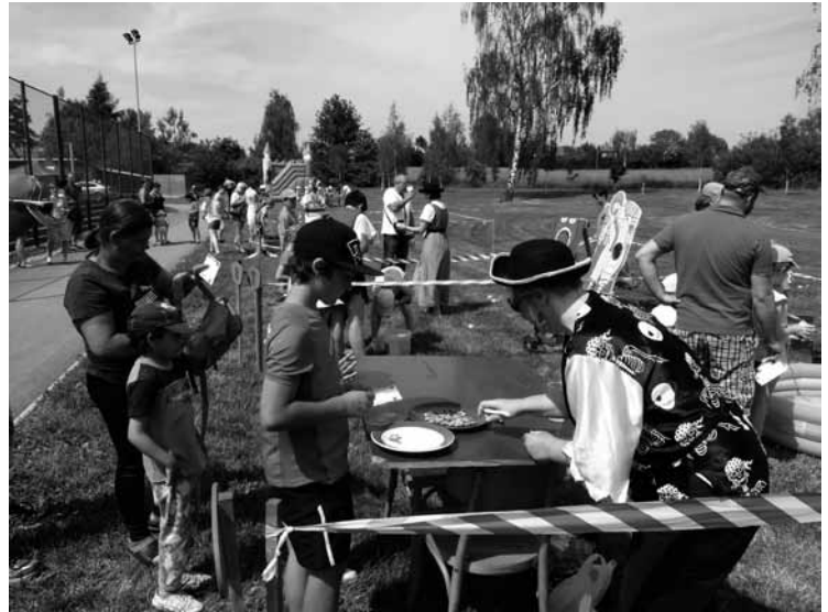
▲ Soutěže Dětského dne.