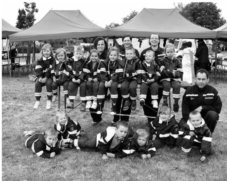
▲ Celostátní festival přípravek v Kunštátě.