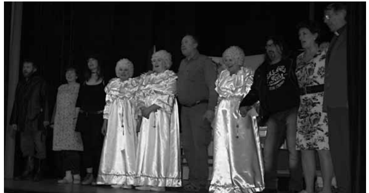
▲ Závěr premiéry hry Postel pro anděla.

Za NOS Ilona Matoušková a Zuzana Kramářová