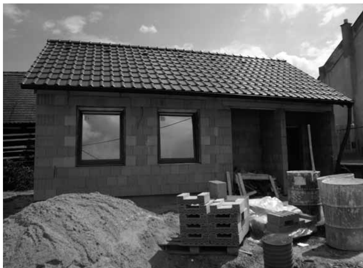
▲ Nový objekt volnočasových aktivit je téměř před dokončením.