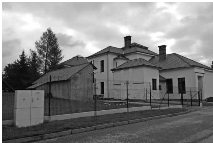
▲ Havarijní stav oplocení školního areálu je již naštěstí minulostí.

V současné době je dokončena první část z projektu Oprava budovy ZŠ a MŠ Mžany s celkovými předpokládanými náklady přesahujícími 1 milion Kč. První etapa zahrnovala kompletní výměnu venkovního oplocení areálu ZŠ a MŠ