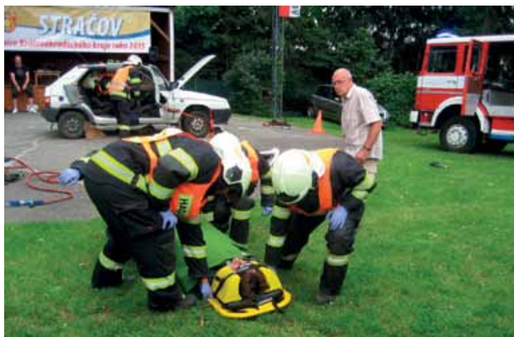
▲ Ukázkou vyproštění osoby z havarovaného auta za pomoci stříhacích nůžek v podání hasičů z Lochenic.

V roce 1906 několik nadšenců zažádalo o povolení ke zřízení sboru hasičů ve Stračově. Oficiálně byl spolek registrován v roce 1907. V počátku neměli mnoho finančních prostředků, a proto o ně žádali přímo hraběte Harracha, stračovského statkáře Aloise Bureše nebo i obec Stračov, která jim v té době nejvíce přispěla. V roce 1907 měl sbor 32 členů, ale již v roce 1911 jich měl rovnou stovku. Kromě hašení požárů se členové věnovali i hlídkové činnosti po likvidaci požárů, za což dostávali také odměnu. V lednu 1908 obecní