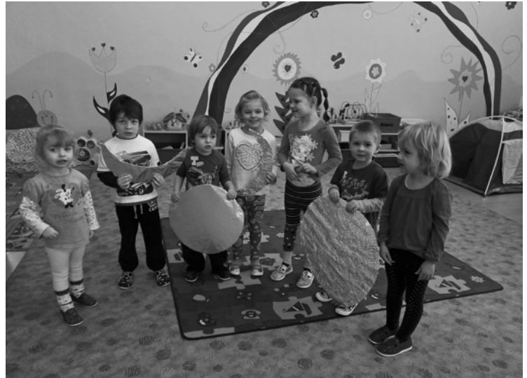
▲ Děti z Duhové třídy si na chvilku zahrály na kosmonauty.