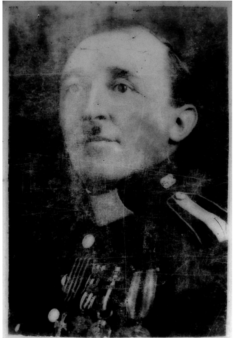
▲ Podobenka Fr. Nepilého na probluzském hřbitově.