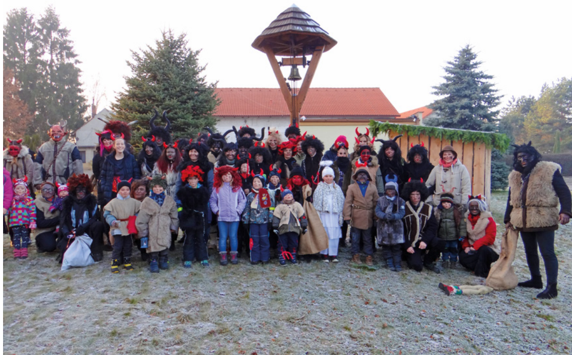
▲ Pekelný plán čertovského průvodu mezi Sadovou a Soveticemi vyšel na jedničku.