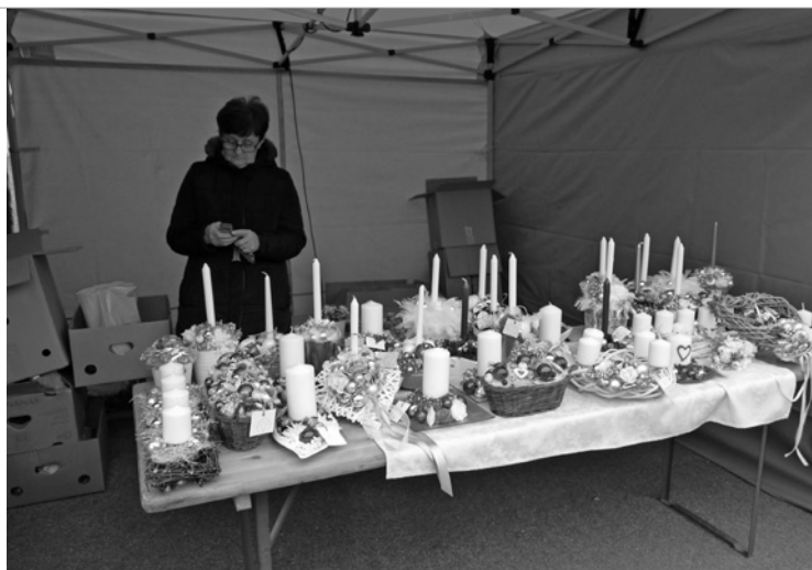
▲ Prodej vánočních dekorací v Sadové.