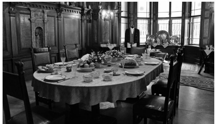
▲ Velikonočně vyzdobená expozice na zámku.