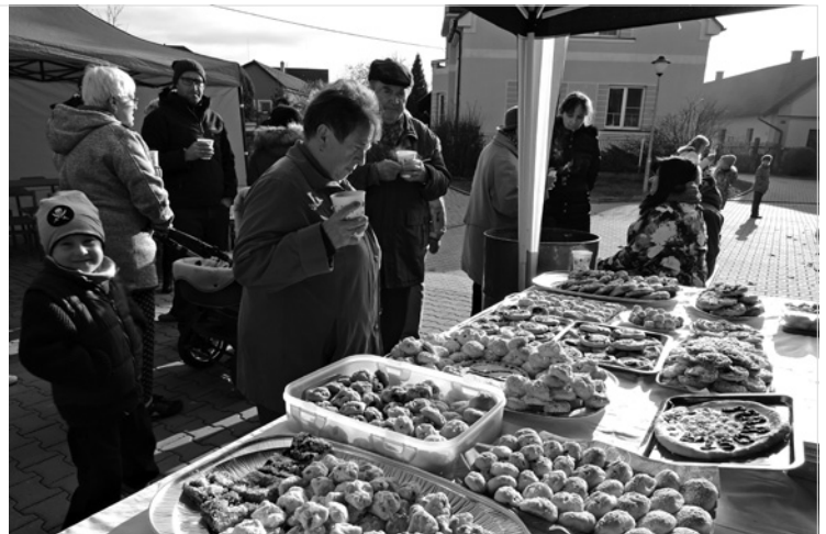
▲ Domácí posvícenské koláčky napekly místní hospodyňky.