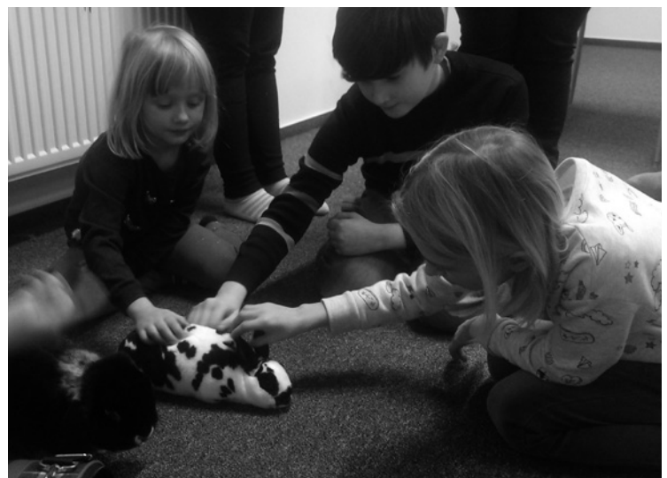
▲ Na našem setkání nechyběli ani králíci.