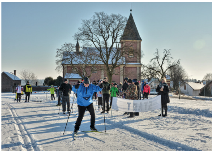
▲ Připravená trasa běžkařských závodů začínala u kostela.