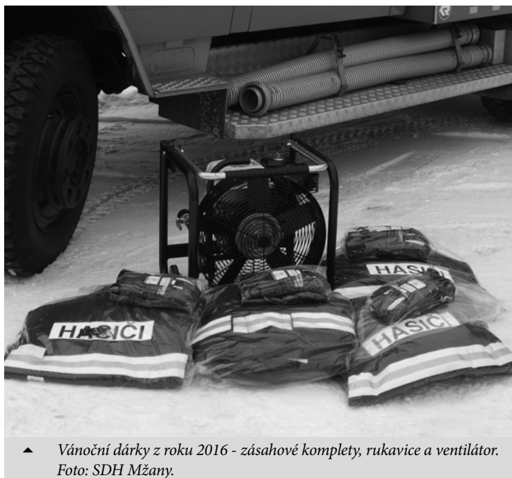
▲ Vánoční dárky z roku 2016 - zásahové komplety, rukavice a ventilátor.