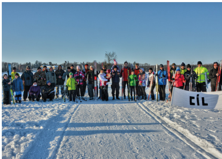
▲ Celkem 21 účastníků bylo rozděleno do tří kategorií - muži, ženy a děti.