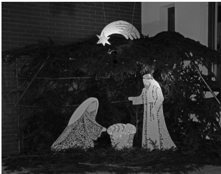
▲ Obraz Svaté rodiny poskládali místní z mozaiky.