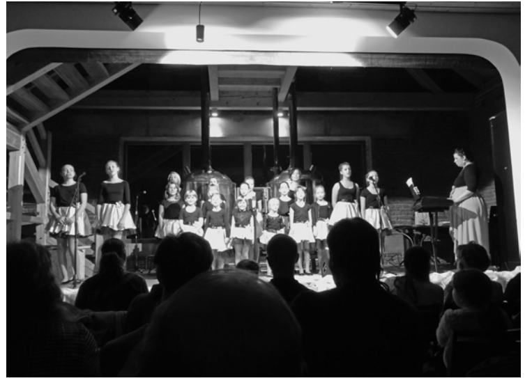
▲ Dětský pěvecký sbor Kaštánek na svém vánočním vystoupení.