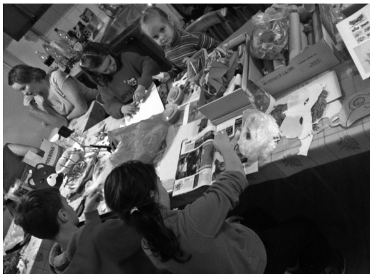
▲ Na lednových dílničkách se děti připravovaly na karneval.