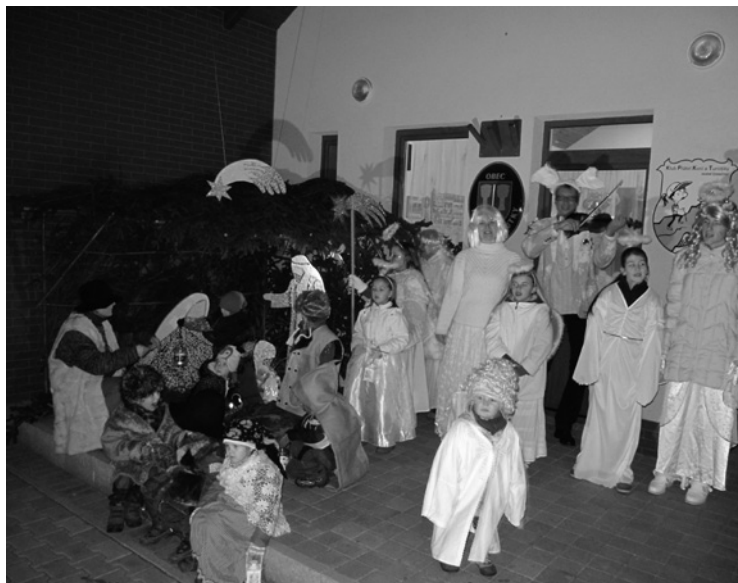
▲ Představení Pojďte s námi do Betléma v podání místních i přespolních.