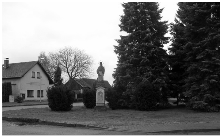
▲ Návěs v obci Pšánky se sochou sv. Jana Nepomuckého.

Jedna taková fotografie se našla v Pšánkách: