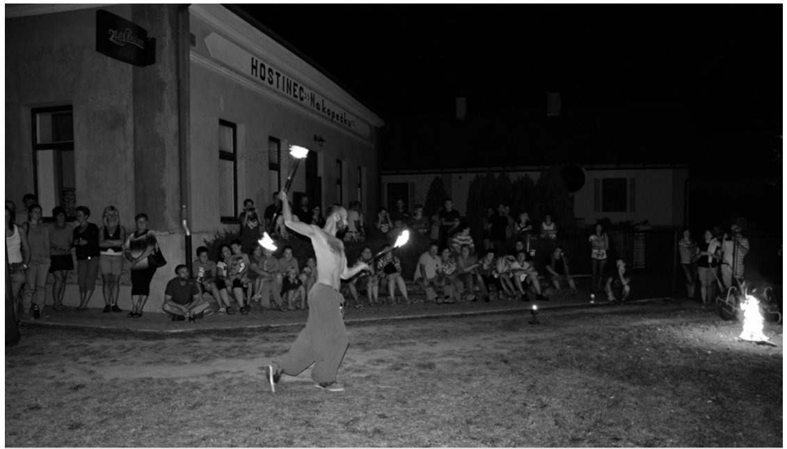
▲ Součástí oslav na Hrádku byla i ohnivá show.