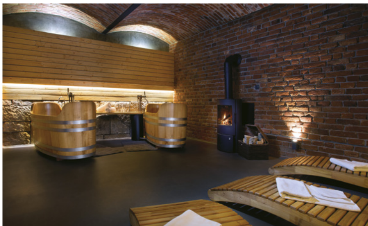
▲ Pivovar LINDR Mžany – Wellness.