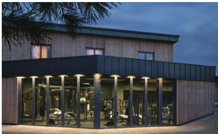
▲ Pivovar LINDR Mžany – Posilovna.