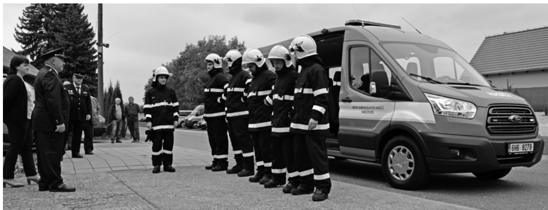
▲ Slavnostní předání nového hasičského automobilu.