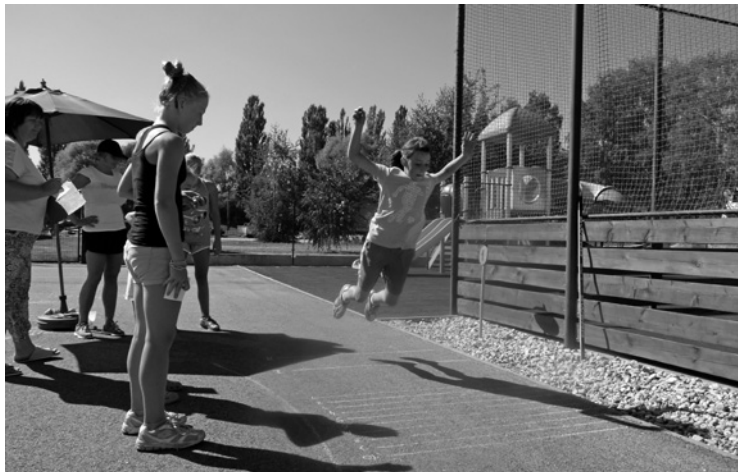
▲ Jedna z disciplín sportovního dne – skok do dálky.