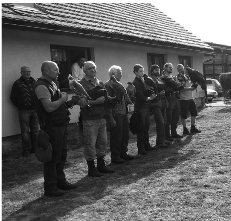
▲ Přehlídka dravců byla nedílnou součástí setkání sokolníků.