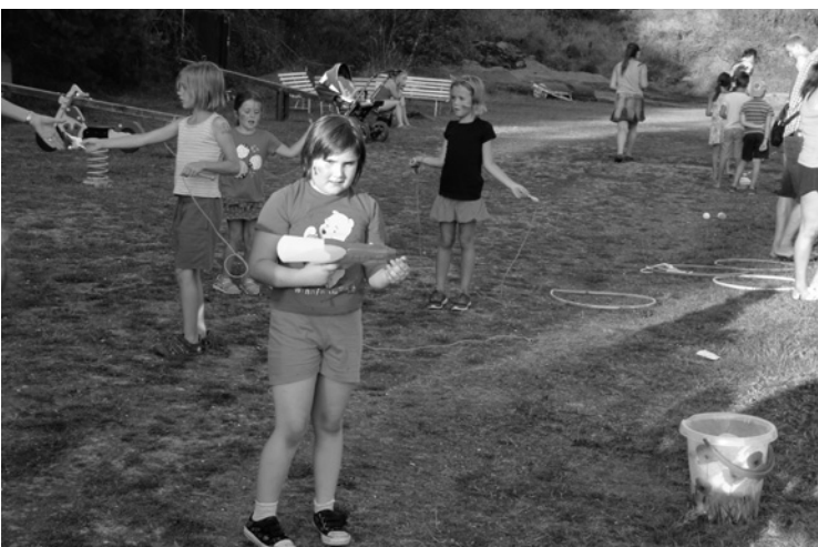
▲ Na letošním rozloučení s prázdninami děti plnily olympijské úkoly.