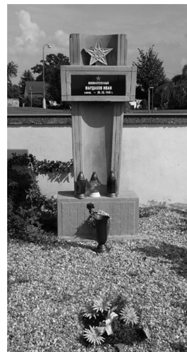
▲ Hrob I. Mardakova.

[8] Kol. autorů. Když nad Hradcem vlál nacistický prapor. Sborník o životě v Hradci Králové v letech 1938 - 1945. Hradec Králové 2010, s. 109-116.