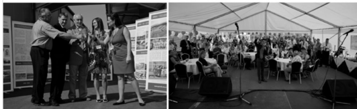
Slavnostní zahájení provozu a setkání obchodních partnerů

Dne 9. září 2016 uspořádala firma Perník s.r.o. v Těchlovicích u Hradce Králové slavnostní otevření nové haly pro bezlepkovou výrobu. Pozvání přijalo na 100 dodavatelů a odběratelů firmy. V rámci této akce se měli možnost prohlédnout si provoz pekárny a ochutnat produkty společnosti.