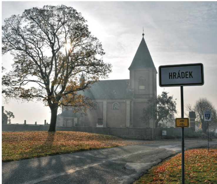
▲ Cyklotrasa č. 4200 vedoucí na Hrádek.