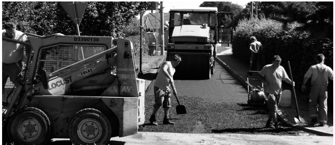
▲ Dokončení opravy komunikace v lokalitě „U Kučerů“.