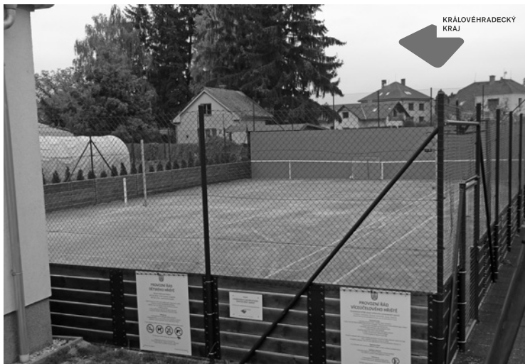
▲ Víceúčelové hřiště je vybaveno i protihlukovou stěnou.