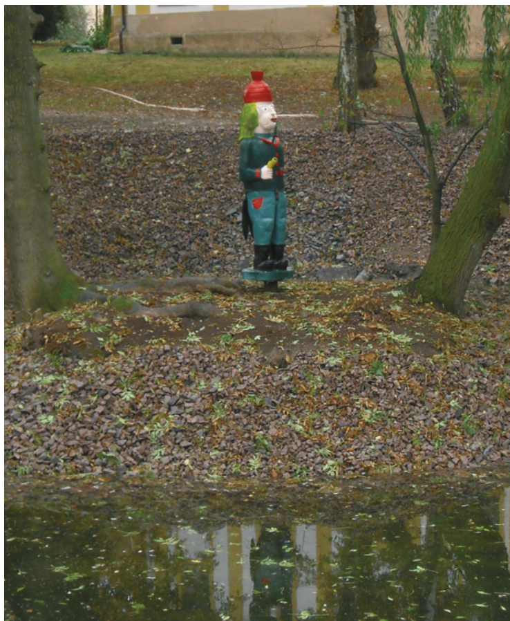
▲ V jednom z předchozích vydání našeho zpravodaje jsme Vás informovali o záměru opravy a vyčištění rybníka na Dolním Přímě. V tuto chvíli je akce ukončena, rybník je opraven, vyčištěn a avizovaný vodník již stráží svůj rajón.