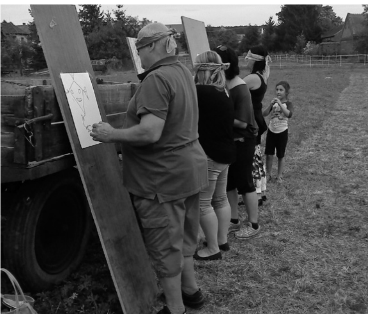
▲ Do soutěže - malování naslepo - se nakonec zapojili i dospělí.