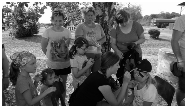
▲ Malování na obličeji se v Boharyni těší velké oblibě.