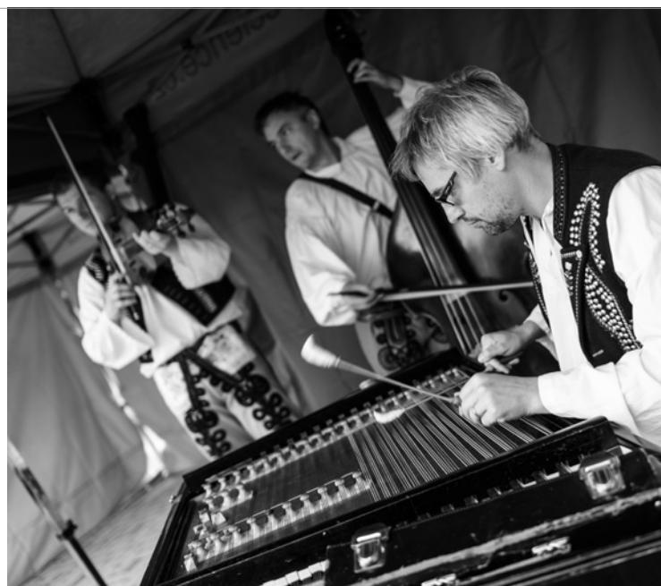
▲ Cimbalovka z Luhačovického Zálesí na vinobraní v Radostově.