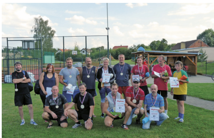
▲ Soutěžící v nohejbale dvojic.