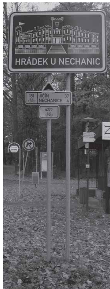
Nově vyznačené cyklotrasy vedoucí přes zámek Hrádek.

Ivan Šenk, Správa státního zámku Hrádek u Nechanic