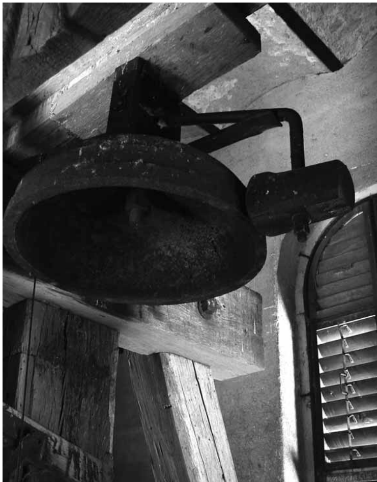
Dochovaná část starých mechanických věžních hodin z roku 1891. Tento zvonek s kladivkem odbíjel celé hodiny. Části odbývající čtvrté ani další součásti již neexistují.

Použité prameny: OÚ Stračov - Pamětní kniha Stračova 1923, SOKA Hradec Králové - fond Archiv fary Stračov (1788-1945), č. 140