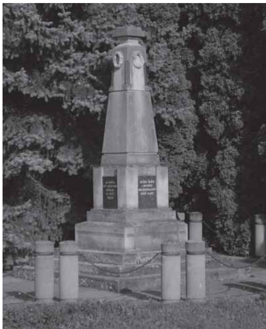
Pomník padlým z 1. světové války.