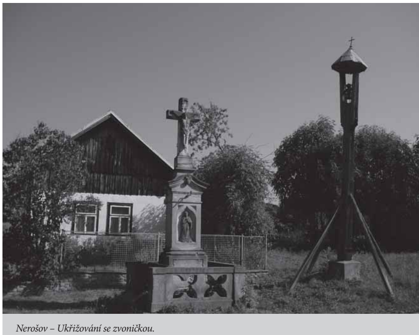
Nerošov – Ukřižování se zvoničkou.

Metodické pokyny k běžné údržbě kamenných plastik vyjdou v některém z příštích čísel.