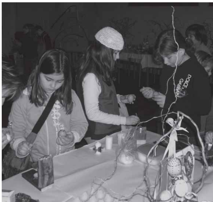
Velikonoční dílna v roce 2006.