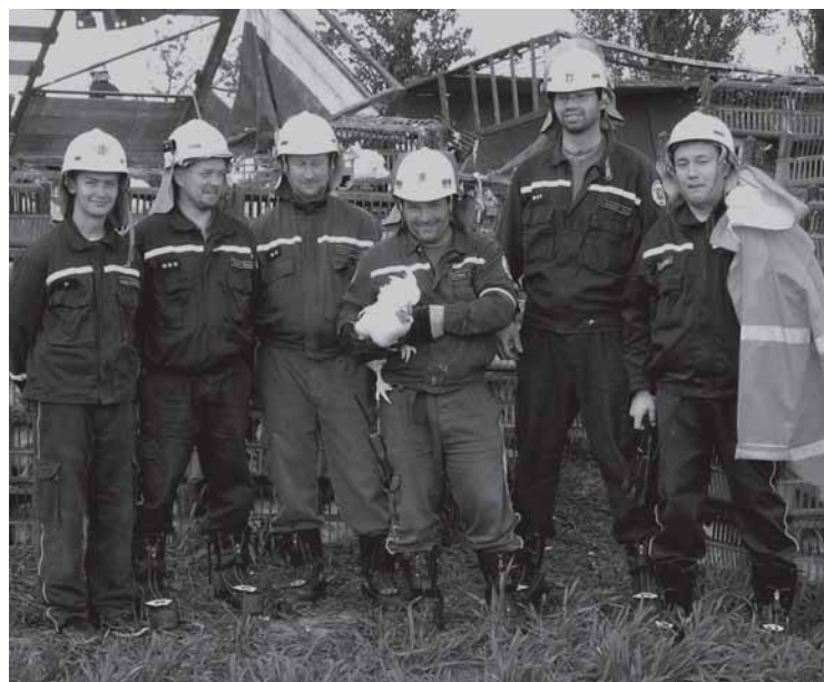
Mžanští hasiči při odstraňování nehody kamionu převážejícího drůbež.