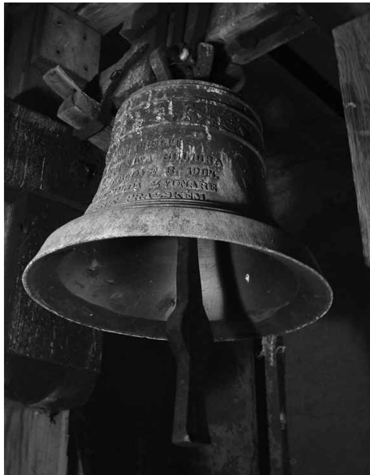
Současný stračovský zvon vyzváněl poprvé již 2. dubna 1904 v prozatímní kapli na farské zahradě.