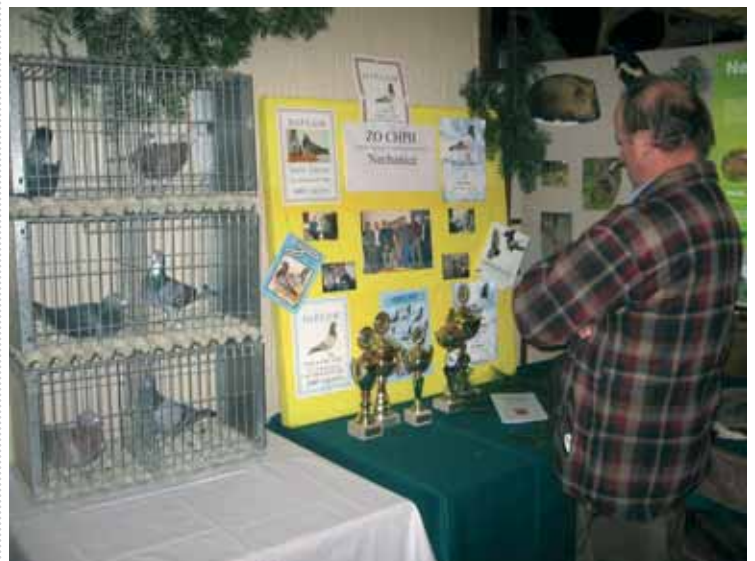
Prezentace na 1. společenském setkání spolků, klubů a občanských sdružení mikroregionu Nechanicko.