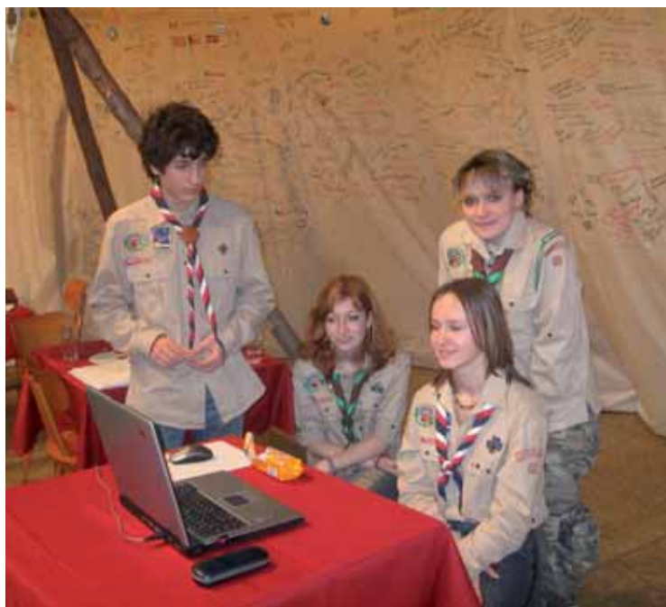
Oddíl skautů „Lišáci“, ze Stěžer na listopadovém setkání spolků Nechanicka.

Zbývající část odpoledne a oba další víkendové dny poté patřily veřejnosti. Zajímavé bylo sobotní odpoledne, kdy členové některých zúčastněných spolků předvedli praktické ukázkou ze své odborné a zájmové činnosti. Mohli jsme shlédnout agility neboli „psí parkur“, ukázkou z jezdeckého sportu i aktivity chovatelů holubů. ... pokračování na str.2