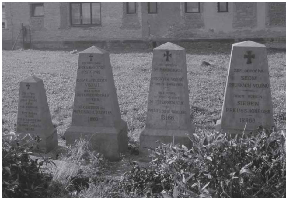
Náhrobky z války, 1866.