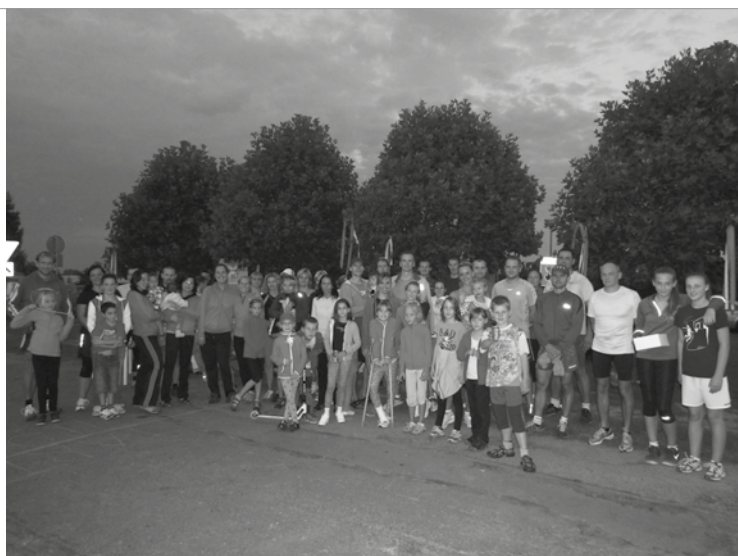
▲ Účastníci běhu pro slané děti.

Veselé vánoce a šťastný nový rok Vám přeje správná rada mikroregionu Nechanicko