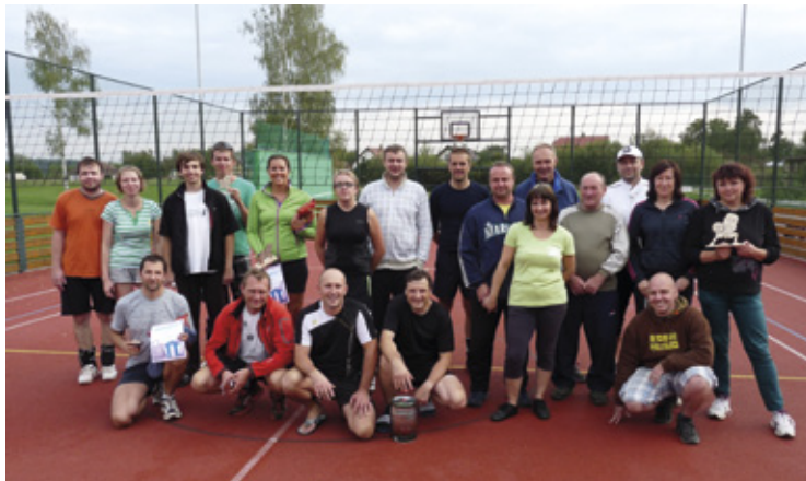
▲ Společné foto zúčastněných týmů volejbalového turnaje.