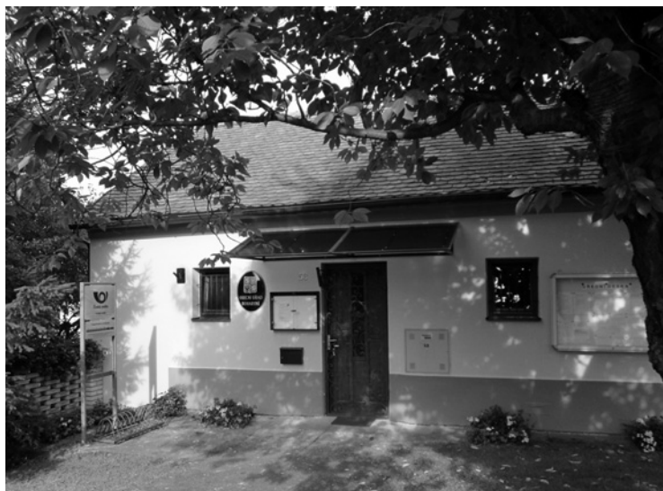
▲ Nová fasáda obecního úřadu.