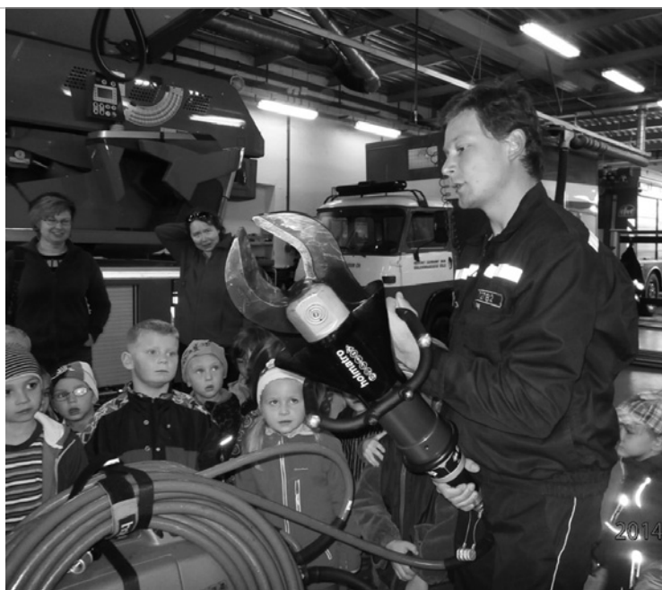
▲ Návštěva hasičské stanice v HK.