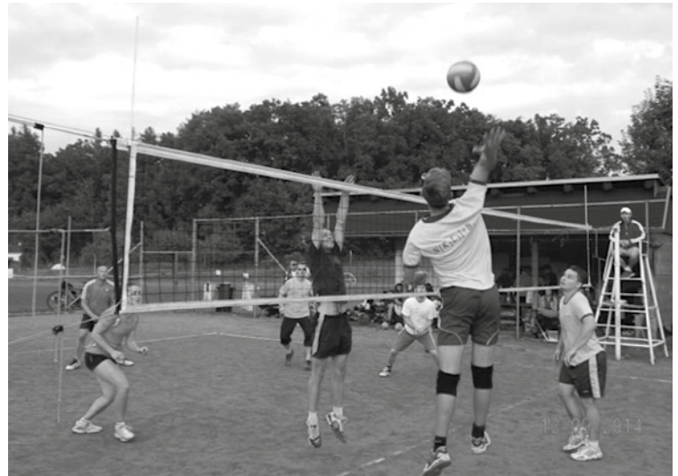
▲ Volejbalové klání v Těchlovicích.

Za pořadatele turnaje a oddíl volejbalu Honza Zíkl