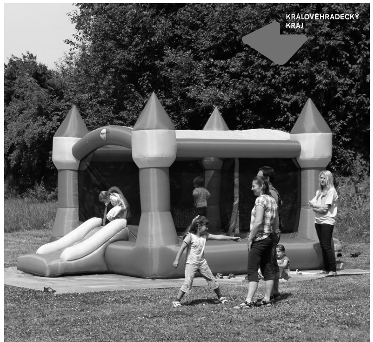
▲ Skákací hrad využili i v Mokrovousích.