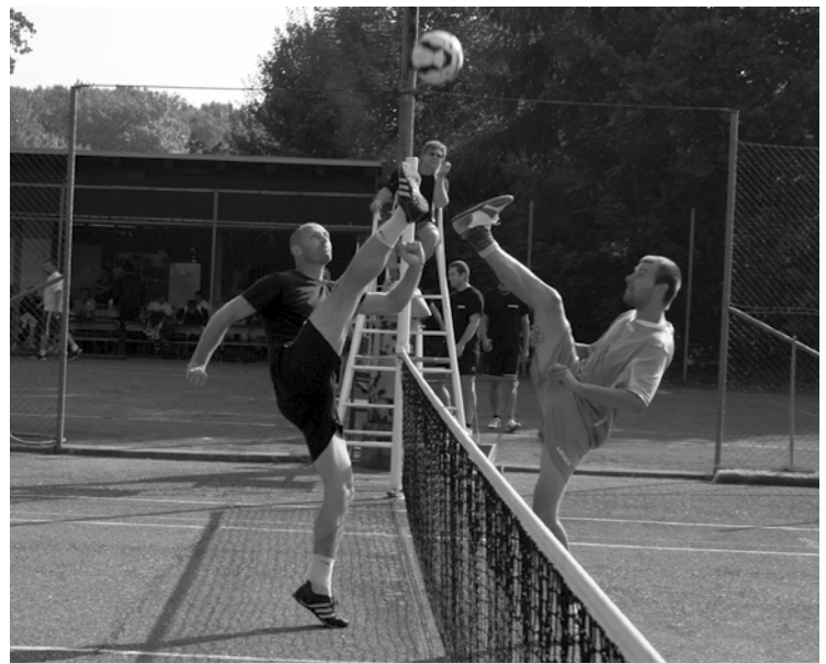
▲ Vypjatý souboj nad sítí.