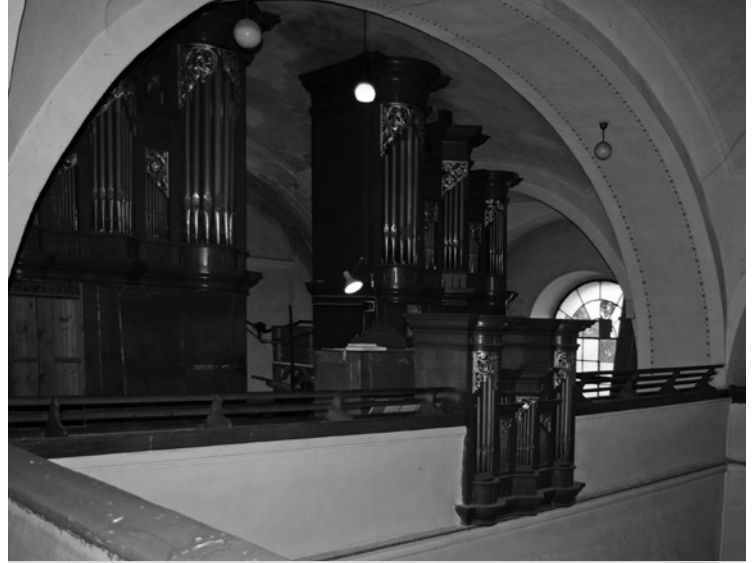
▲ Varhany v nechanickém kostele.