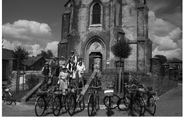
▲ Veteran Velociped Club Žížeň a Hlad v Suché.