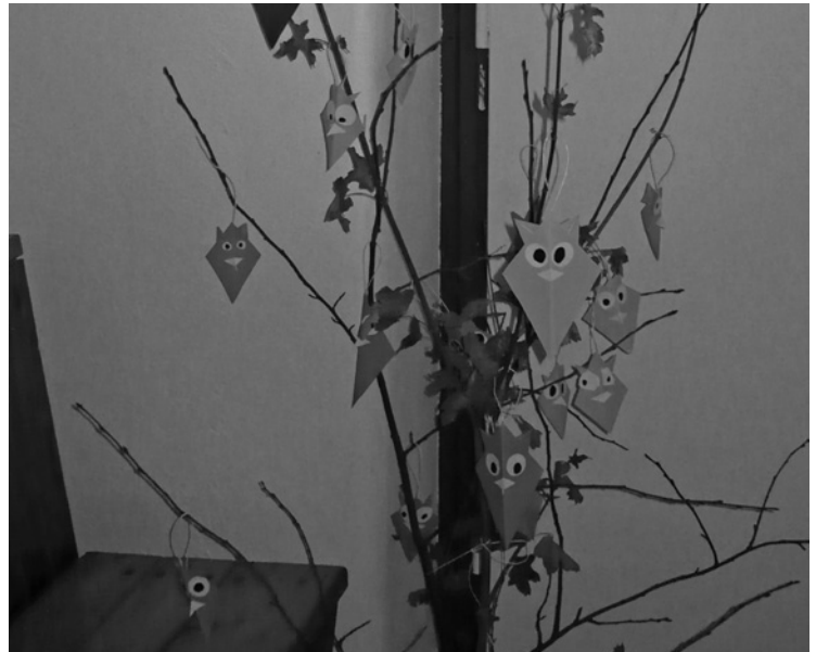
▲ Dekorace knihovny od dětí ze školní družiny.