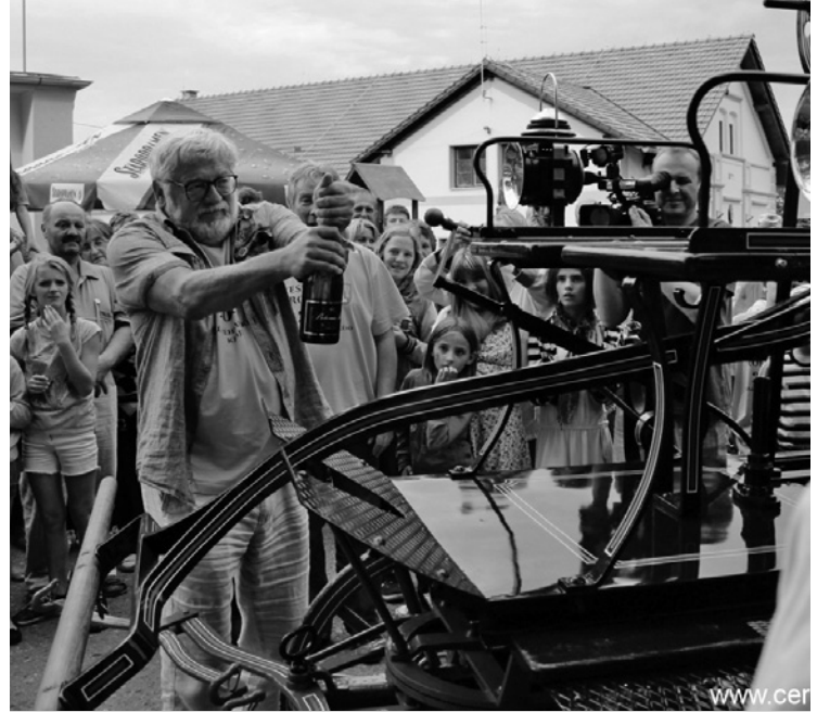
▲ Křest koňské stříkačky.