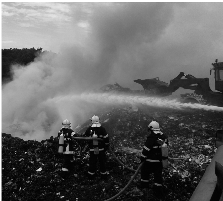
▲ Požár na skládce v Lodíně.