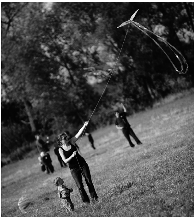
▲ Tradiční popovické pouštění draků.