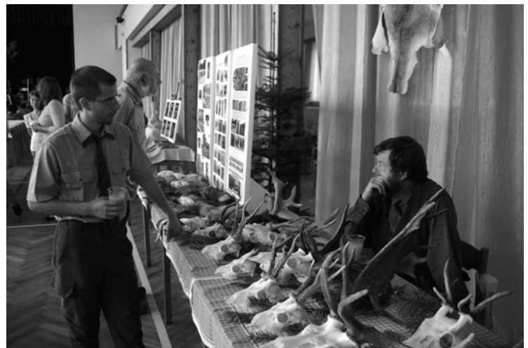
▲ Výstava trofejí v kulturním domě.