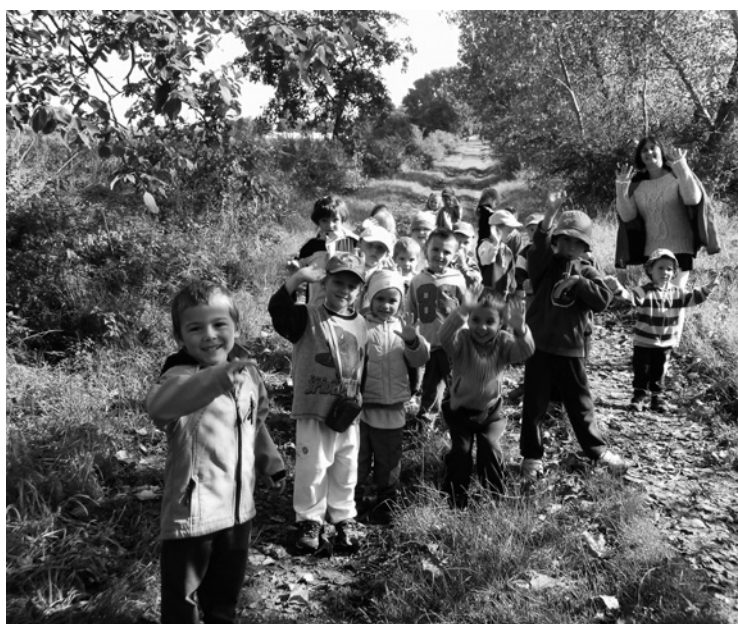
▲ Pozdrav ze Stračova.