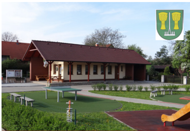
▲ Náves Horní Černůtky.