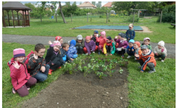
▲ Sázání jahod – těšíme se na úrodu.