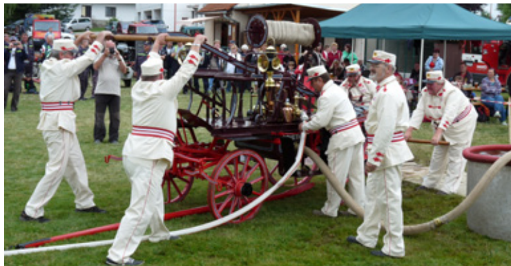
▲ Ukázka práce s historickou stříkačkou.