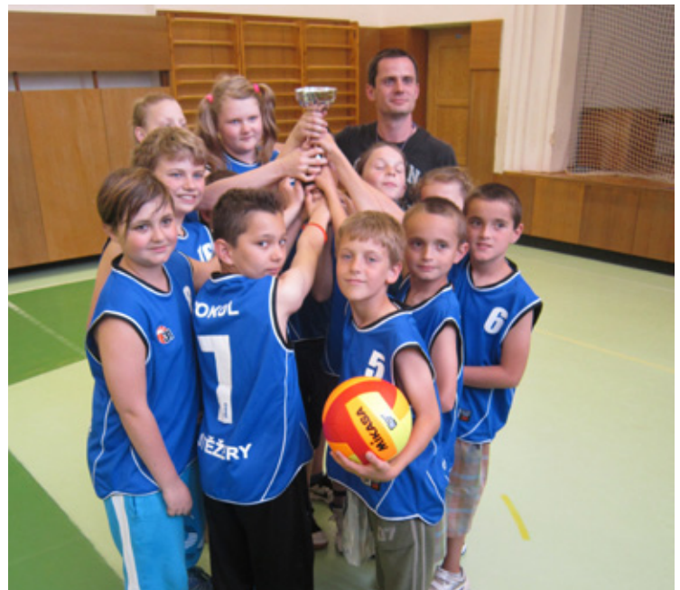
▲ Stěžery - vítězné družstvo ve vybíjené (st. kategorie).