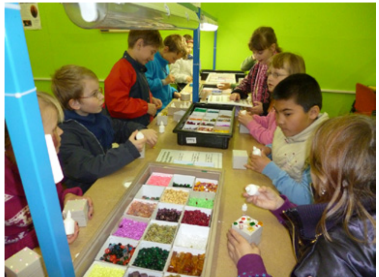
▲ Exkurze tříd 2.A, 2.B, 1.S Brusírna perel a kozí farma Pěnčín.