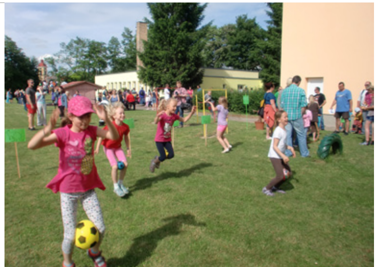
▲ Jedno ze stanovišť na „cestě kolem světa.“