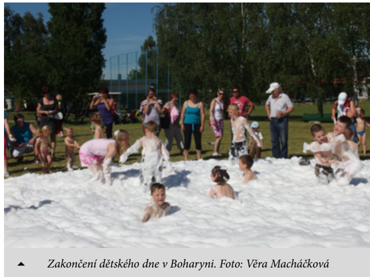
▲ Zakončení dětského dne v Boharyni.