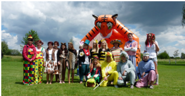
▲ Dětský den v Sadové v maskách.