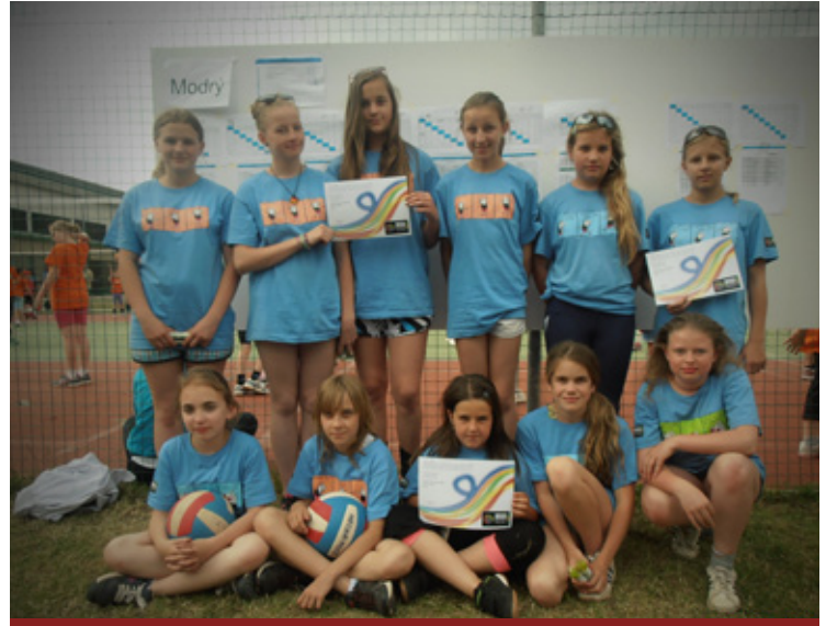
▲ Volejbalové reprezentantky TJ Sokol Nechanice.

Trenérka Martina Kubrtová a Václav Zámečník