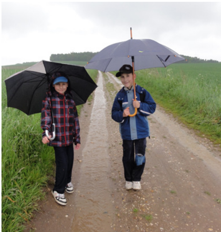
▲ Pod Jehlickým vrchem - a přece jsme to zvládli.