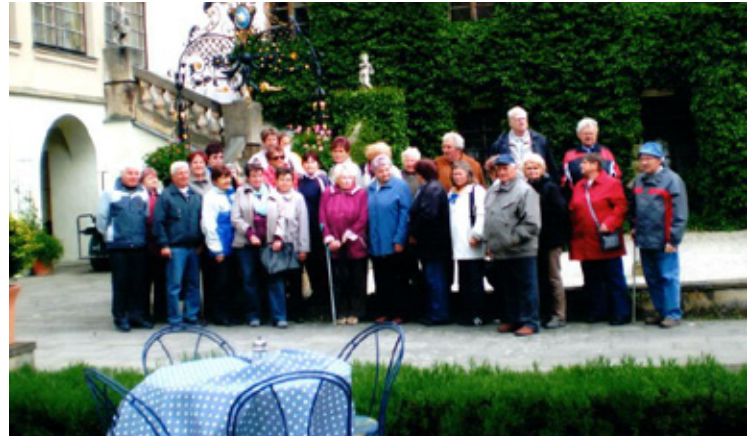
▲ Účastníci výletu na zámek do Častolovic.