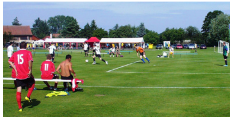
▲ Pouťový turnaj v Pšánkách.