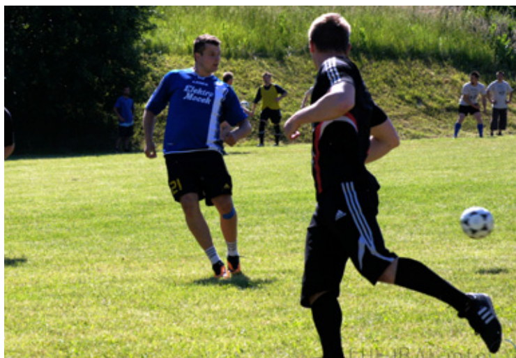
▲ Turnaj v malé kopané.