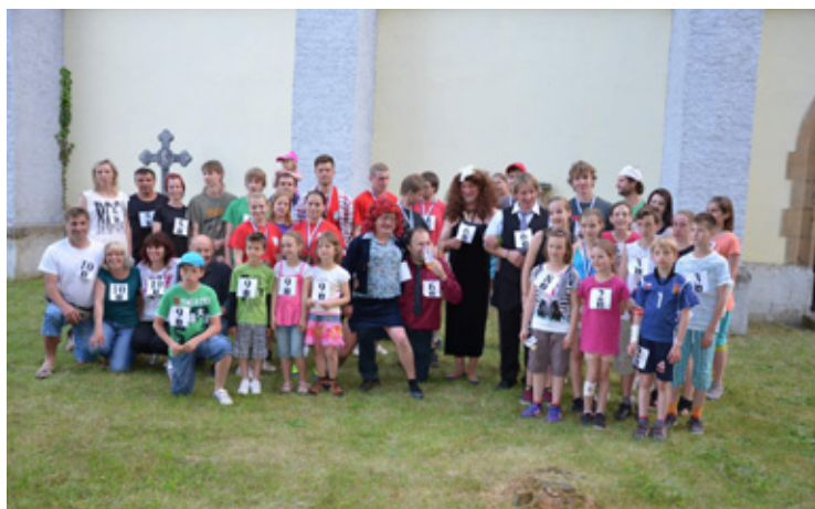
▲ Účastníci štafetového běhu.