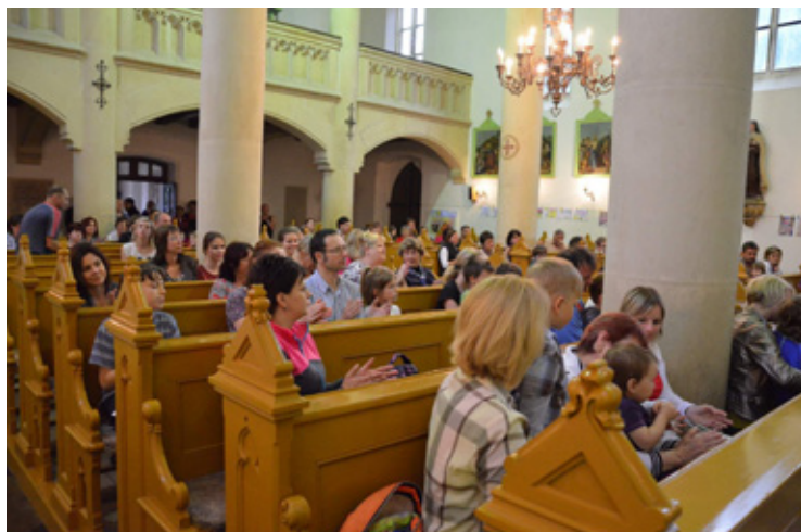
▲ Návštěvníci kostela během koncertu dětského sboru Kaštánek.