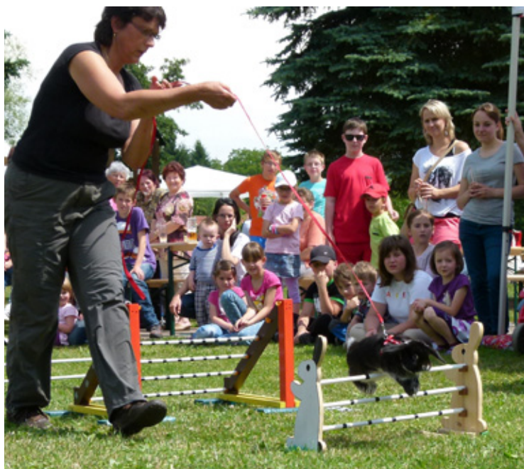
▲ Králíčí hop na dětském dnu v Mokrovousích.