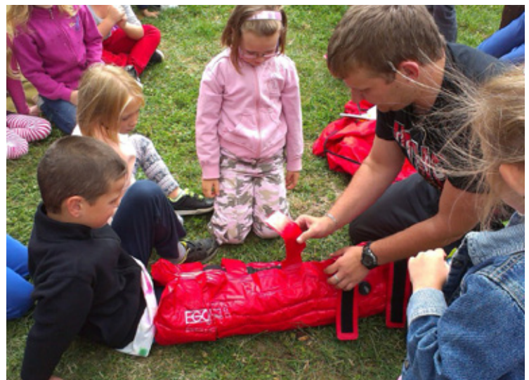
▲ Ukázka fixace zlomené končetiny.