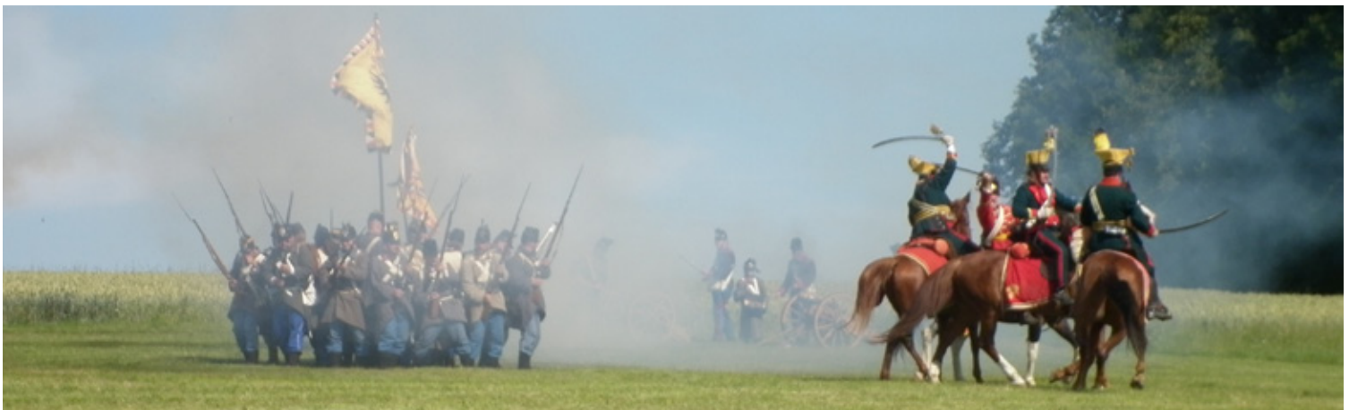
▲ Bitevní ukáзка v Třesovicích.