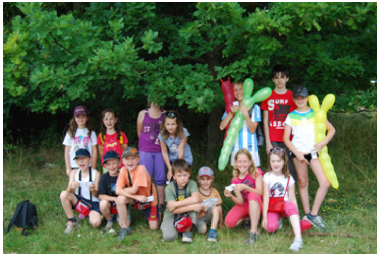
▲ Účastníci putování za pokladem.