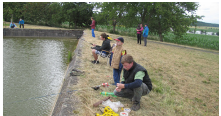
▲ Rybářské závody.