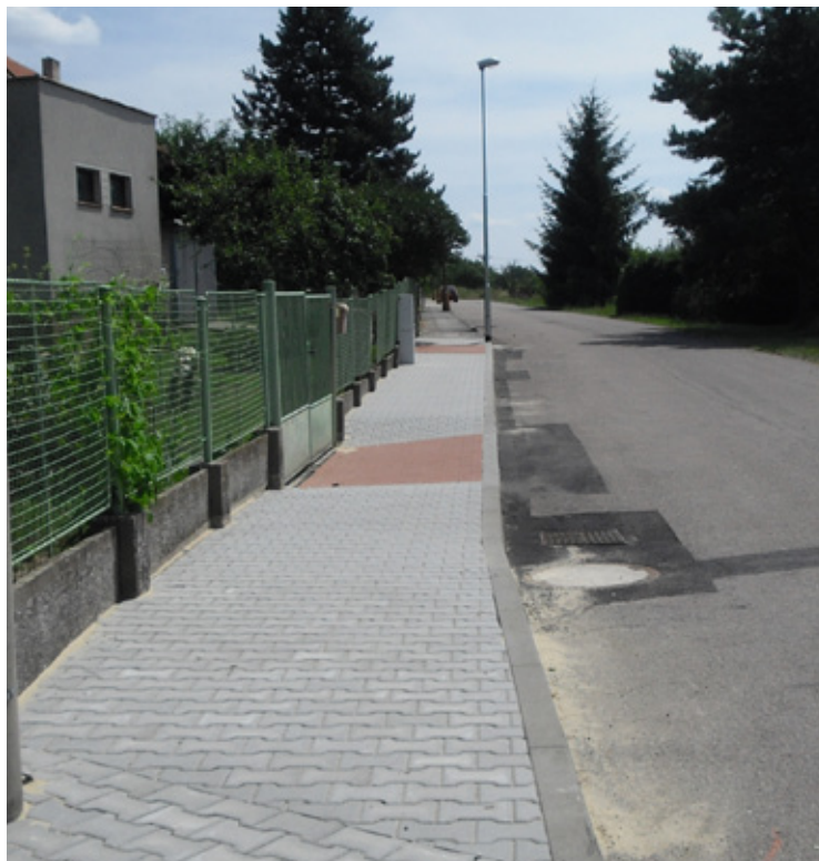
▲ Opravený chodník ve Sluneční ulici.