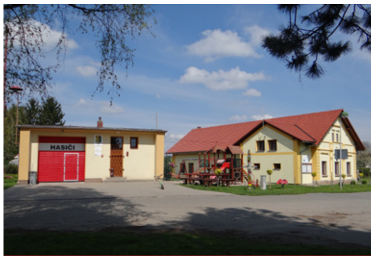
▲ Náves Sověťice.