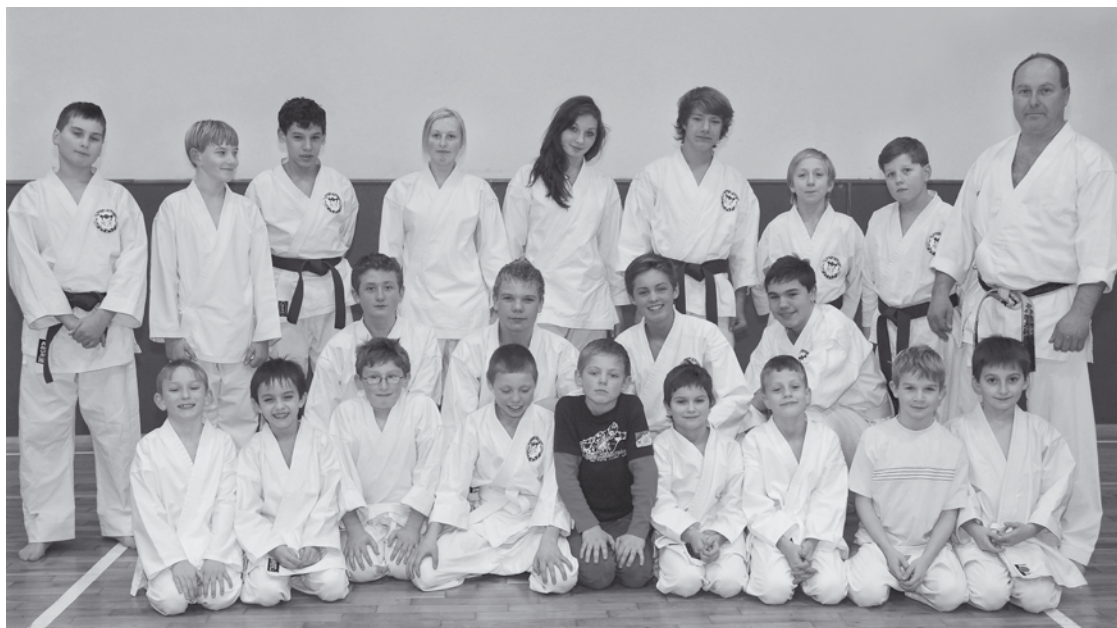
▲ Oddíl mladých karatistů ze Stěžer.

TJ Sokol Stěžery má velmi mnoho různých oddílů, ve kterých sportují stovky mládežníků. Členskou základnu v současné době tvoří téměř 600 stěžerských občanů. Nejmladším oddílem je oddíl karate pod vedením trenérů Miloše Jedličky a Jana Klimeše. Nejmladší karatisté slavili teprve 4 roky své činnosti. Zpočátku se oddíl soustřeďoval hlavně na cvičení celého těla, rozvoje obratnosti