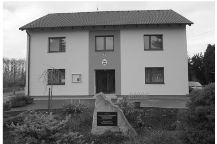
▲ Budova obecního úřadu před a po rekonstrukci.