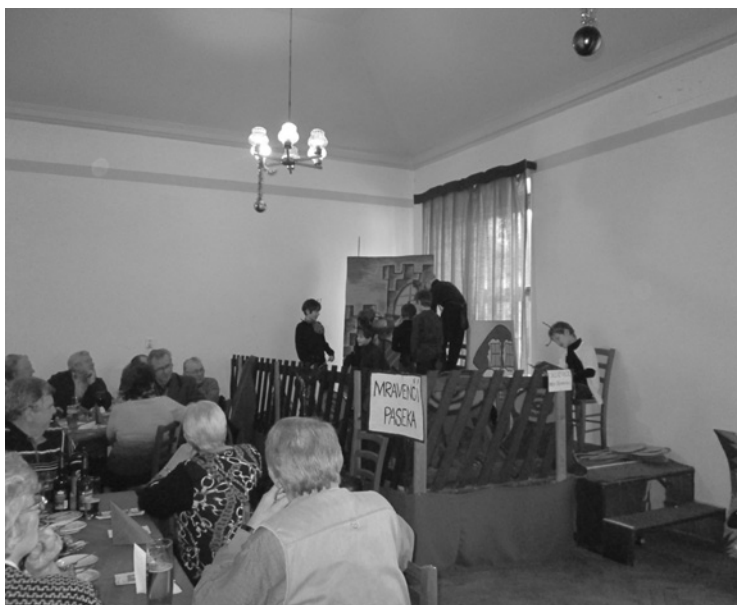
▲ Na mravenčí pasece - divadelní představení dětí ze ZŠ pro seniory v Boharyni.