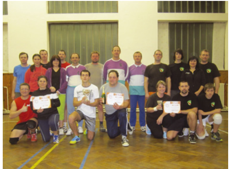
▲ 1. místo Hněvčeves, 2. místo Sky Team Sadová a 3. místo Mokrovolej z Mokrovous.

Vyrovnaným výsledkem 19:25 a 26:24 skončil zápas mezi Sadovou A a Sadovou B (skóre 1:1). Poslední zápas mezi Sověticemi a Sky Teamem Sadová nabral nečekaný obrat. Sověticím se po celý den nedařilo vyhrát ani jediný zápas. Oproti tomu Sky Team Sadová byl jasným favoritem. Poslední zápasem se Sověťice málem postaraly o závěrečné překvapení. První set skončil 13:25 a druhý neuvěřitelně těsně 24:26. Tento zápas však závěrečné pořadí neovlivnil. První místo získal jasný favorit a velké překvapení tohoto turnaje – skvěle hrající Hněvčeves. Tým měl na kontě devět vyhraných zápasů