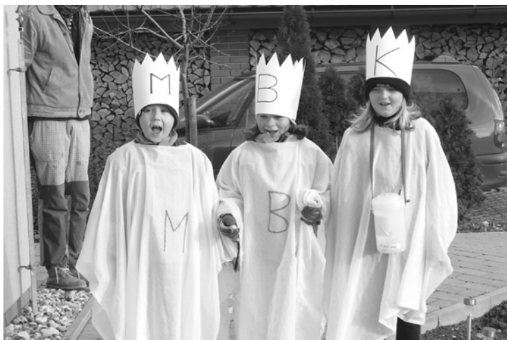
▲ Tříkrálová sbírka v Radostově.