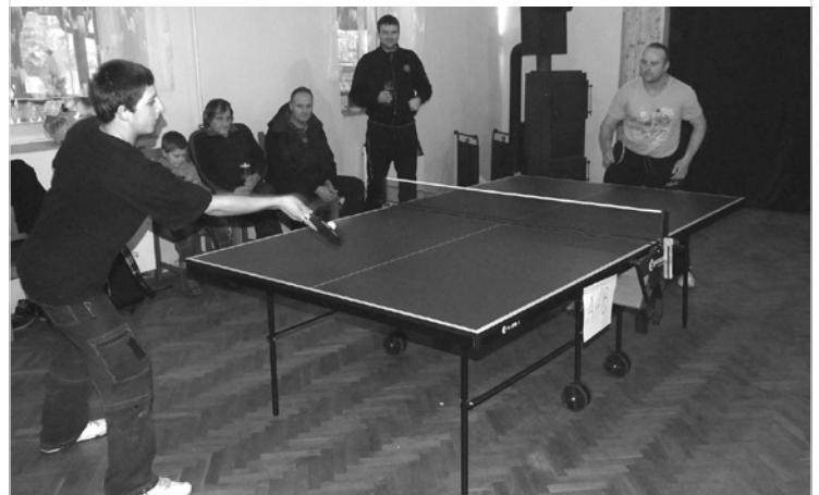
▲ Ping-pongový turnaj.