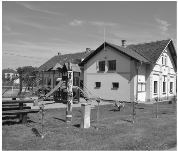
▲ Upravené centrum obce.

Teď také trochu z jiného soudku. Rok 2012 se přehoupl a leden 2013 již značí spoustu práce pro zastupitelstvo. Jednou z prvních akcí bude rekonstrukce účelové komunikace v obci Sověticích. Po třech letech, plných žádostí a povolení, byla obci přidělena dotace ve výši 475.000,- Kč z Programu obnovy venkova Královehradeckého kraje, tudíž nic nebrání zahájení prací v první polovině letošního roku. Druhou dotací z Královehradeckého kraje ve výši 250.000,- Kč bude řešena druhá etapa projektových dokumentací biologického čištění odpadních vod pro obec Sověticích a Horní Černůtky. Poslední dotací 600.000,- Kč z Ministerstva zemědělství budou řešeny akce v průběhu ledna. Variantami jsou výměna střechy na budově obecního úřadu, popřípadě nové řešení veřejného osvětlení.