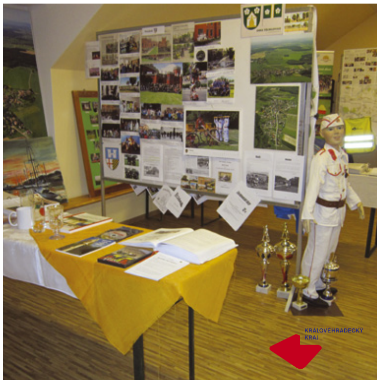
▲ Výstavní expozice.