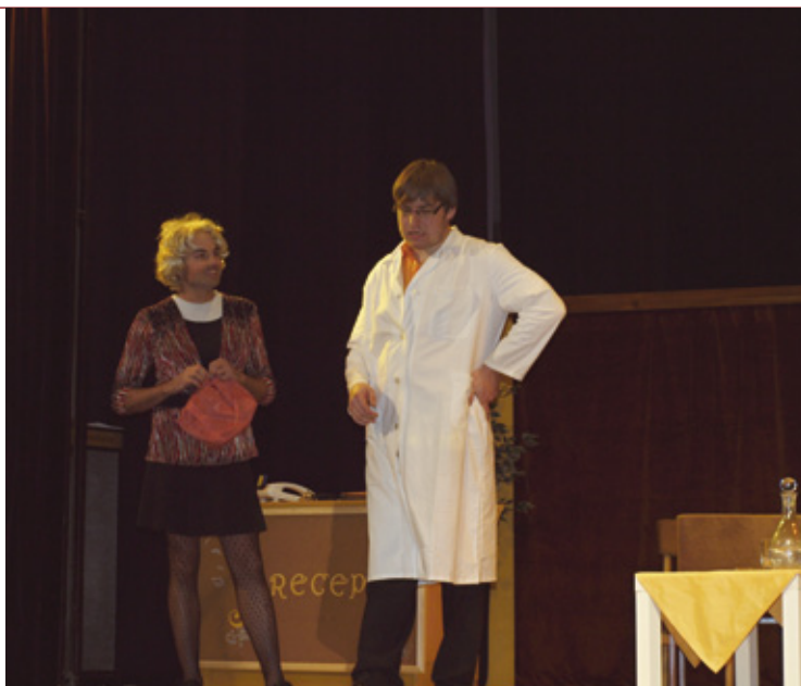
▲ 9.12.2012 Kulturní dům Nechanice - první představení ochotníků z Nechanic.