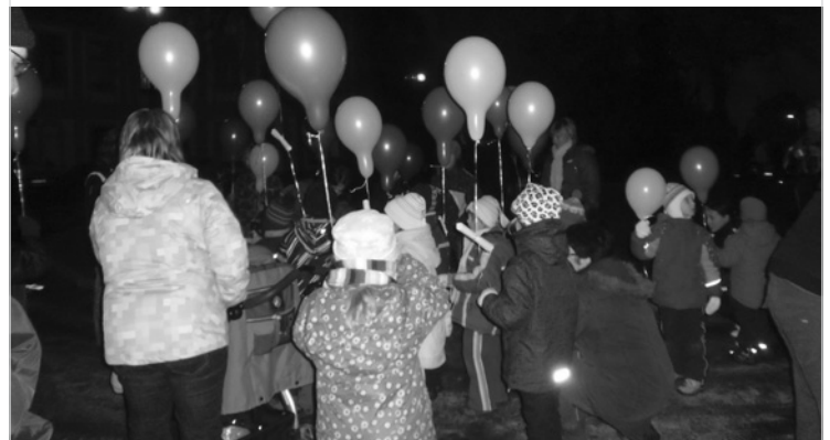
▲ Děti s balónky pro Ježíška na předvánočním setkání v Dolním Přímě.