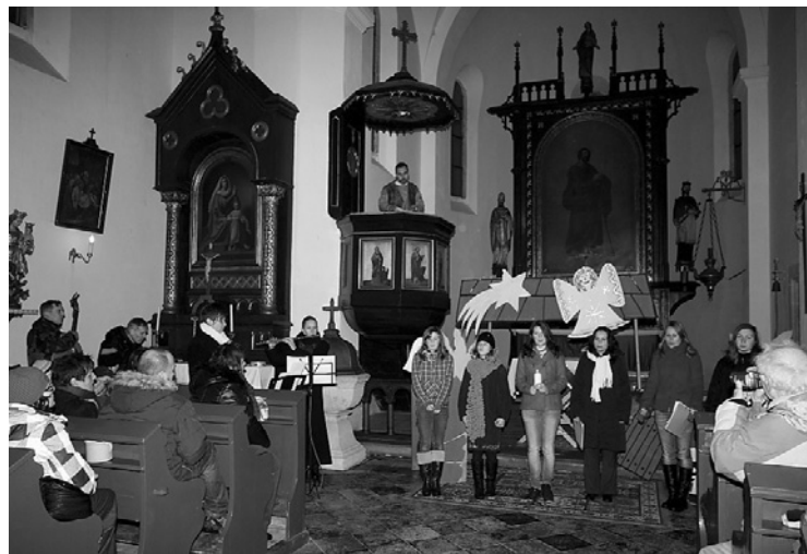
▲ Zahájení vánoční hry Legenda o narození Ježíše.