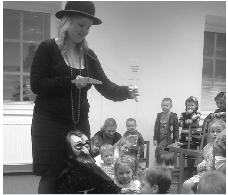
▲ Pohádka Jak šel kozlík do světa, CVČ Kunčice, 12. 1.

Více na www.loutkovopohadky.cz . Lída Valešová