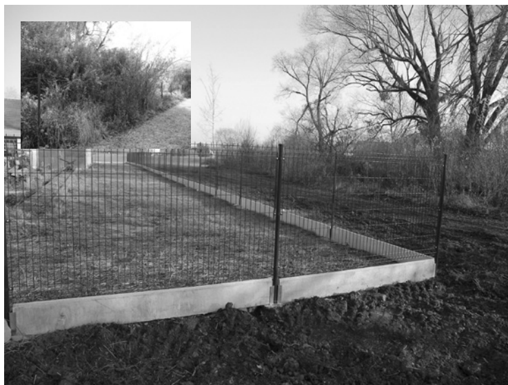
▲ Nové oplocení sběrného dvora v Sadové.