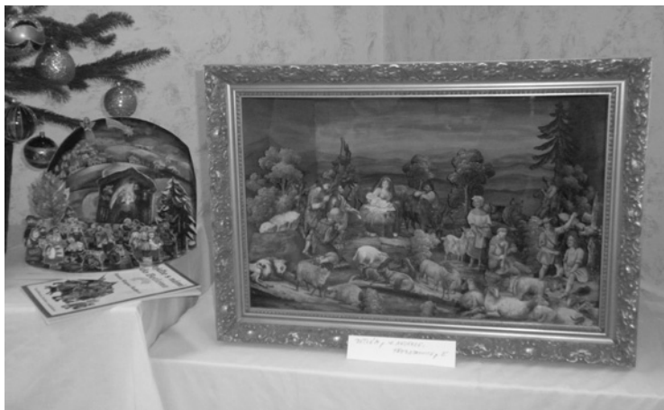
▲ Betlémy na vánoční výstavě.