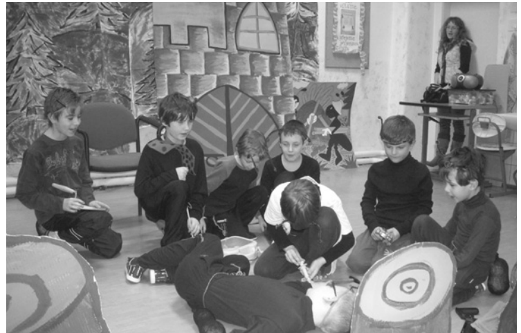
▲ Představení dětí ze ZŠ - Na mravenčí pasece.