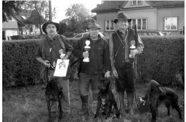
▲ Vítězové tradičních podzimních zkoušek loveckých psů.

Podzimní zkoušky tak proběhly příjemně a klidně. Sobotní den strávený s pejsky se vydařil, jedinou malou vadou na krásu bylo přihlašování psů. Připraveny byly 3 lokality pro 3 skupiny se slušným zazvěřením (což je dneska dost velký problém skoro všude), a proto je menší účast trochu zarážející. Vzniká tak zbytečně velký tlak na poslední letošní