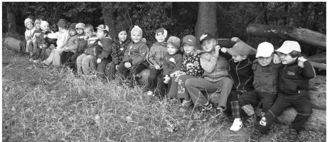
▲ Vycházka dětí MŠ Boharyně.