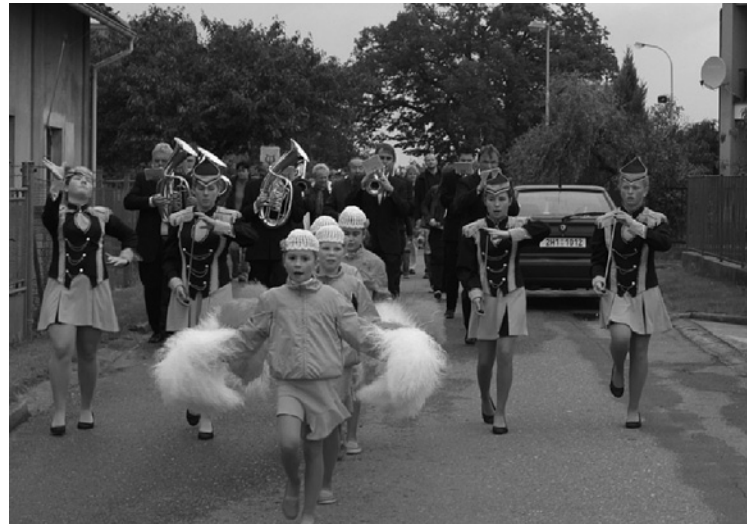
▲ Sraz rodáků a občanů Těchlovic.