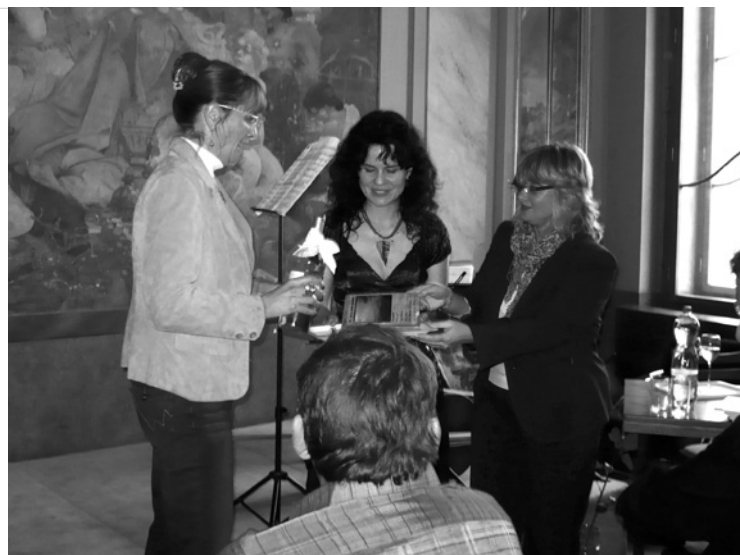
▲ Křest knihy autorky Evy Černošové.