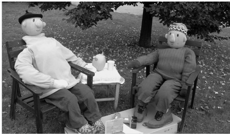
▲ Jedno z dýňových aranžmá na návsi ve Stěžerách.

Hezký podzim přeji paní učitelky ze ZŠ ve Stěžerách.