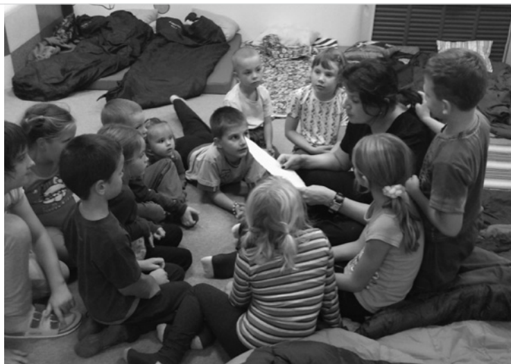
▲ Děti poslouchají motivační příběh těsně před tím, než se vydaly na stezku odvahy.