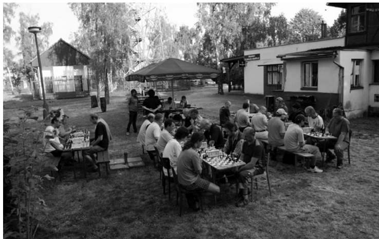
▲ Každý rok o letních prázdninách se hraje na Chlumu seriál turnajů v bleskovém šachu.