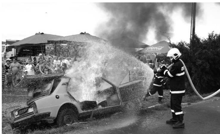
▲ Ukázka hasičského zásahu při požáru auta.