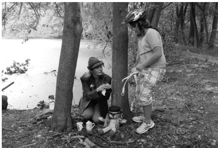
▲ Jedna ze zastávek cyklovýletu.