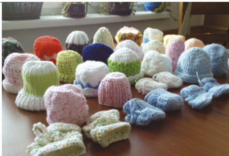
▲ Háčkové čepičky a bačkůrky pro neonatologické oddělení dětské kliniky v Hradci Králové.

Bohatý doprovodný program zajištěn. Více informací na www.nechanicko.cz