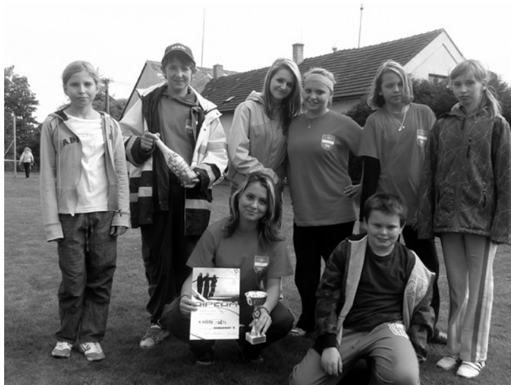
▲ Družstvo mladých hasičů z Mokrovous na závodech ve Bříze 15. 9. 2012.