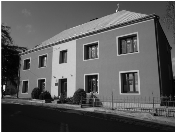
▲ Budova školy po rekonstrukci.