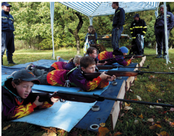
▲ Družstvo Sovetic při plnění jednoho z úkolů.

úspěch dětí „Soviček“ v letošním roce. Získaly první místo v celostátní soutěži „Dávají za nás ruku do ohně“.