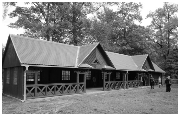
▲ Zrekonstruovaný kuželník v Ratibořicích.

5. října pro nás byly připraveny dvě varianty programu. Při dobrém počasí to byla procházka na hrad Vízmburg. Při nepříznivém počasí návštěva Červeného Kostelce. Počasí nakonec tolik nepřálo, tak jsme se mohli alespoň seznámit s tímto městem. Pan starosta nás přivítal před kinem Luník, které prošlo rozsáhlou rekonstrukcí. Při naší návštěvě to byly pouhé tři měsíce od znovuootevření kina. Velmi nás překvapilo netradiční vybavení sálu – v prvních řadách jsou pro návštěvníky kina místo obvyklých sedaček malé třímístné gauče.