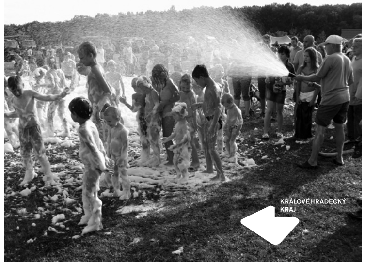
▲ Velmi oblíbená a pravidelná část programu - hasičská pěna.

Zlatým hřebem programu, zejména pro menší děti, pak byla hasičská pěna nastříkaná v tlusté vrstvě na trávník, kde se mohli všichni dosyta vyřadit a radost jim nezakazilo ani následující umytí hasičskou hadicí,