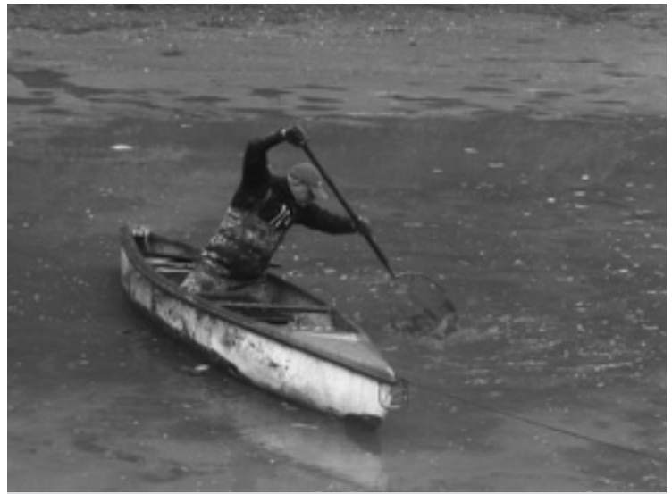
▲ Vypuštění a výlov rybníka dne 22. 10. 2011.

Zjara, po napuštění rybníka „V parku“, se do něj kapři, štiky a líni vrátí k zarybnění a navíc bude zakoupena i nová rybí násada.