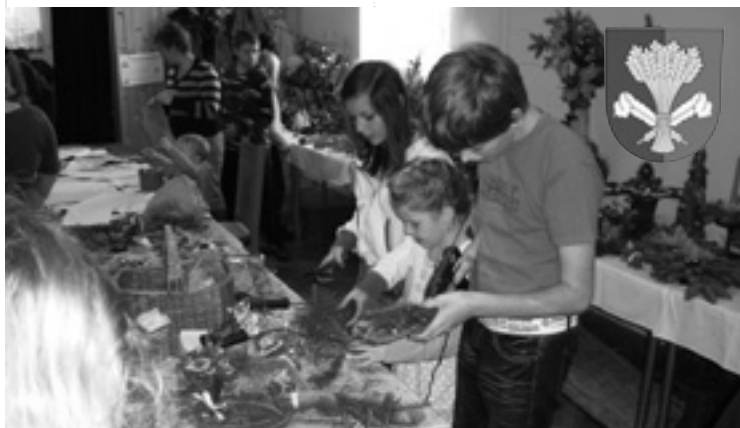
▲ Adventní dílna v Lodíně.