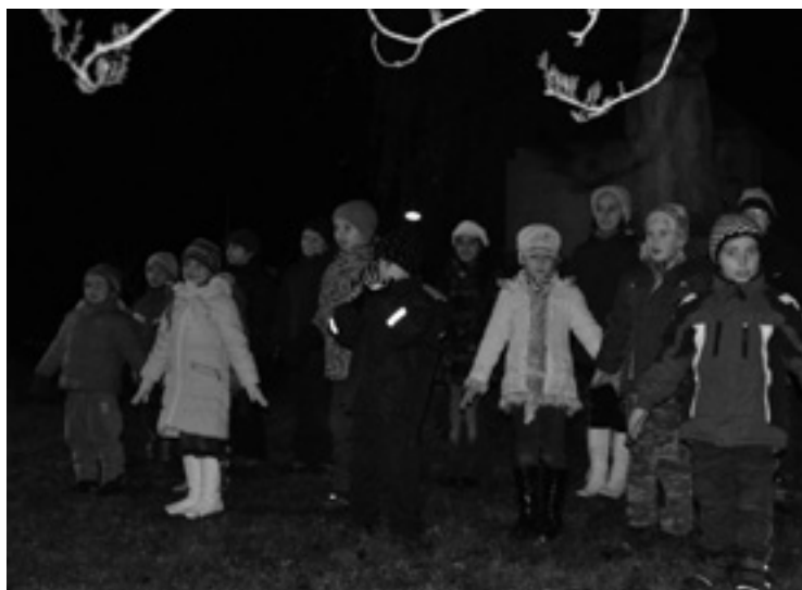
▲ Děti ze ZŠ Dohalice při svém vystoupení na prvním letošním rozsvícení vánočního stromu na návsi.

V současné době má náš spolek okolo deseti členek. Rády mezi sebou přivítáme další zájemkyně, které mají hlavu plnou nevyužitých nápadů nebo si jen chtějí odpočinout od každodenních starostí a rády pomohou s přípravami