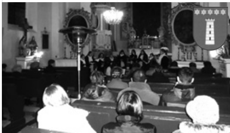
▲ Adventní koncert sboru Kantilény z Hradce Králové.