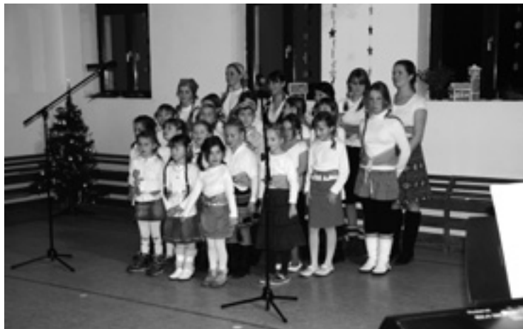
▲ Koncert dětského pěveckého sboru Kaštánek.