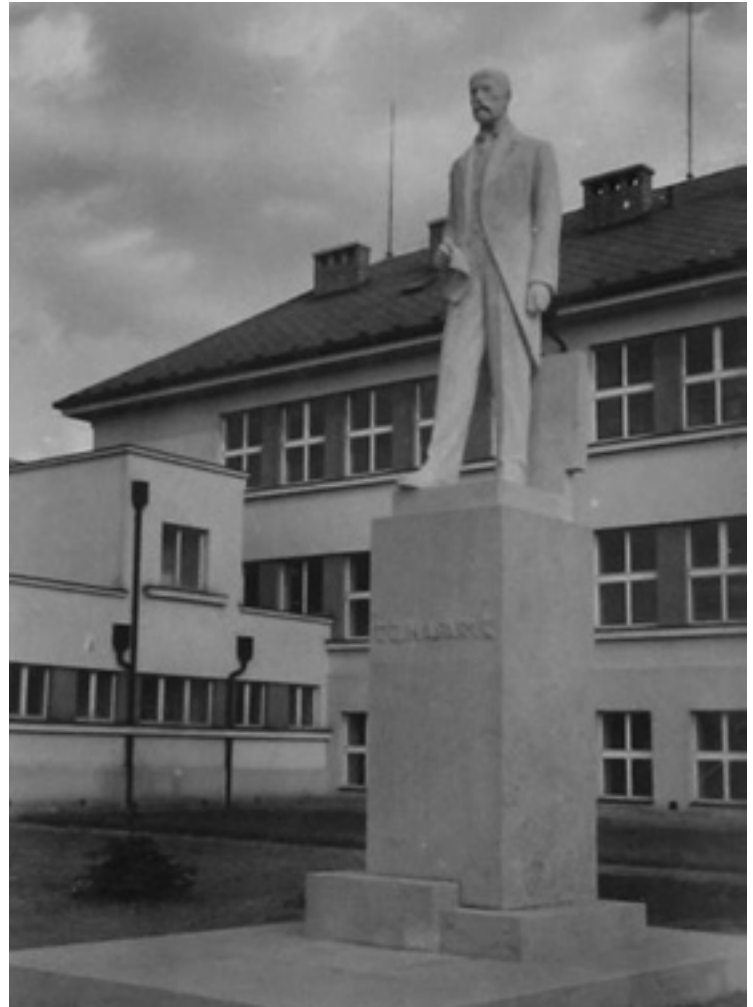
▲ Původní pomník T. G. Masaryka.