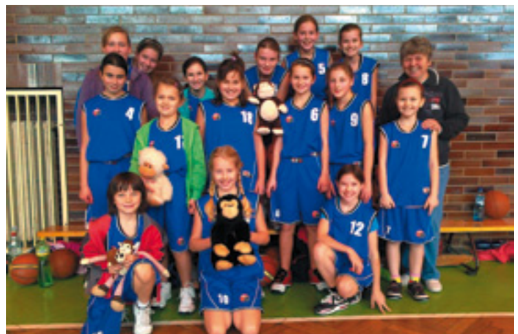
▲ Vítězné družstvo Sokol Stěžery po zápase s TJ Svitavy 2x výhra 93:24 a 66:27.