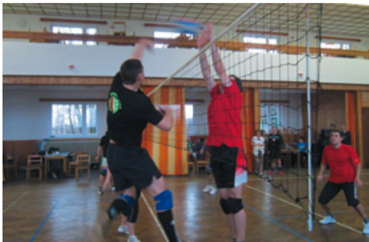
▲ Mokrovolej team proti družstvu Sadové.