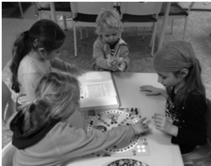
▲ Děti v herně mateřského centra.

nost vzájemného setkávání se a rodiče by jistě neznali tolik lidí se stejnými staršími dětmi, byli bychom ochuzeni o krásné chvíle, které spolu travíme.