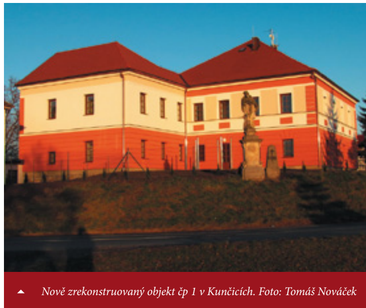
▲ Nově zrekonstruovaný objekt čp 1 v Kunčicích.

V prvním patře se nachází velký sál o rozměrech 18x6 metrů o jehož využití se zatím diskutuje. Přesto však byl paradoxně tento prostor využit jako první. Místní ženy jej proměnily v tělocvičnu a scházejí se tam pod vedením paní Hornychové každou středu. Nový objekt bude patrně žít sportem, protože