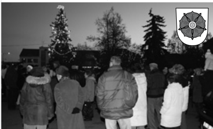
▲ Rozsvícení vánočního stromu v Nechanicích.