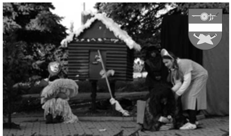
▲ Mrazík na ruby v podání dětského divadelního kroužku z Obědovic.