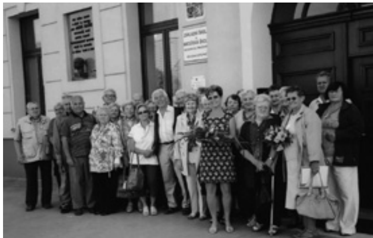
▲ Setkání spolužáků v základní škole po šedesáti letech.