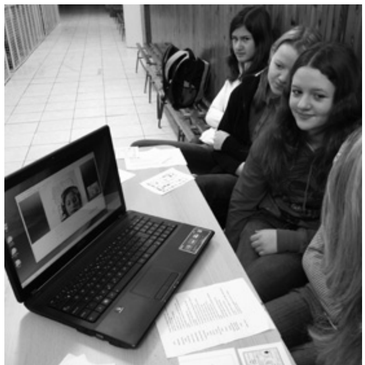
▲ Žáci osmého ročníku při komunikaci s žáky z Filipín.