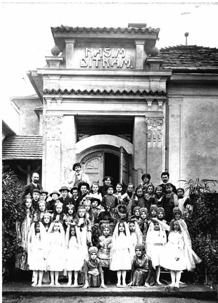
▲ Škola ve Mžanech.