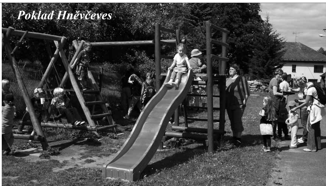
▲ Příjemné zastavení a odpočinek na půli cesty za pokladem.