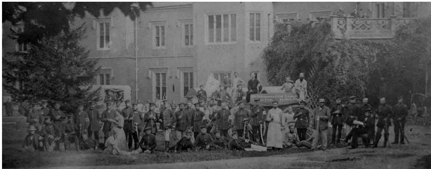
▲ V budově zámku a v okolí byl pruský polní lazaret. Tato reprodukce je z nejstarší fotografie zámku, kterou v roce 1866 pořídil F. Strzelin z Berlína.