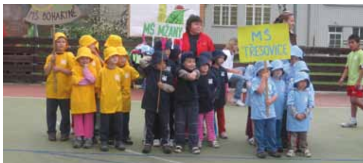
▲ Děti z Boharyně, Mžan a Třesovic před zahájením olympiády.