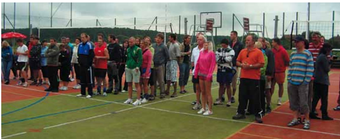
▲ Zahájení turnaje Lodin Cup.