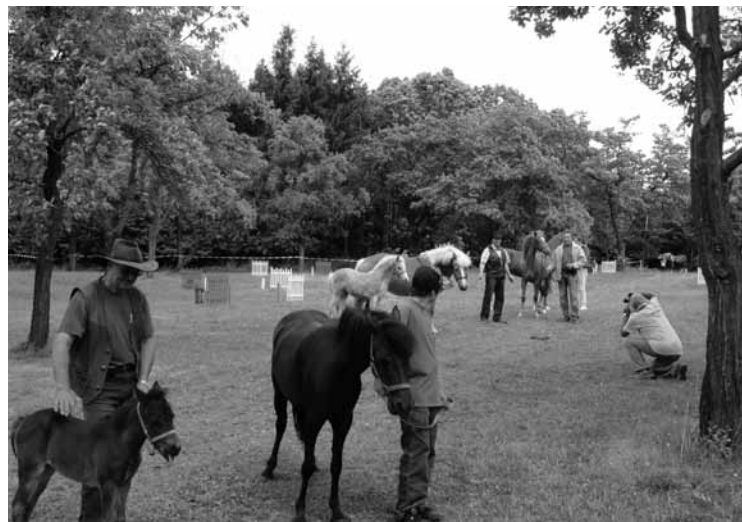
▲ Chovatelé z Černůtek.