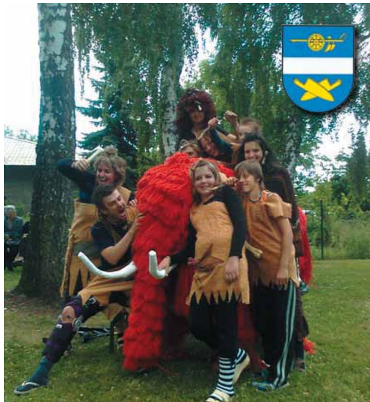
▲ Mamut v obležení na dětském dni v Mokrovousích.