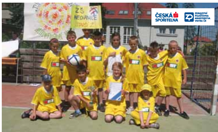
▲ Vítězné družstvo Nechanic.