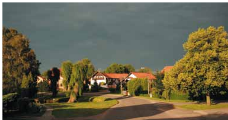
▲ Podvečer na hradeckém venkově - Mžany 2010.