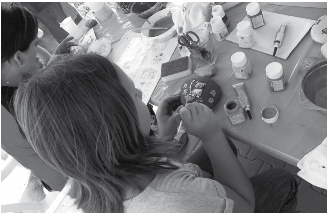
▲ Malování na obléžky.