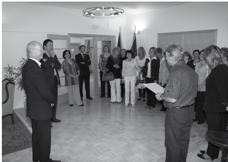
▲ Přijetí souboru na velvyslanectví.