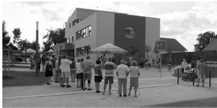
▲ Otevření CIS ve Stěžerách 17. června 2011.