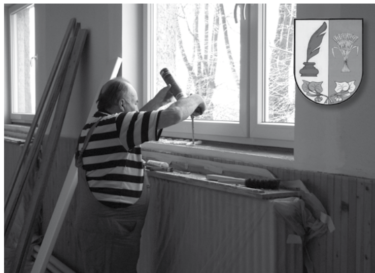
▲ Výměna oken hněčveské haly.

Z nového sociálního zařízení se již radovali účastníci plesové sezóny 2011, na mysliveckém plese, Janákovy selské jízdy a na hasičském bále. Dále II. ročníku volejbalového turnaje amatérských družstev a závěrem při tradičním dětském karnevalu pořádaném hasiči z Hněčevse a Sovětic. Potom byla hala na čas veřejnosti uzavřena a začala výměna oken a zateplování stropu. Po ukončení prací se uskutečnil nohejbalový turnaj Sokolů a hasičů Hněčevse a nově dvě divadelní představení pro děti a dospělé pořádaný OÚ Hněčevse a též tradiční velikonoční tvoření. Během zimy je hala využívána na trénování dětí Sokola Dohalice a základní školy Cerekvice a k utkání volejbalových nadšenců z okolních obcí. Bývalí i současní Sokolové z Hněčevse mají halu jeden večer