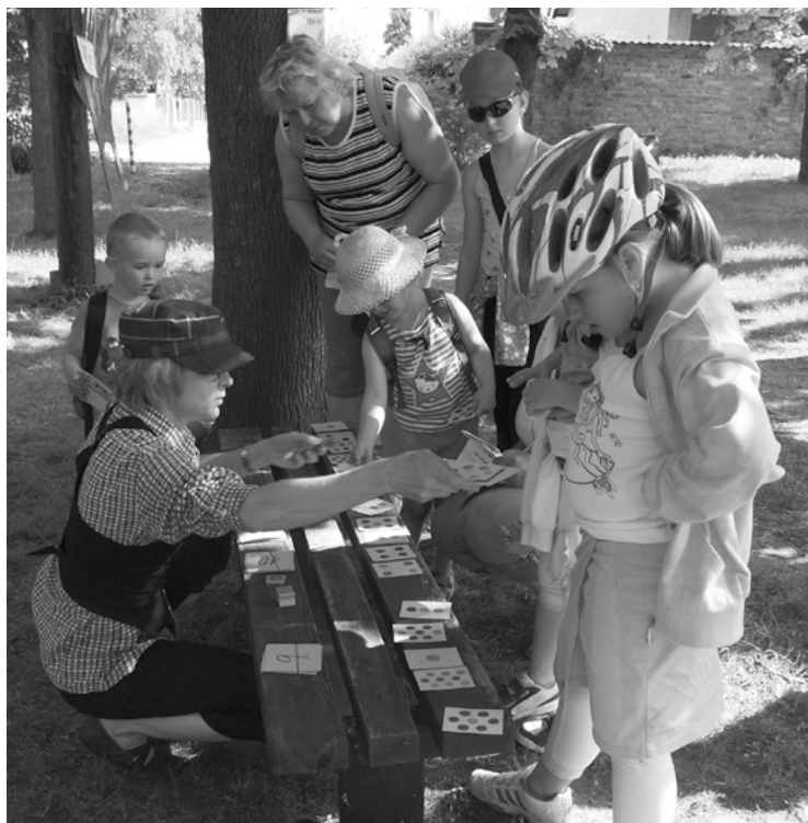
▲ 30. ročník Šlápoty.