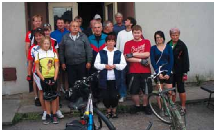
▲ Puchlovičtí cyklisté na jedné ze zastávek výletu na kolech.