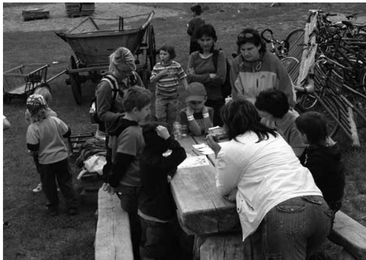
▲ Několikadenní pobyt v ekofarmě Alwin u Chlumce nad Cidlinou.