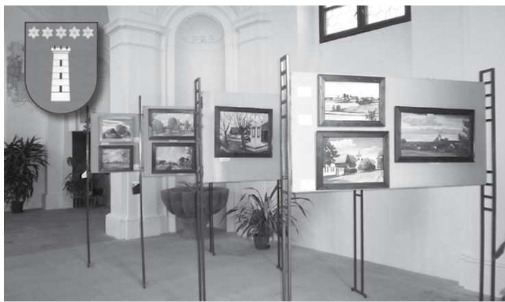
▲ Výstava obrazů malíře Ing. Šafry v kapli na Dolní Přímu.