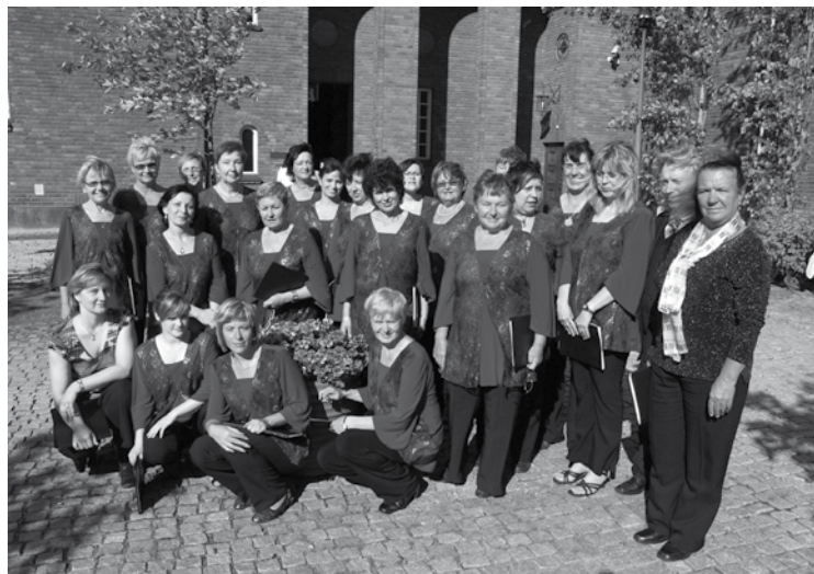
▲ Cantus Feminae v Helsinkách.