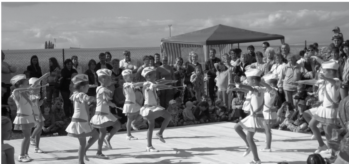
▲ Vystoupení hořických mažorettek na oslavách ve Mžanech.