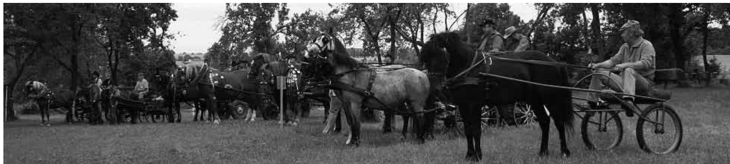
▲ Den koní