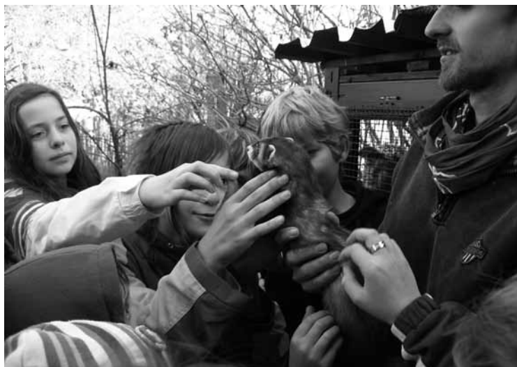
▲ Návštěva v záchrané stanici zvířat v Jaroměři.