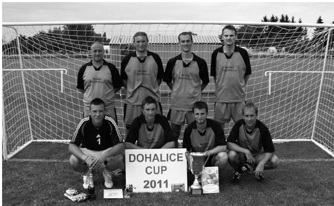
▲ Podlipáci Hořice zaslouženě dokráčeli v Dohalicích k prvenství v turnaji.

osmifinále: Mambo - Štronček 6:0, FC U kulatý báby - Tóša team 1:1 na pen. 3:2, Podlipáci Hořice - JZD Petkovy 7:2, FC White Brothers -