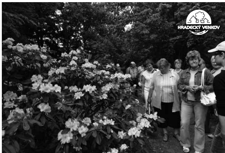
▲ Kvetoucí rododendron v Dendrologické zahradě.

Iva Horníková Manažerka MAS Hradecký venkov