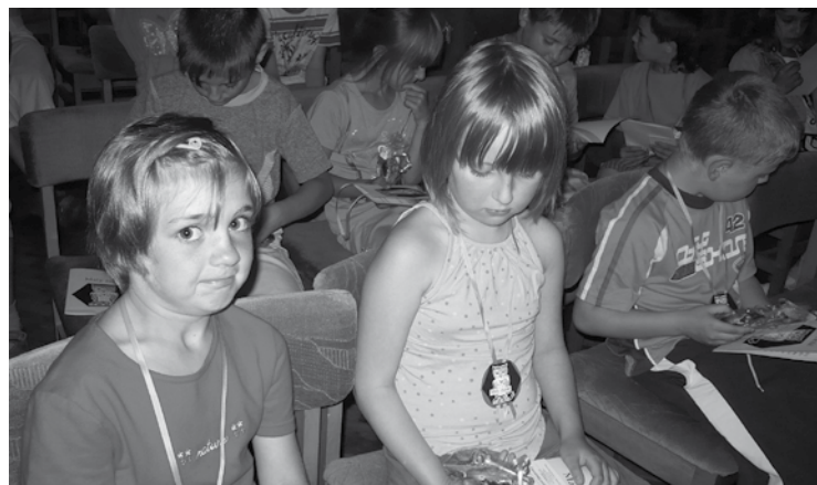
▲ Tradiční pasování malých čtenářů ve Štolbově městské knihovně.