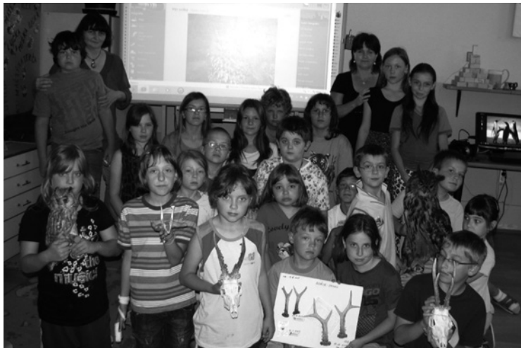
▲ Beseda s dětmi o sovách a srncích zvěřích v ZŠ Mžany.