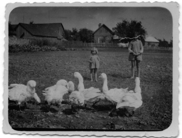
▲ Děti při pasení hus - jedna z jejich každodenních povinností.

Tady vzpomínky mého otce končí, tím, ale nekončí život Mžan, ani ve Mžanech. Škoda, že tatínek ve vzpomínkách nepokračoval, čas mu asi nedovolil. Nedovolil mu hlavně napsat to, že Mžany miloval tak moc, že svou první manželku, tedy moji maminku, si našel taky ve Mžanech a když maminka ve svých třidvaceti letech zemřela, našel si i svoji druhou manželku tam....., ve Mžanech.