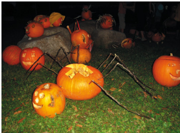
▲ Tzv. „dýňáci“ na prostranství před nákupním střediskem.

Tradičně velmi mnoho akcí připravuje Sokol Stěžery. Hojně navštívené byly letos opět „Stěžerské šlapačky“. Nejsilněji obsazená byla letos trasa pro nejmenší, která v délce pěti kilometrů vedla přes Stěžírky do těchlovického lesa a zpět. Téměř stále je