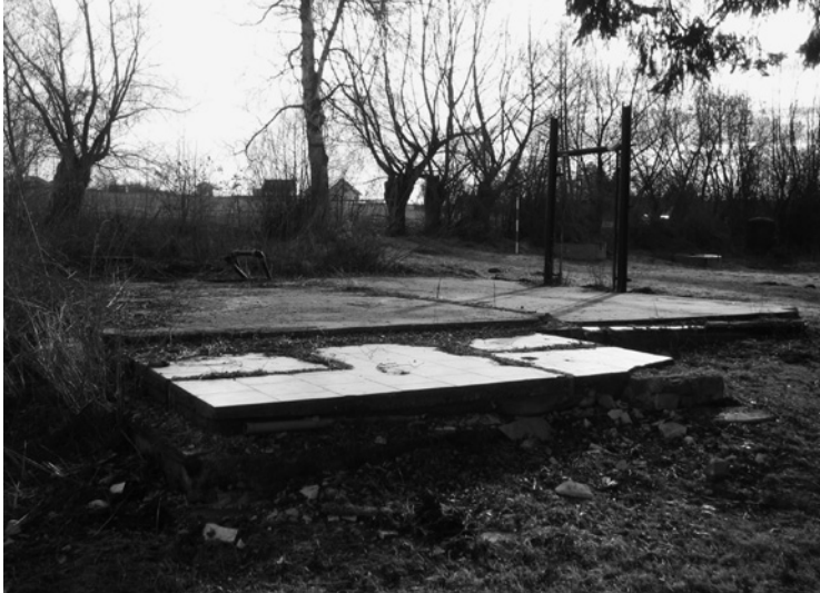
▲ Původní základové deska zbouraného kiosku.