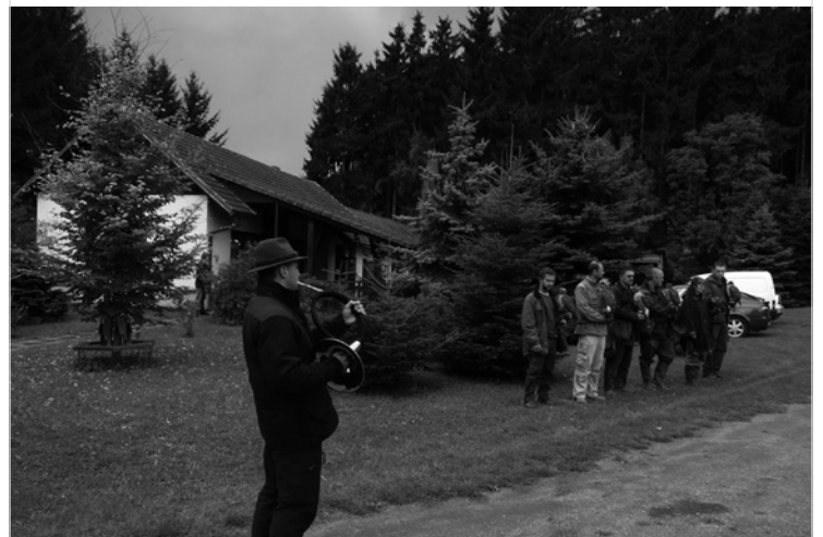
▲ V sobotu 8. října se uskutečnilo v areálu hájenky v Boru setkání sokolníků spojené s ukázkou přeletů a vlastního lovu na zajíce.