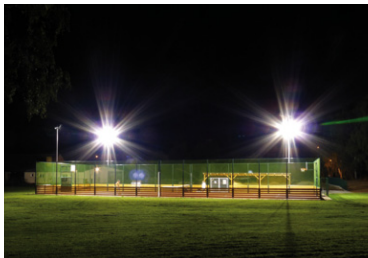
▲ Nové sportovní hřiště v Sadové.