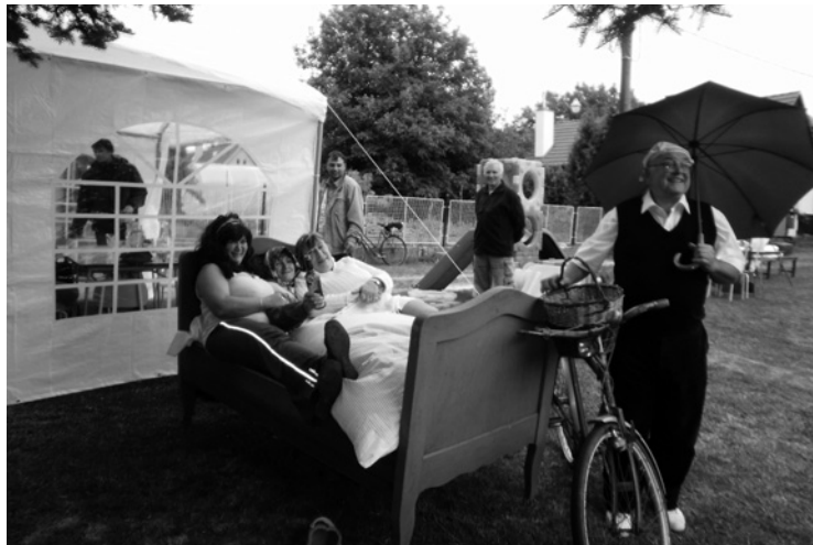
▲ Otík s babkou Škopkovou na návsi v Popovicích.