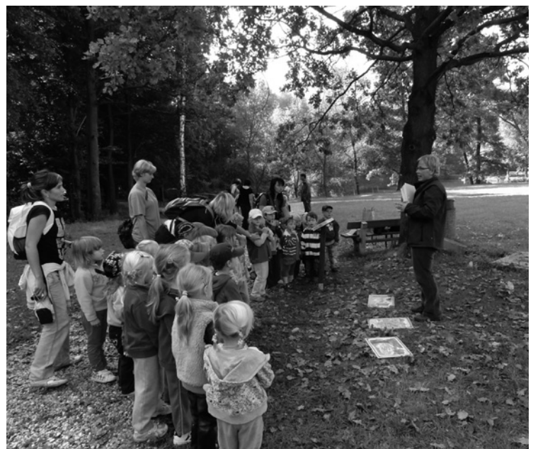
▲ Malí účastníci vzdělávacího programu na jednom ze stanovišť.

Tento program je spolufinancován Krajským úřadem Královéhradeckého kraje.