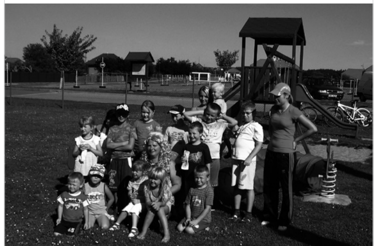
▲ Jedna ze zastávek pochodu okolo Lodína.