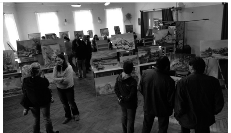
▲ Výstava obrazů konaná u příležitosti posvícenské zábavy na Hrádku.