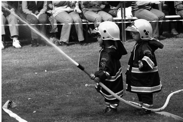
▲ Ukázka sovětických Soviček.