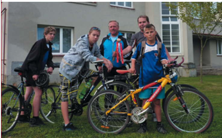
▲ Sletová štafeta.

Veselé Vánoce a šťastný nový rok Vám přeje správná rada mikroregionu Nechanicko.