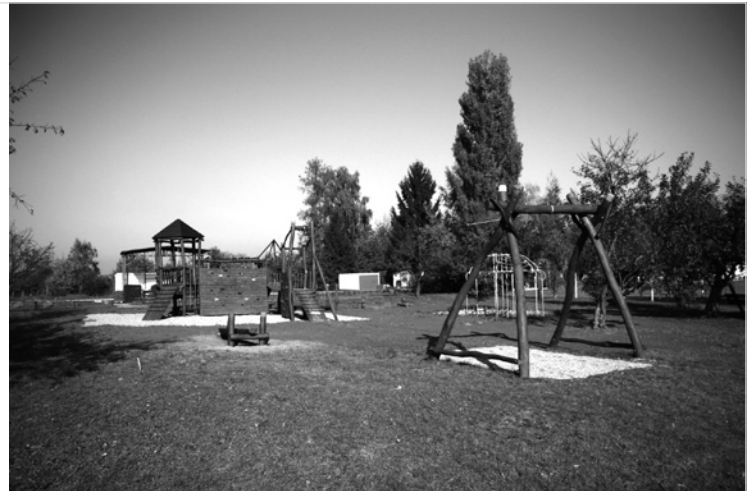
▲ Nově otevřené dětské hřiště v Boharyni.