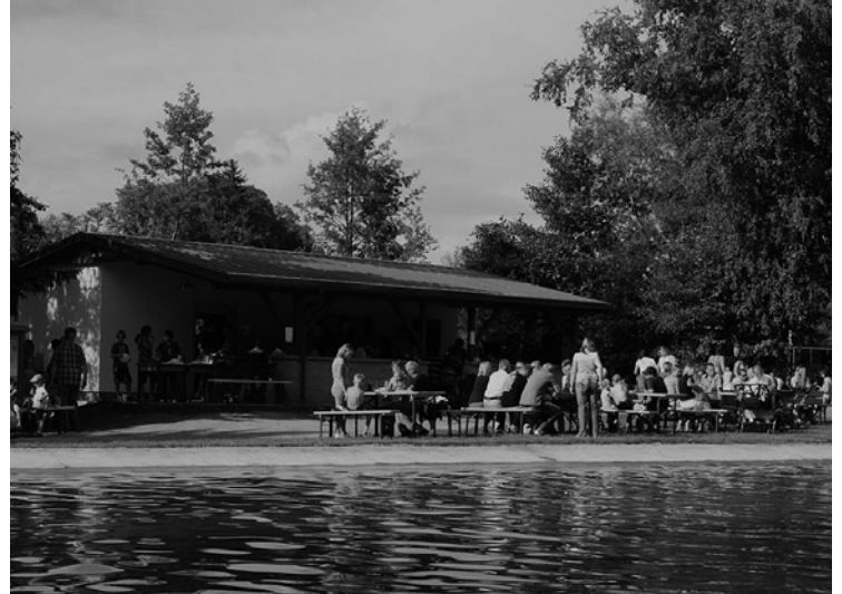
▲ 6. srpna proběhlo slavnostní otevření letní hospody.