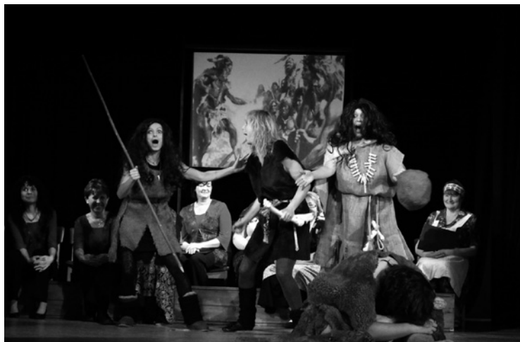
▲ Názorné provedení historií sboru.