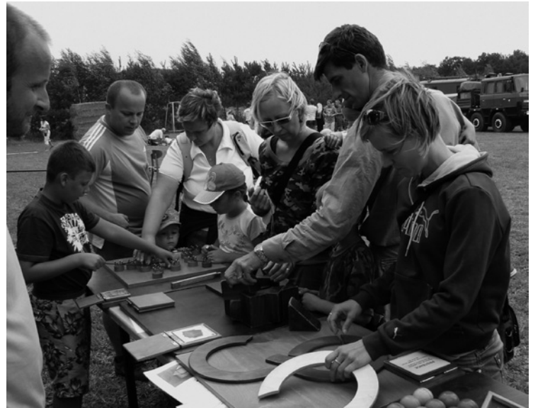
▲ Hlavolamy zapůjčené z IQ parku z Liberce potrápily i nejednoho dospěláka.