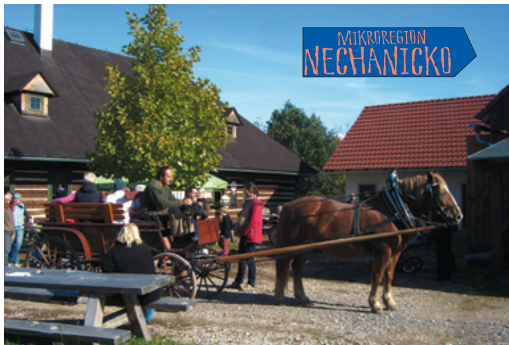
▲ Putování Hradeckem - 15. října ve skanzenu v Krňovicích.