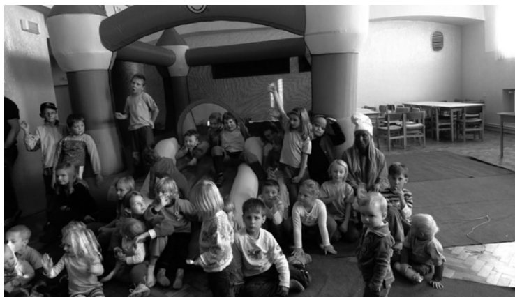
▲ Návštěva pohádkové Šmoulinky na oslavě pátých narozenin mateřského centra.