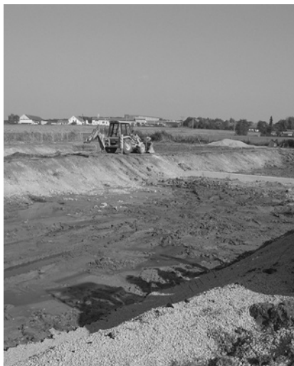
Rekonstrukce ČOV Lodíně