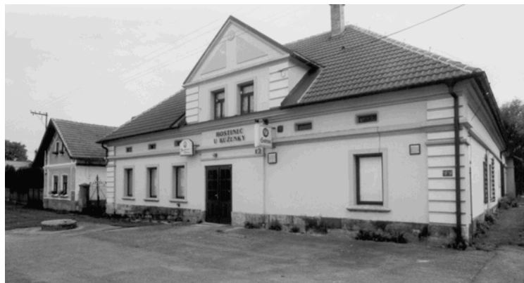
Obecní hostinec „U Růženky“

Jméno vesnice bylo původně Blšany, utvořené ze staročeského slova blcha (blecha). Údajně šlo o ves lidí Blechových. Souhláska „l“ zanikla pro usnadnění výslovnosti a skupina Bš se s podobou změnila v Pš (Blšany – Bšany – Pšany – Pšánky).