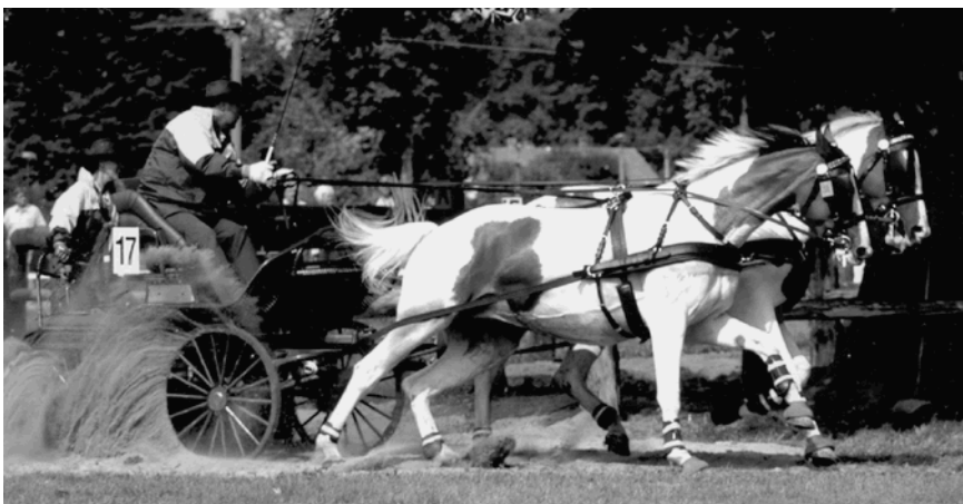
Ilustrační fotografie - závody dvojsprážení