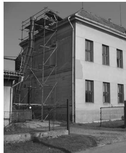
Oprava střechy bývalé lodínské školy