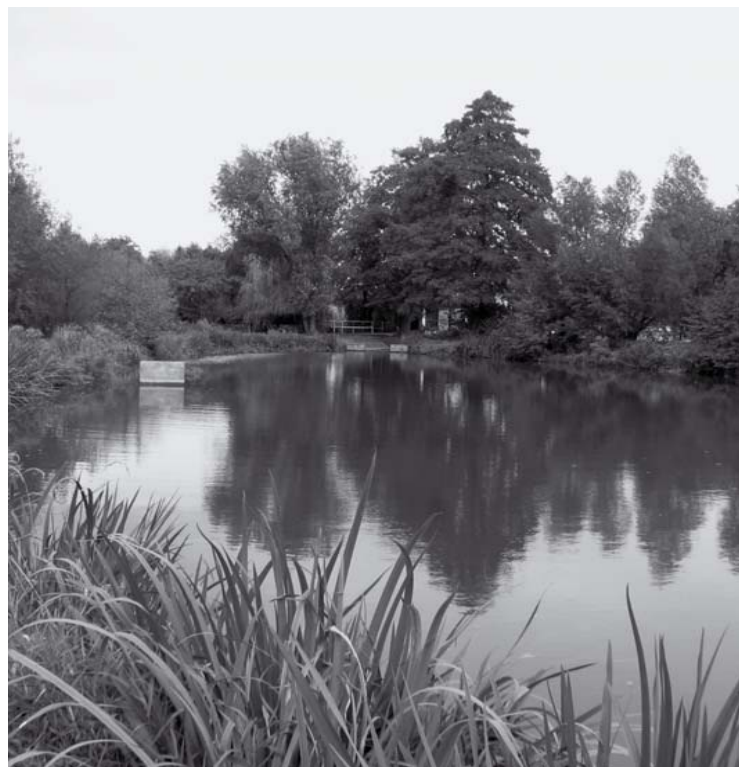
▲ Rybník v Mokrovousích.