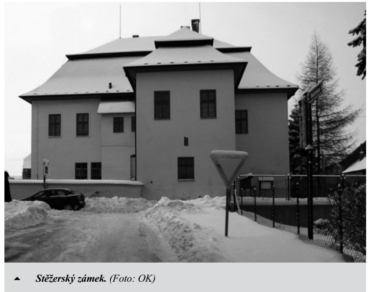
▲ Stěžerský zámek.

Podle kroniky obce připravil OK, www.stezery.cz