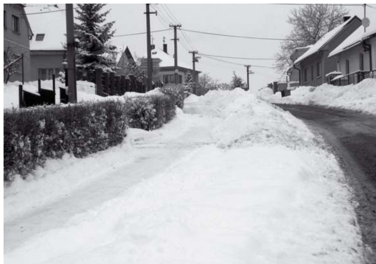
▲ Starosta obce Dolní Přím děkuje všem obyvatelům za jejich vstřícný postoj k odklízení sněhu z chodníků, při lednové kalamitě. Petr Švasta