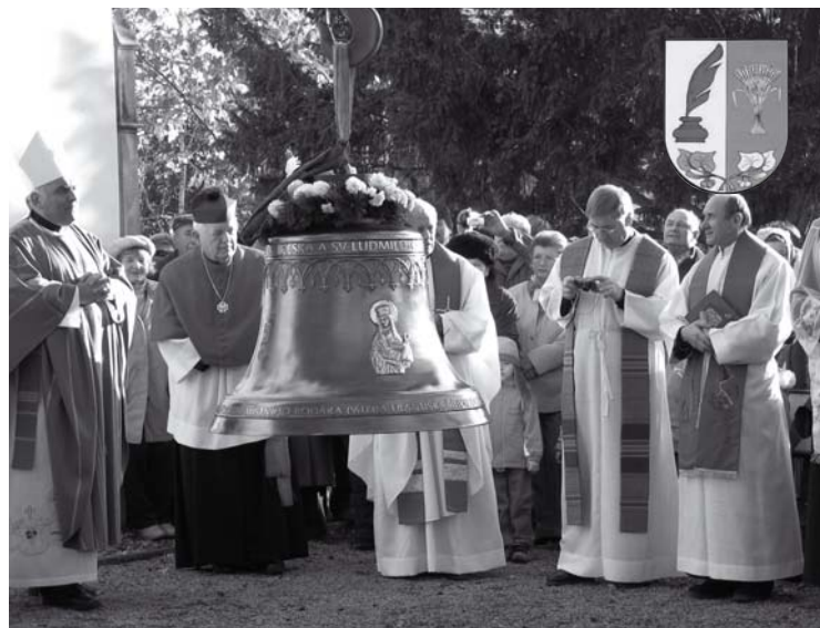
▲ Vysvěcení zvonu hněvčevského kostela.