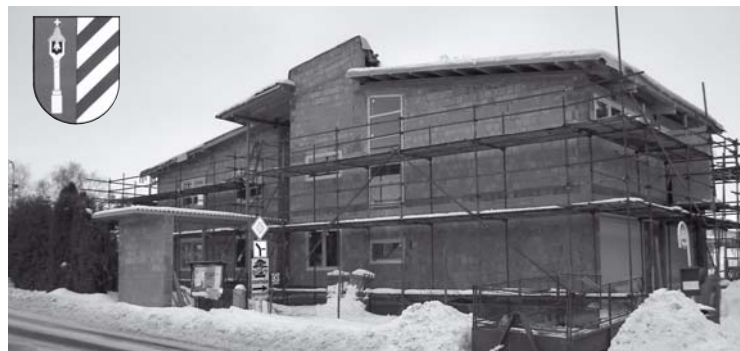
▲ Stavba multifunkčního domu v Radíkovících.