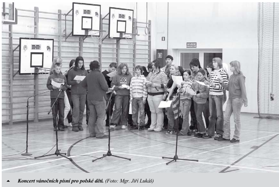
▲ Koncert vánočních písní pro polské děti.