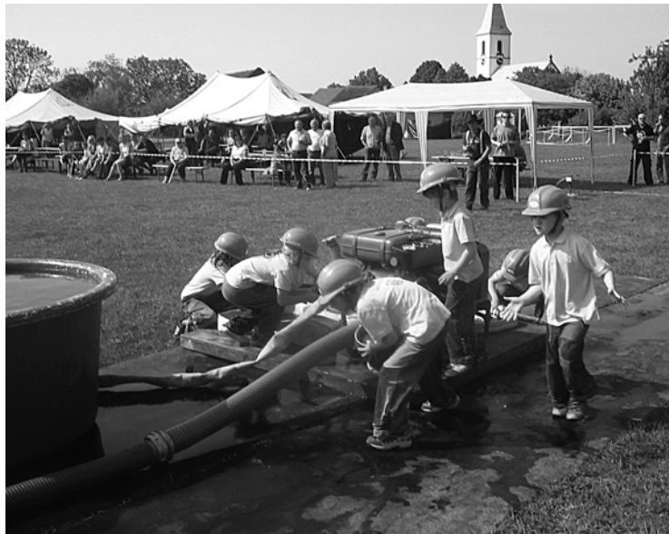
▲ Mezi jednotlivými soutěžemi proběhla ukázka dětského požárního útoku dětí ze Sovětic.