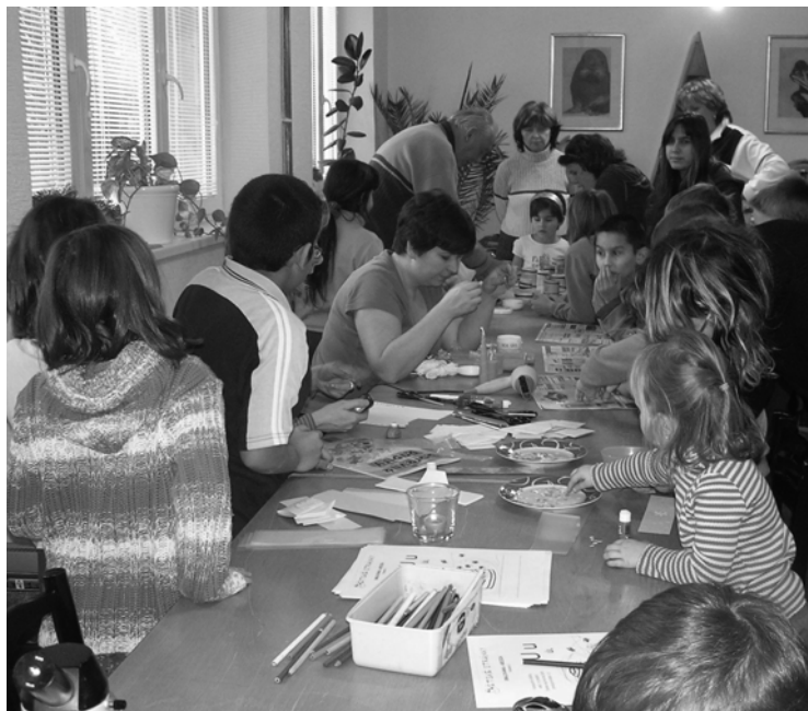
▲ Vánoční včelařská dílna v dětském domově.