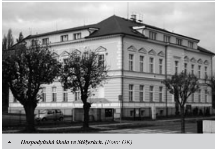
▲ Hospodyňská škola ve Stěžerách.