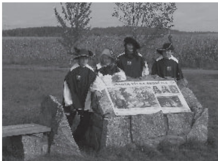
▲ Uvítání dětí ze ZŠ Jankov na naučné stezce „Bitva u Jankova.“