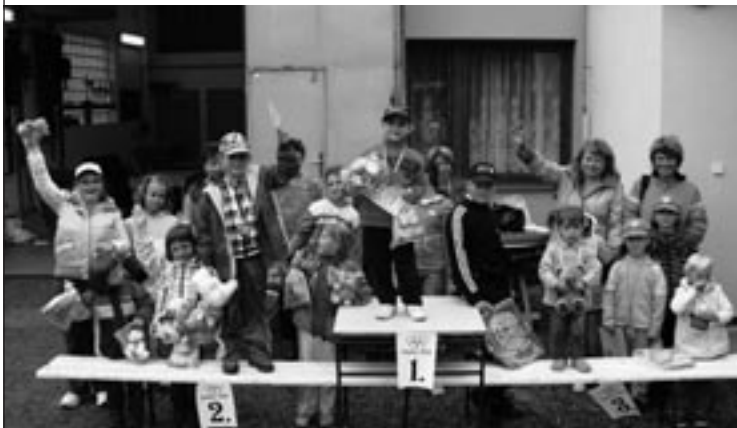
▲ Děti ze Pšánek na akci loučení s prázdninami.