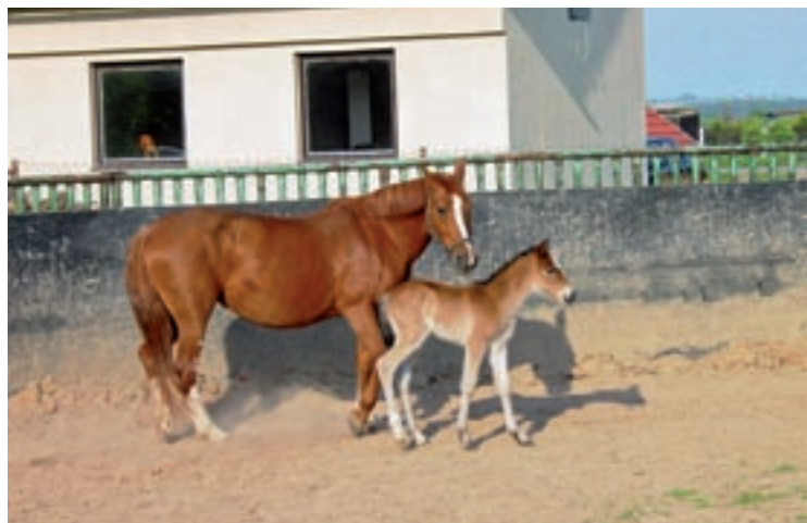
▲ Kobyłka Mája s klisnou Mášou.