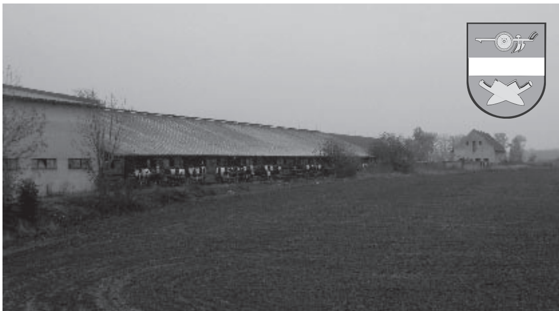
▲ Statek Janov.