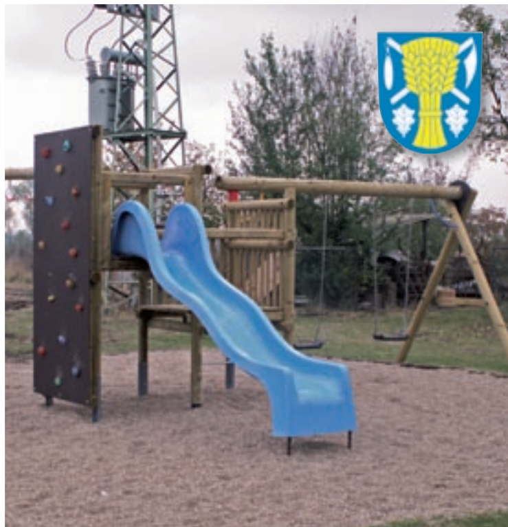
▲ Nové dětské hřiště v Třesovicích.