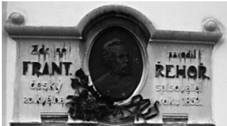
▲ Pamětní deska stěžerského rodáka Františka Řehoře.