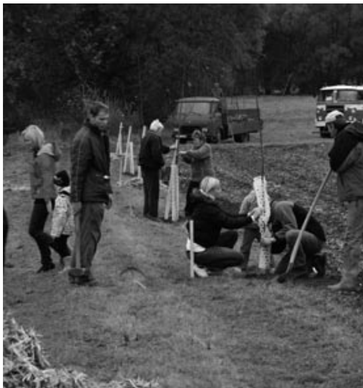
▲ Výsadba lipové stezky ke kapličce ve Mžanech.