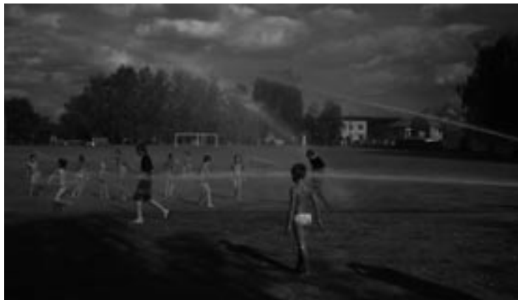
▲ Rozloučení s prázdninami, děti rádí pod střikajícími požárními hadicemi.