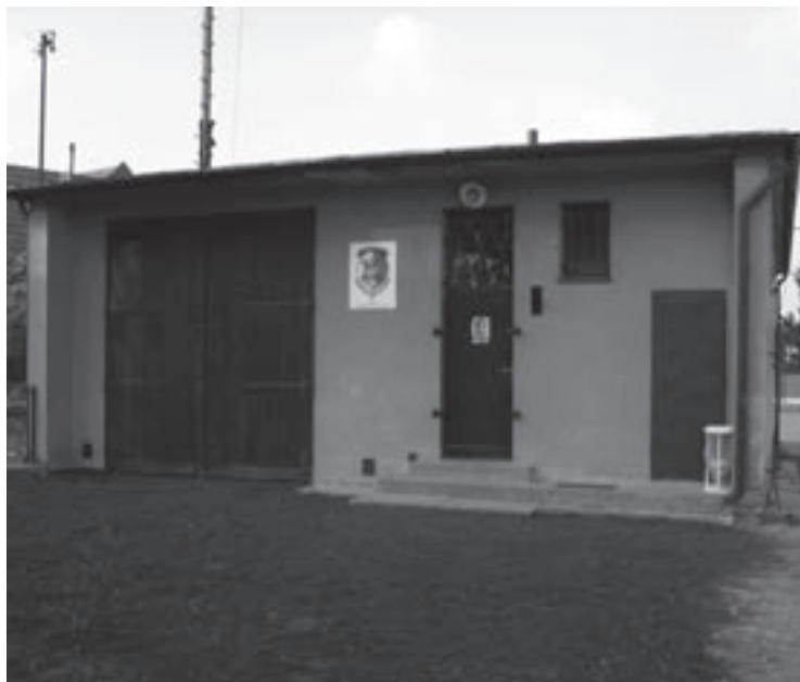
▲ Hasičská klubovna v Sověticích.

Pozn. redakce. Kromě rekonstrukce hasičské klubovny v Sověticích byly z našeho mikroregionu doporučeny k realizaci další dva projekty rekonstrukce mateřské školy ve Stračově a výměna vrat u hasičské zbrojnice v Nechanicích.