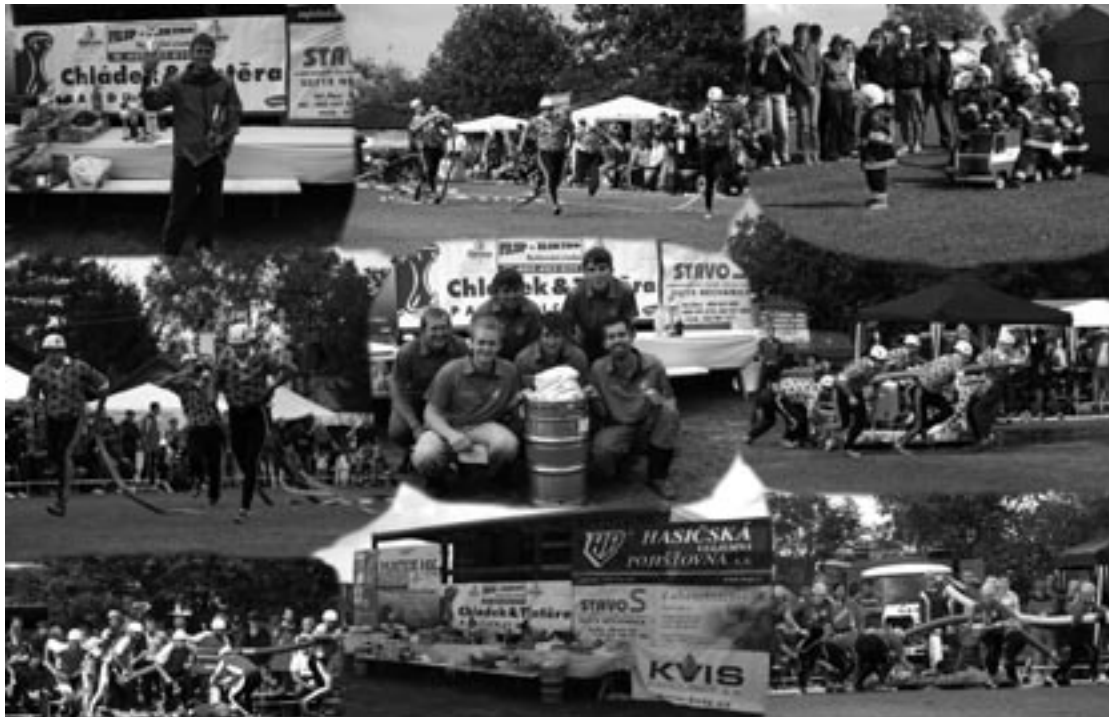
▲ 12. ročník hasičské soutěže „O pohár starosty obce“ v obrazech..