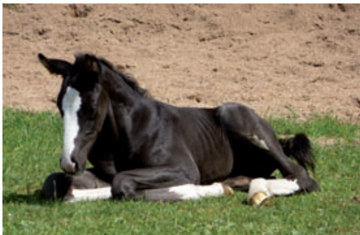
▲ Hřebeček Largo.