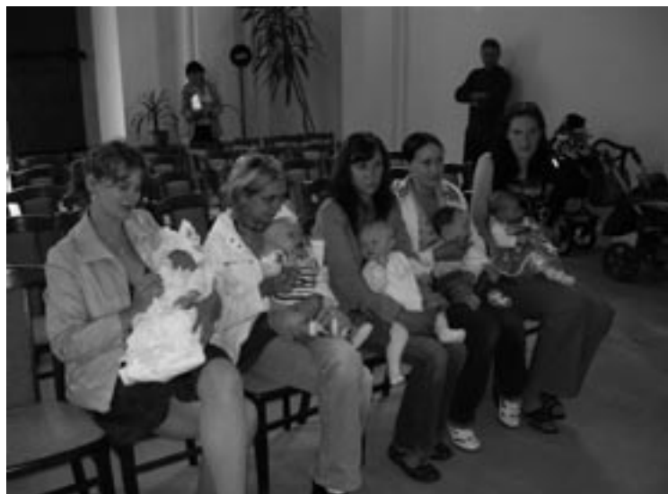
▲ Vítání občánků Dolního Přímu.