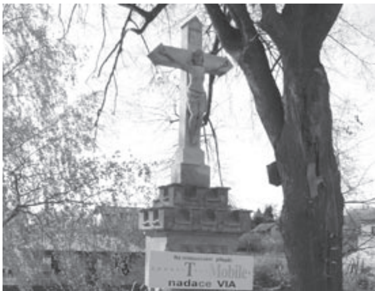
▲ Restaurování památky ve Starých Nechanicích.