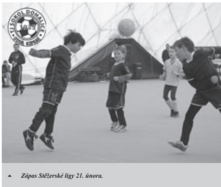
▲ Zápas Stěžerské ligy 21. února.