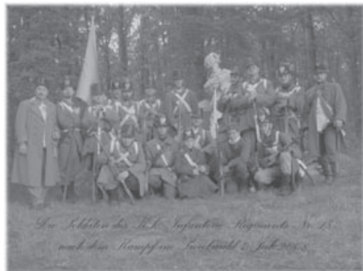
▲ Vojáci C.k. 18. pěšího pluku v lese Svib 4. 7. 2008 po náročném ústupu před pruským tlakem ze vsi Cerekvice.