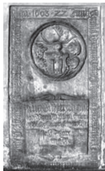
▲ Náhrobní kámen bývalých majitelů Stěžer, které jsou nyní umístěny v obvodní zdi kostela.

Pokračování v příštím čísle. Zpracováno podle kroniky obce.