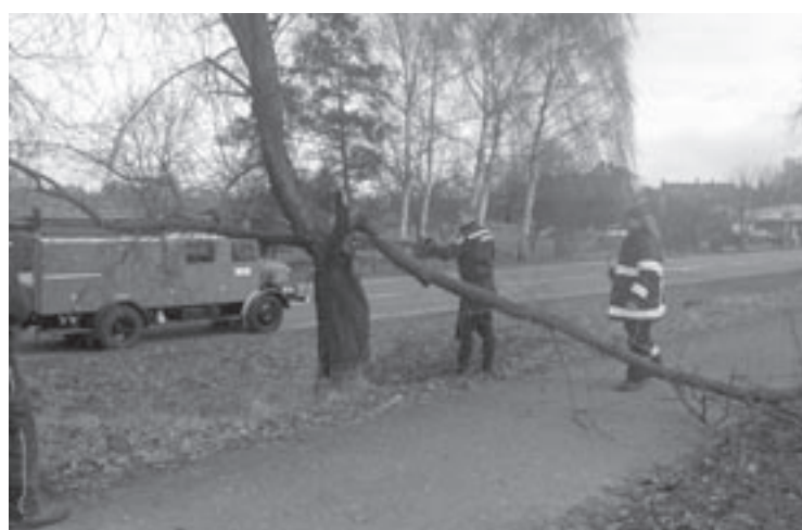
▲ 19.3.2009 Výjezd k odklízení spadlé větve na cyklistické stezce do Stěžer.