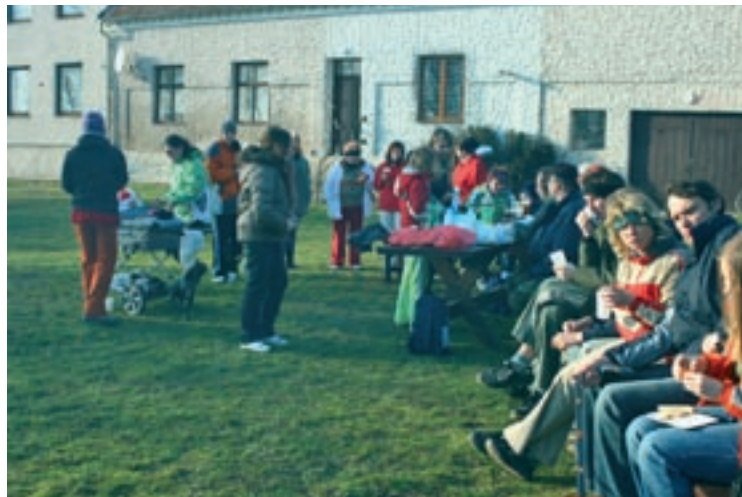
▲ Zasloužený odpočinek na prostranství u zámku.