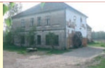
▲ Současný stav budovy mlýnu v Sadové.