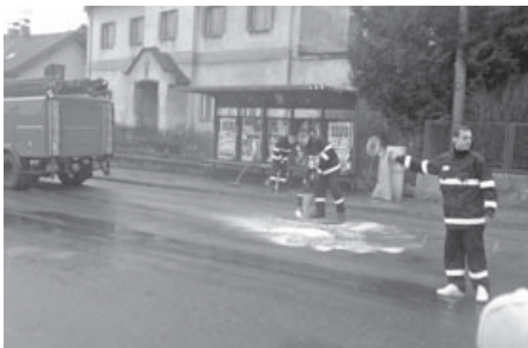
▲ 23.3.2009 Asistence při dopravní nehodě, kdy stěžerští hasiči provedli zasypaní provozních náplní vozidla a oleje po nehodě.