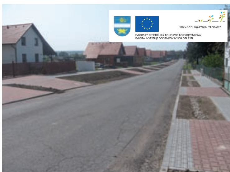
▲ Nově vybudované chodníky čekají na poslední úpravy.