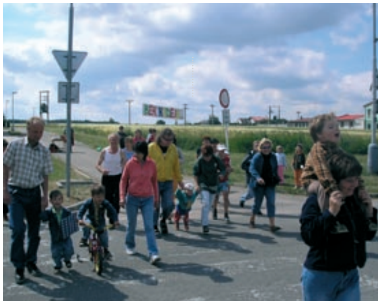
▲ Start loňského ročníku běhu naděje.

Těšíme se na setkání. Za organizátory Jiří Lukáš