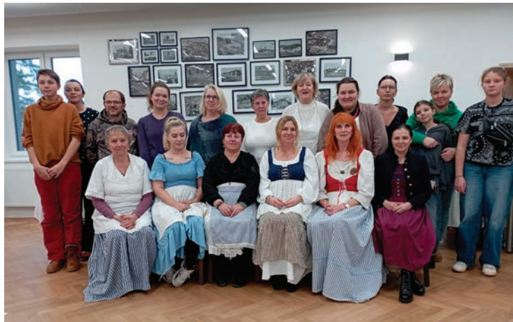
▪ Sešlo se tu celkem 14 vystavovatelů.