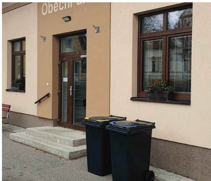
▪ Nové nádoby na tříděný odpad.

Snížení frekvence svozů směsného komunálního odpadu nutí lidi pře-