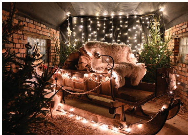
■ Cílem vánoční stezky bylo vypátrat kouzelné saně.