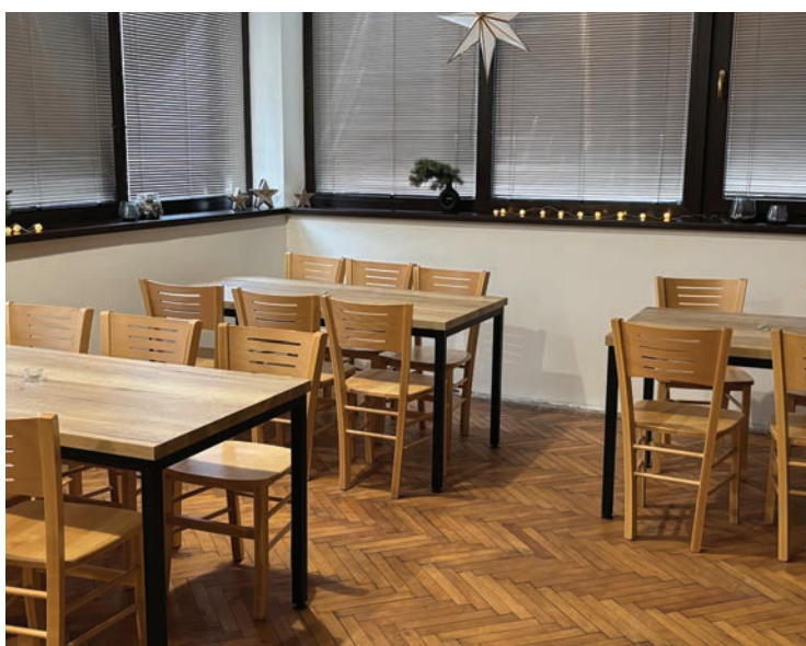
▪ Interiér zrekonstruované hospody.