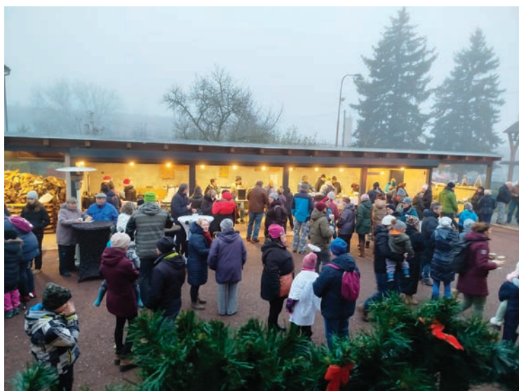
▪ Nový sklad a zázemí pro občany.