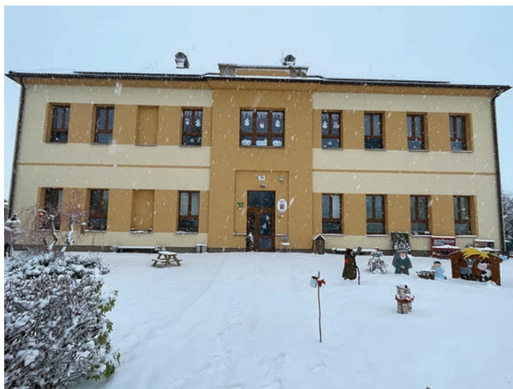
▪ Školkový betlém se letos rozrostl o postavu ponocného.