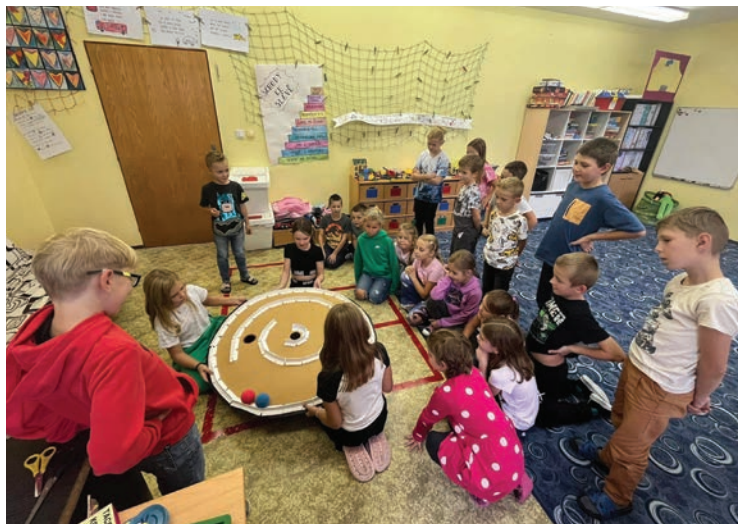
▪ Slavit mezinárodní dny pro nás byla velká zábava.