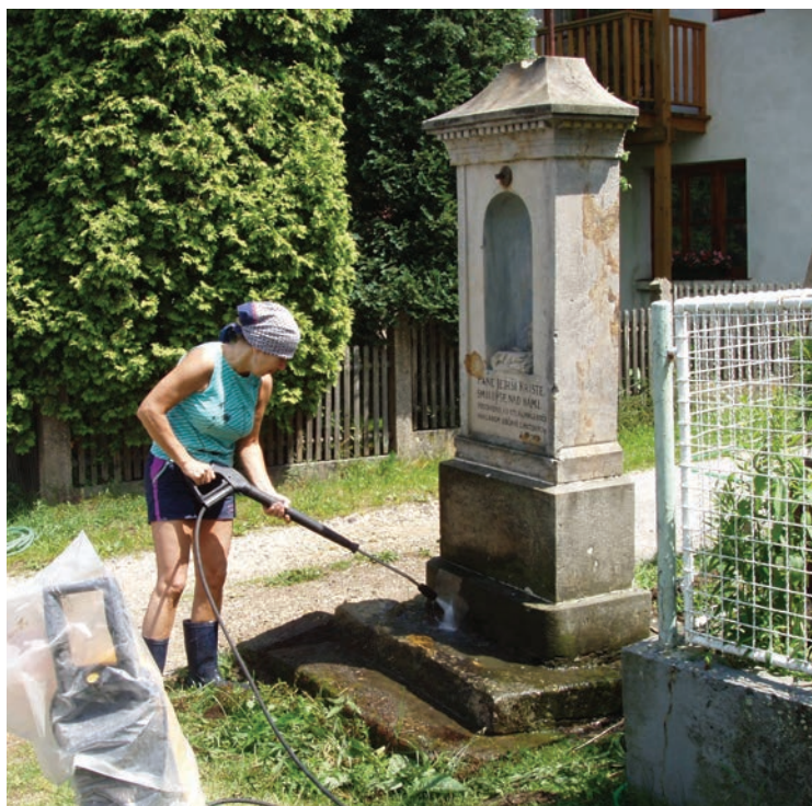
▪ Zahájení opravy.

Zdroje: Karel Dunda: Stračov a Klenice minulosti a současnosti, vyd. 2008; Zápisy schůzí místního zastupitelstva Stračovské Lhoty z let 1900 až 1927; Vlastní archiv autorky