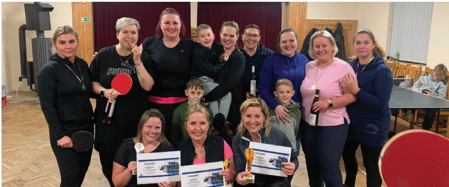
• Turnaje v ping-pongu jsme připravili pro muže, ženy i děti.