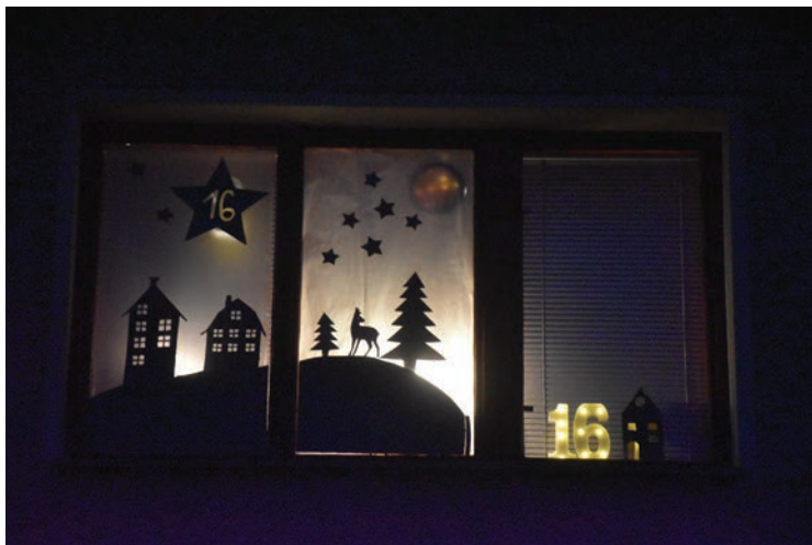
▪ Prosincová hra Sověticko-černůtecká adventní okénka.