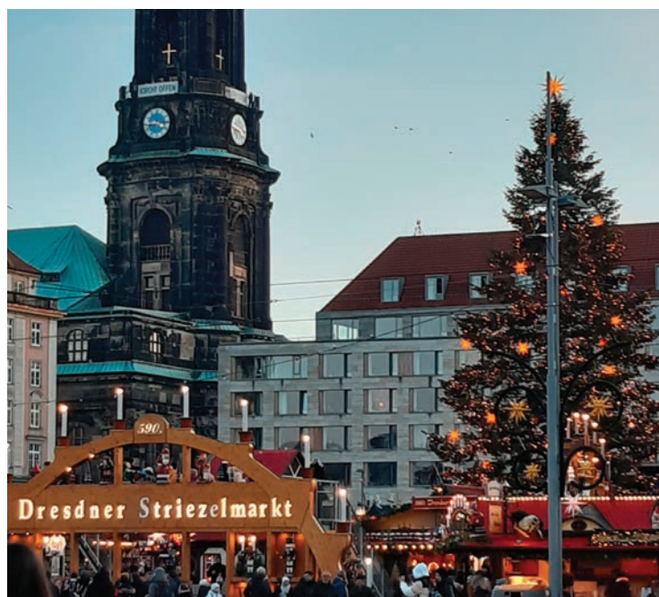
■ Adventní trhy.