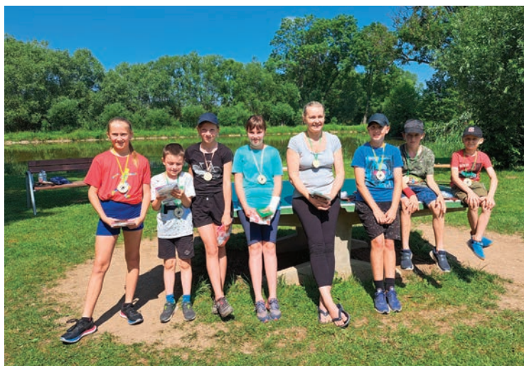
▪ Druhý ročník ping-pongového turnaje.