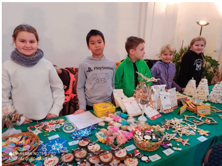
▪ Děti své výrobky prezentovaly na vánočním jarmarku.