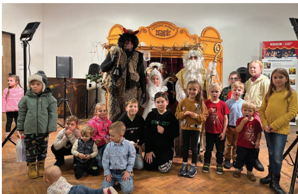
▪ Čert a mikuláš v Radíkovících.