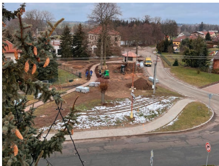
▪ Rekonstrukce parku na návsi.