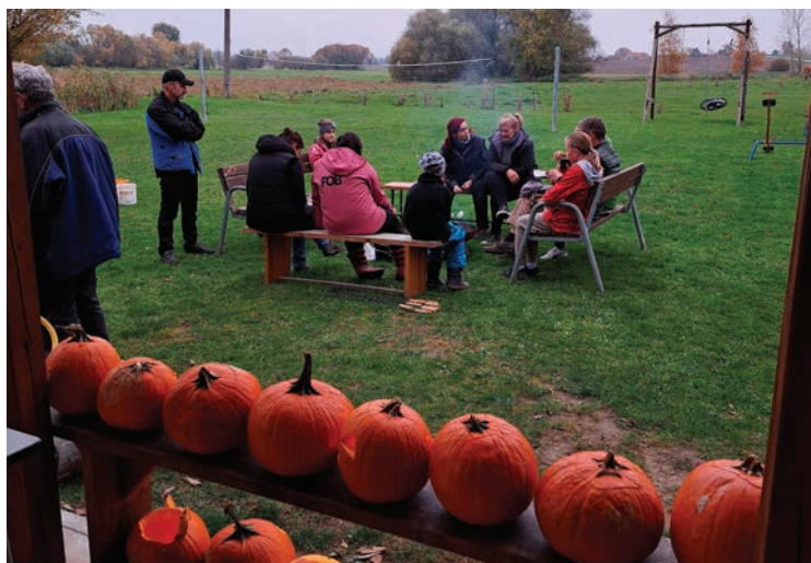
▪ Říjnové sousedské setkání.