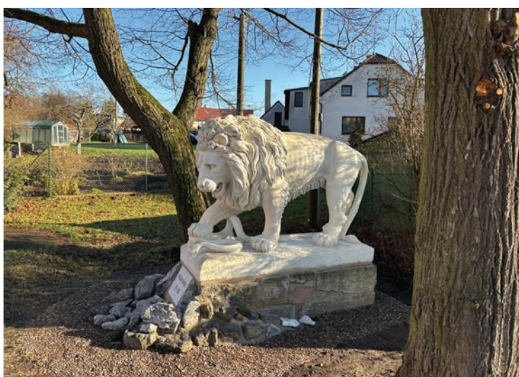
▪ Výsadba aleje podél cesty k Wolfu, opravený pomník pruského setníka Arthura Leonhardiho na Kopaninách, socha lva c. k. rakouské Knebelovy brigády X. armádního sboru.