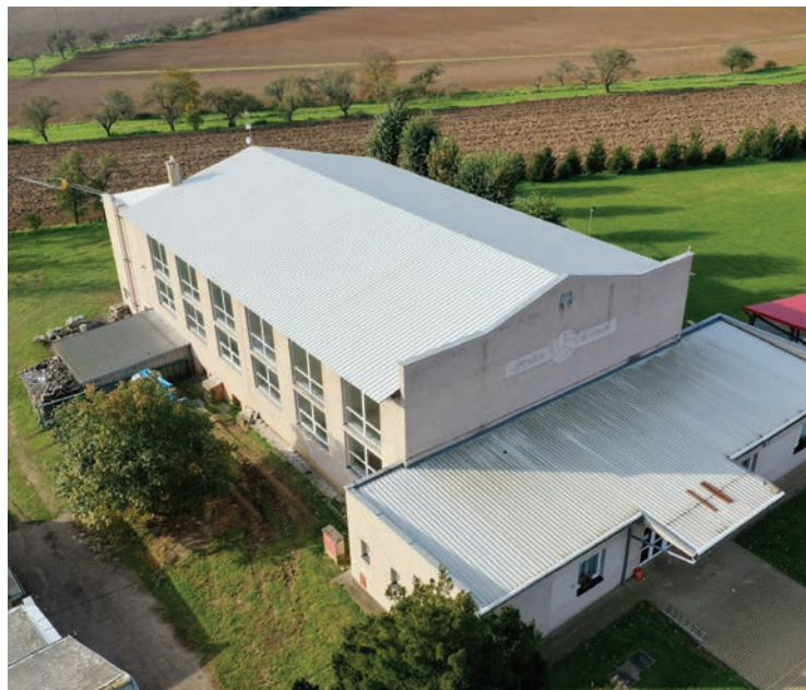
▪ Pohled na opravenou střešní krytinu z ptačí perspektivy.