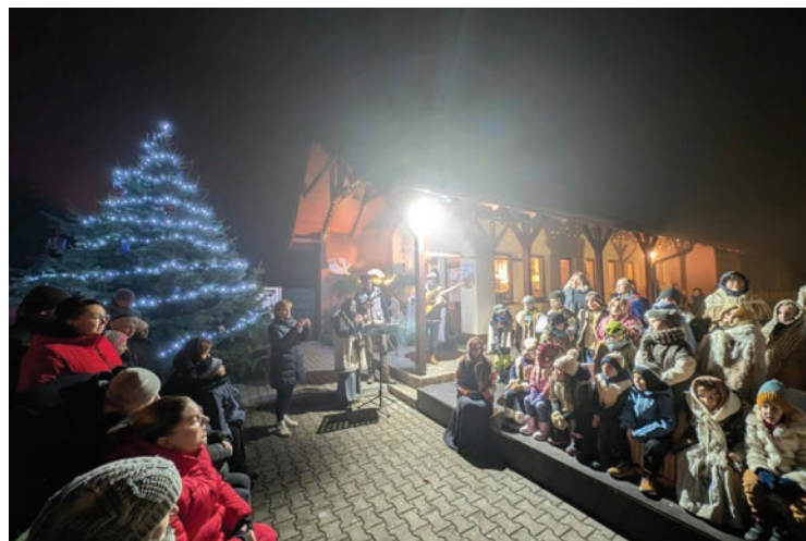
▪ Adventní "Podkerkonošské koladování".