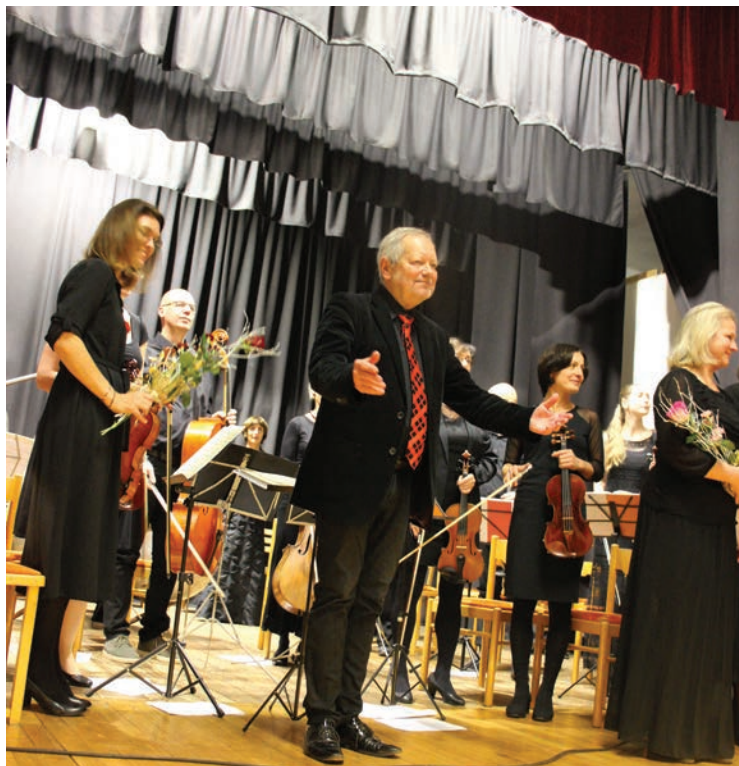
▪ Česká mše vánoční v podání Musica Quinta Essentia.