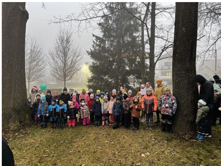
▪ Zpívání u stromečku.