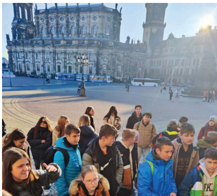
■ Návštěva starého města.