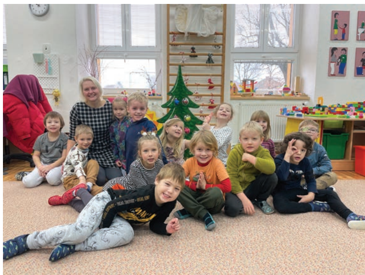
▪ Nejen vánoční čas si užíváme s úsměvem.