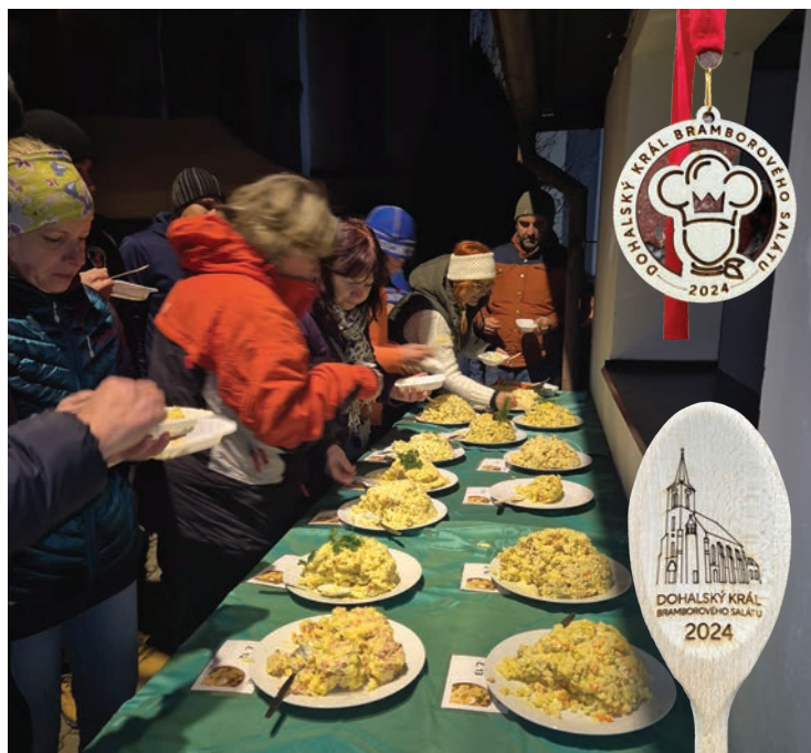
▪ Návštěvníci testovali 15 vzorků bramborových salátů.