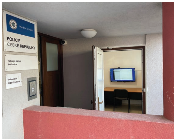
▪ Nové kontaktní místo PČR.

nout, že vedení výsledku prostřednictvím videokonference POL POINT je v souladu s platnými zákony. Zařízení POL POINT však nenahrazuje tísňové volání. V případě tísně, tedy ohrožení zdraví, či života, je nutné