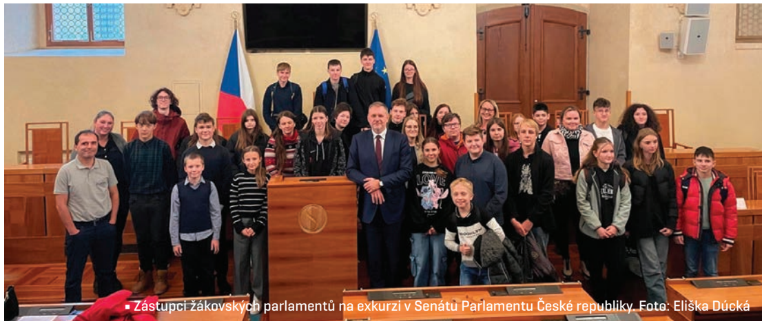
▪ Zástupci žákovských parlamentů na exkurzi v Senátu Parlamentu České republiky.

Aktivít bylo opravdu mnoho, ale to, na co jsme zvláště hrdí, jsou naše aktivity pořádané pro žákovské parlamenty. V říjnu se nám podařilo opět uskutečnit velké setkání všech žákovských parlamentů z ORP Hradec Králové, kterého se zúčastnilo šest hradeckých škol, ZŠ Libčany a také ZŠ Nechanice. Hlavním tématem tohoto setkání bylo „poznej zřizovatele své školy a domluv si s ním spolupráci“. Protože víme, že máme v parlamentech velmi šikovné děti, rozhodli jsme se jejich kompetence posunout i za brány jejich školy tak, aby mohly řešit i to, co je trápí v okolí