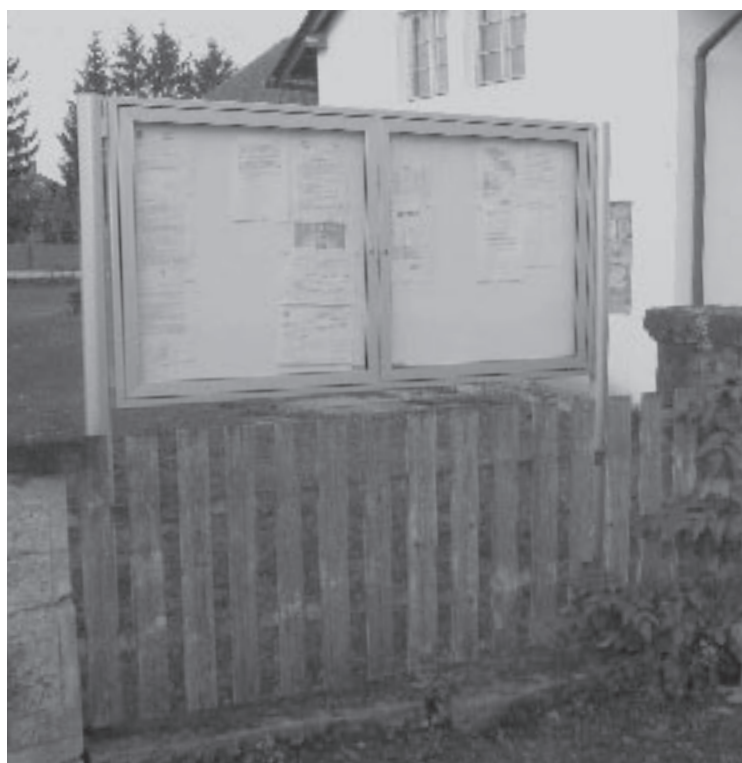
▲ Úřední deska v Sovětích.