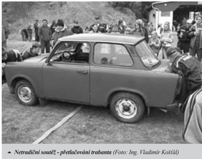
▲ Netradiční soutěž - přetlačování trabanta