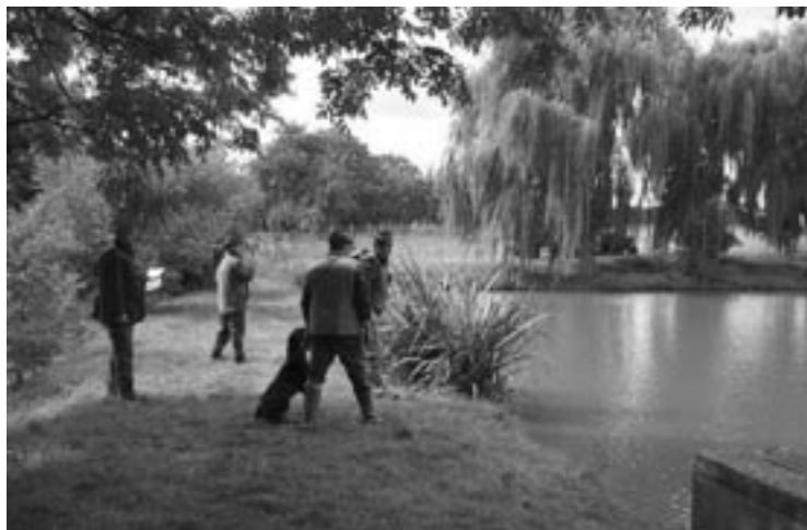
▲ Vodní práce při podzimních zkouškách loveckých psů.