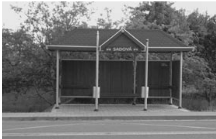
▲ Nově vybudovaná autobusová čekárna.