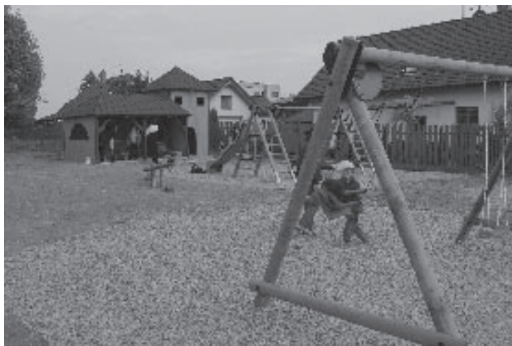
▲ Nové dětské hřiště v Nechanicích.