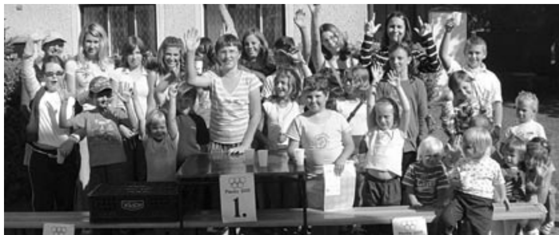
▲ Účastníci malé vesnické dětské olympiády.