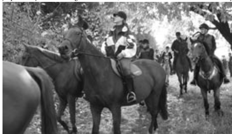
▲ Účastníci 1. ročníku Hubertovy jízdy.