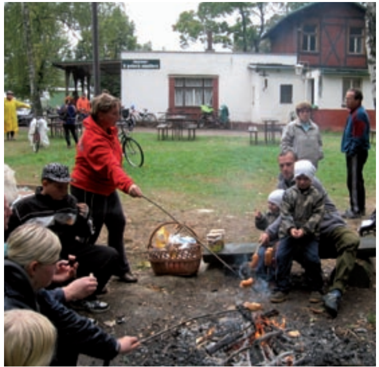
▲ Mezizastávka podzimní akce na kolech na Chlumu.