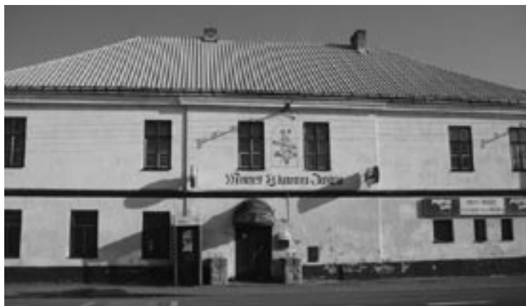
▲ Motorest U kanonýra Jabůrka, bývalý vojenský lazaret.

P. S. Historické datování a údaje převzaté z rukopisu