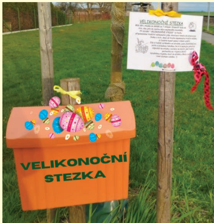
▪ Velikonoční stezku prošlo na 55 dětí.