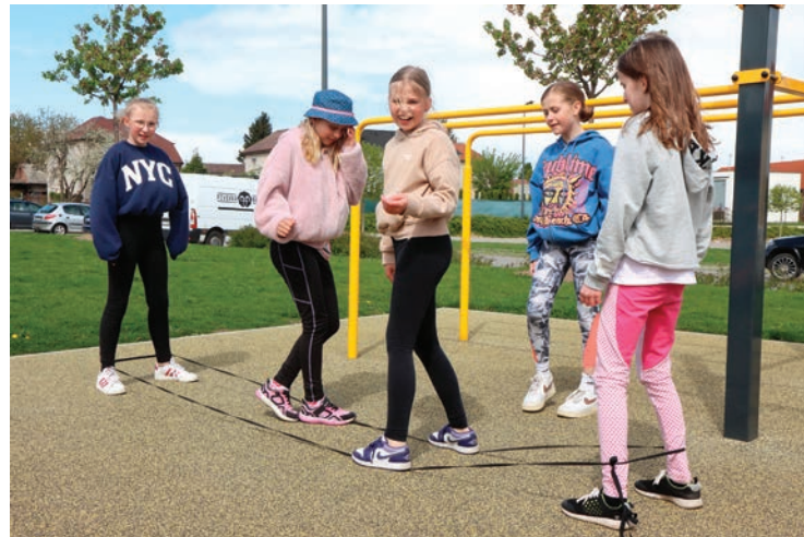
▪ Pruženka doplnila hřiště ve Stěžerách.