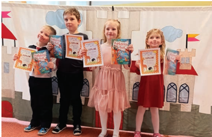
▪ Vítězové letošního ročníku Stěžerské básničky.