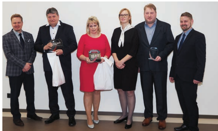
▪ Cenu převzala starostka obce.

Klub je také úspěšným pořadatelem a spolupořadatelem fotbalových turnajů. Již 22. ročník turnaje v malé kopa-