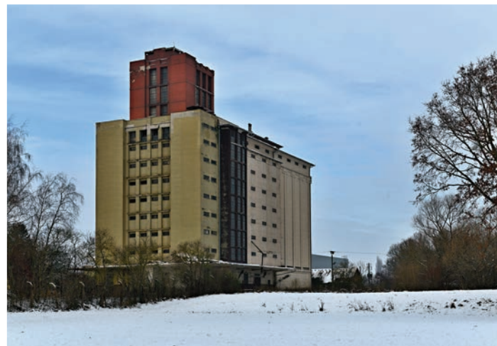
▪ Historická podoba sila.