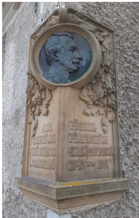
■ Pamětní deska Jana Podlipného v Hněvčevsi.