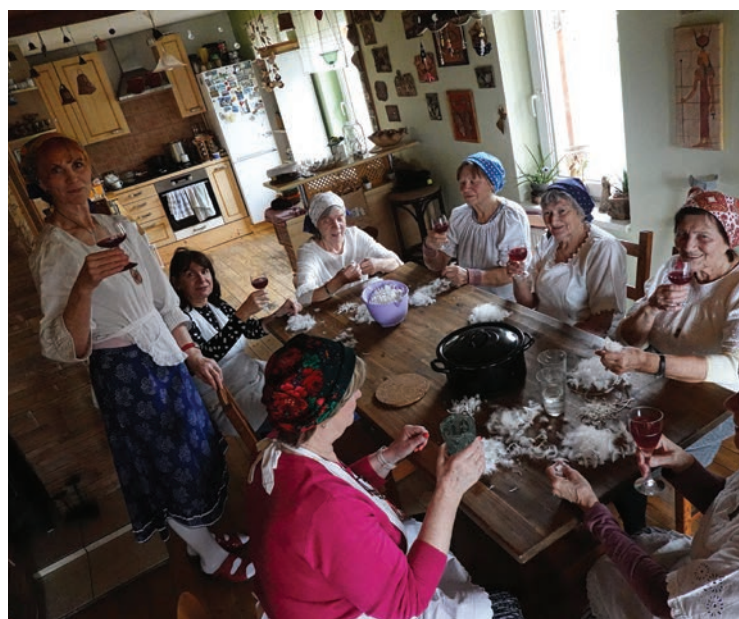
▪ Draní peří jsme prokládali dobrým jídlem a pitím.