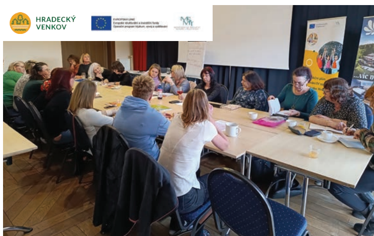
▪ Setkání ředitelky mateřských škol v Rychnově nad Kněžnou.