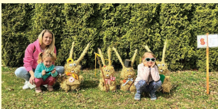
▪ Na velikonoční stezce nesměla chybět ta správná výzdoba.