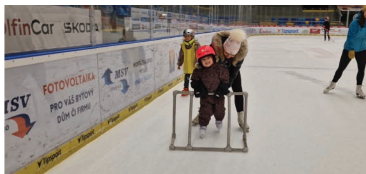
▪ Ledovou plochu využili i naši nejmenší bruslaři.