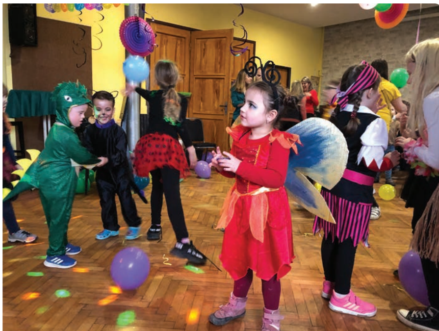
▪ Atmosféra dětského karnevalu byla skvělá.