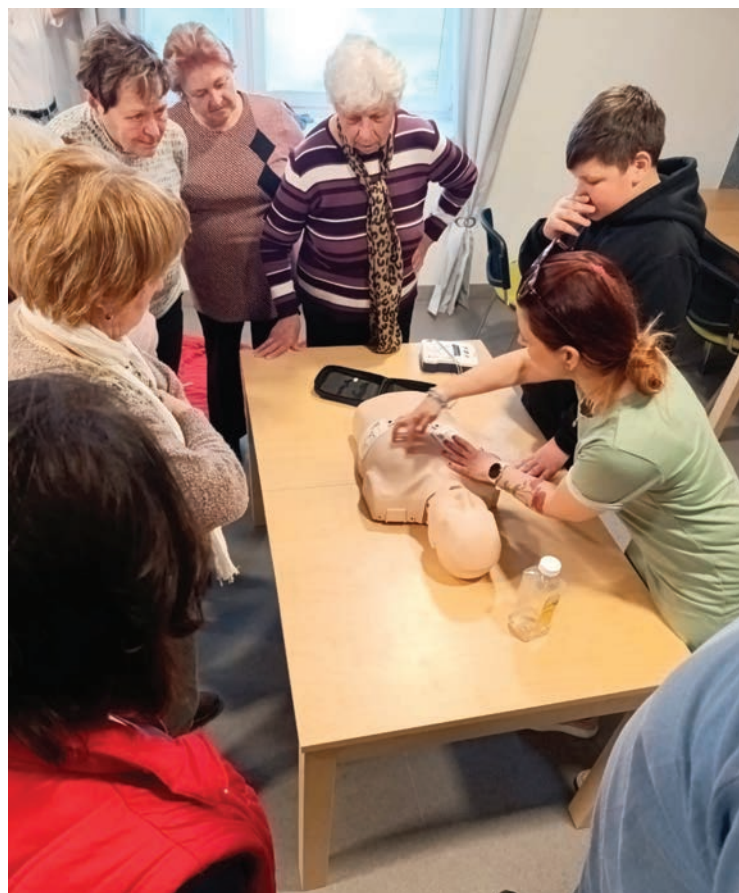
▪ Každý si vyzkoušel masáž srdce a přenosný defibrilátor.

Paní lektorka nás také seznámila s důležitou aplikací, kterou je více než dobré mít v mobilním telefonu - Záchranka. Naučili jsme se například, jak rozpoznat příznaky mrtvice. Každý zná určité ten základní – „spadlý“ koutek úst či oka, ale tak to nemusí být vždy. Stačí postiženému říct, ať vyplázne jazyk – vypláznout ho rovně se mu nepovede, vždycky to bude na stranu. Nebo zvednout vpřed obě ruce – neudrží je obě dvě natažené. Pak je nutné okamžitě volat 155. Postižený by se měl nejpozději