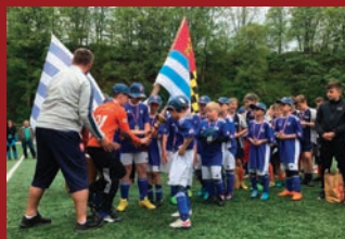
DOHALICE – FOTBALOVÁ OBEC ROKU