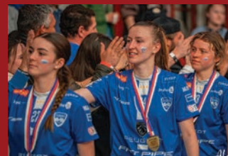
SADOVÁ – FLORBALOVÉ ÚSPĚCHY