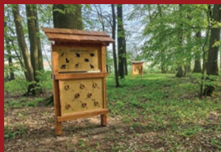
DOLNÍ PŘÍM – NOVÁ NAUČNÁ STEZKA