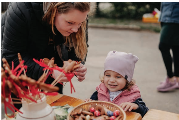
▪ Velikonoční tvoření kraslic a perníčků.