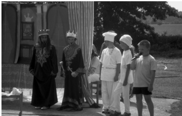
▲ Hudební pohádka O šípkové Růžence v podání dětí ze ZŠ Dohalice.

Obec nežije pouze kulturními akcemi. Prvním zrealizovaným projektem letošního roku byla výsadba stromů na cestě od hasičské klubovny, která byla podpořena z grantu Královéhradeckého kraje. V červnu byla zahájena dlouho připravovaná a očekávaná rekonstrukce budovy Obecního úřadu. První etapa spočívá ve výstavbě nové střechy a druhá, která bude následovat ještě v letošním roce ve výměně oken, zateplení a nové fasády. Obci se podařilo získat významnou finanční podporu. Na první etapu rekonstrukce jsou finance z dotačního programu Krajského úřa-