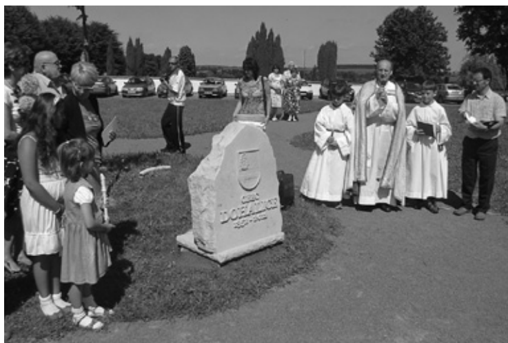
▲ Odhalení a posvěcení pamětního kamene při příležitosti oslav.

Další akce už pokračovaly na místním fotbalovém hřišti, kde bylo zajištěno občerstvení. Největší úspěch mělo pečené seledo. Odpoledne i večer byly provázeny příjemnou hudbou, na podiu se vystřídal několik hostů – hudební kapely, loutkové divadlo, pěvecký sbor Kaštánek nebo děti ze základní školy. V podvečerních hodinách byly vyhlášeny vítězky soutěže o nejlepší pouťový koláč. Své dovednosti během odpoledne předvedli i hasiči, malí fotbalisté, šermíři, mo-