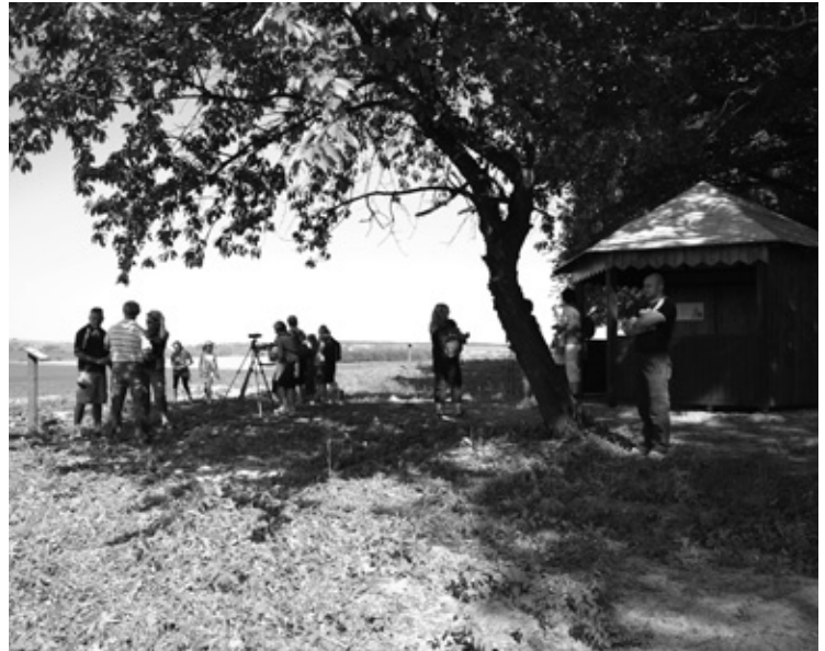
▲ Vyhlídka na Jehlickém kopci.

Červen byl také ve znamení závěrečných koncertů a vystoupení škol. Hudební obor ZUŠ Melodie připravil koncert a nové barevné taneční vystoupení s názvem „Cirkus“. Děti DS Klobouk nastudovaly pohádku Jak Kašpárek srdce léčil. Na závěr žáci a učitelé ZŠ Nechanice připravili akademii – Mejdan roku devátáků, která uchvátila úžasnou výzdobou, napečenými dobrotami i samotným vystoupením.