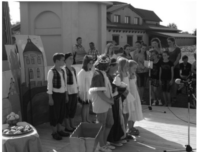
▲ Vystoupení dětí ze ZŠ Mžany na dětském dni.

Závěrem tohoto příspěvku bych chtěla za všechny poděkovat organizátorům, účinkujícím a především všem, kteří několik dní předem a ně-