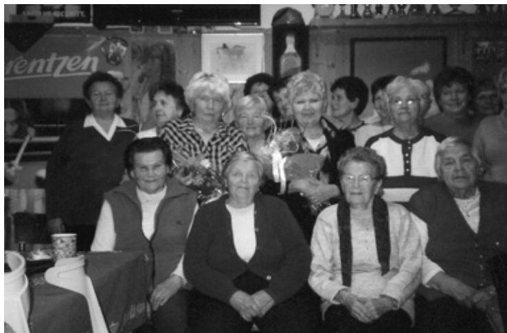
▲ Setkání spolužáků v základní škole po šedesáti letech.