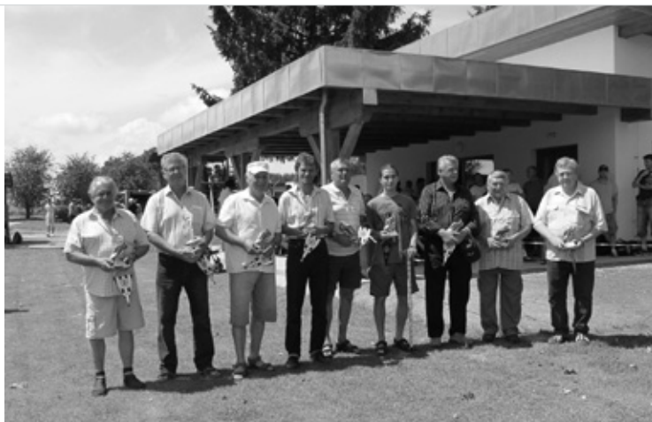
▲ Vyhodnocení zasloužilí funkcionáři TJ.