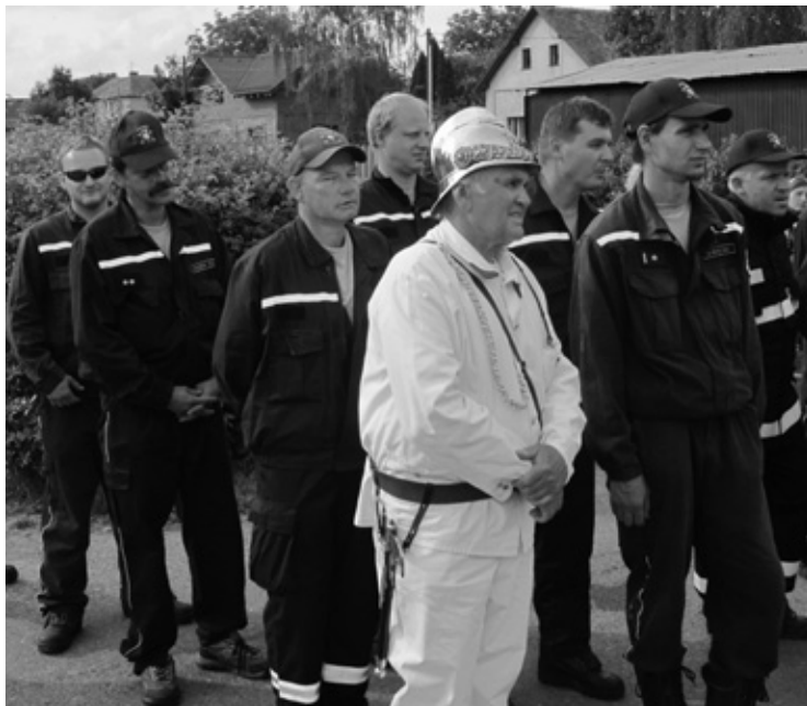
▲ Oslavy 130 let trvání sboru ve Stěžerách.