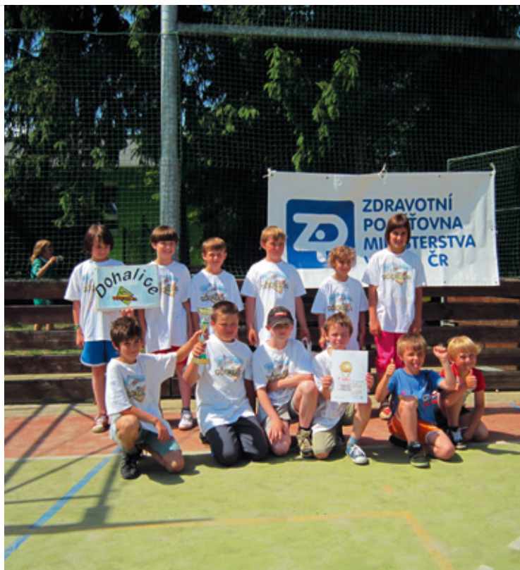
▲ Vítězné družstvo kategorie mladších žáků - ZŠ Dohalice.