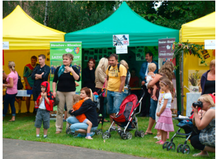
▲ Spolky, které se prezentovaly na víkendových oslavách.

-společenskými akcemi, získanými dotacemi a připravovanými projekty získala ocenění v rámci České republiky „Cena naděje pro živý venkov“. Oslava tohoto ocenění se uskutečnila s našimi rodáky ve dnech 20. – 21. července 2012. Program byl opravdu bohatý. Začal již v pátek vystoupením tří rockových kapel (Atlantis, U2 revival, Metallica revival) na místním hřišti. I přesto, že v průběhu vystoupení přšelo, návštěvníci byli spokojeni. Sobotní program začal pro rodáky Stračova a Klenice prezentací osmi aktivních spolků v obci Stračov – Dámského klubu, hasičů, Sokola, šipkařů, Šikovných ručiček, mysliv-