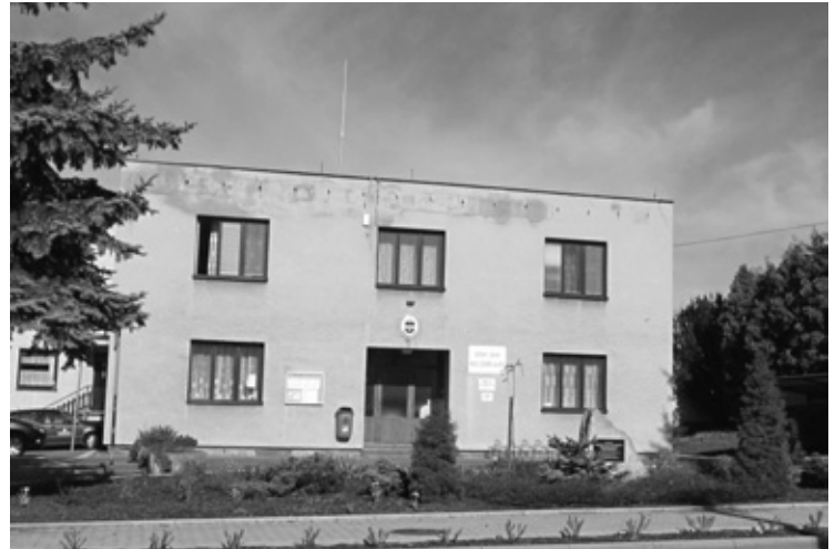
▲ Budova OÚ Mokrovousy před rekonstrukcí.