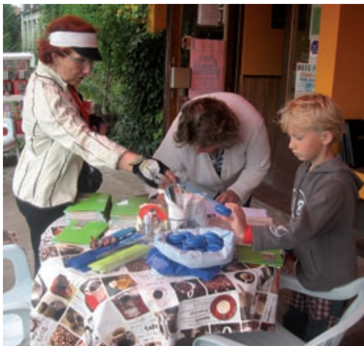
▲ Zakončení cyklistického výletu v Milovicích.