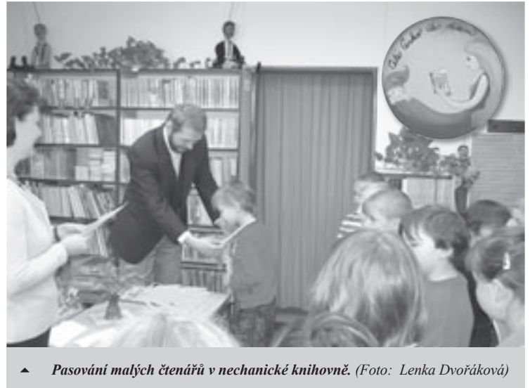
▲ Pasování malých čtenářů v nechanické knihovně.