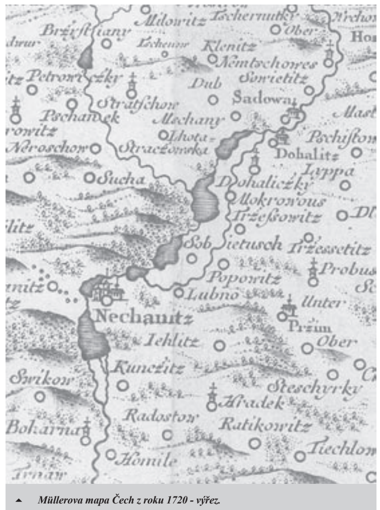
▲ Müllerova mapa Čech z roku 1720 - výřez.

P. S. Autor i redakce prosí pamětníky, kteří mohou poznámku o mlýnech doplnit o vlastní či kronikářské záznamy, aby zaslali své připomínky a doplňky redakci Zpravodaje.