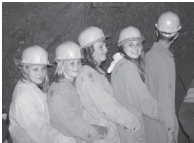
▲ Děti ZŠ Nechanice na exkurzi v uhelných dolech ve Walbrzychu.