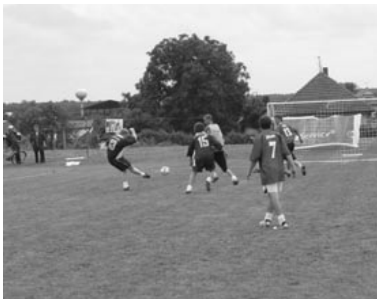
▲ 6. ročník turnaje v malé kopané Pařez Cup.

Již teď se těšíme na další ročník a věříme, že se zde všichni opět ve zdraví sejdem.