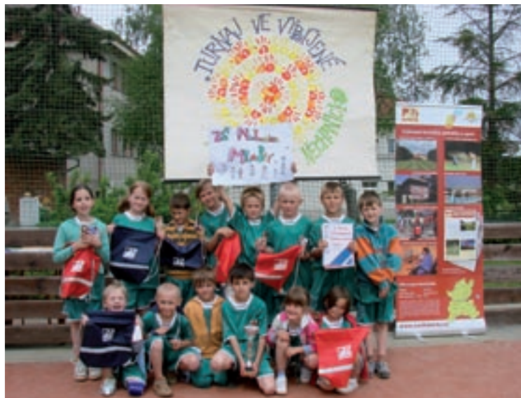
▲ Vítězné družstvo mladších žáků z Nechanic.