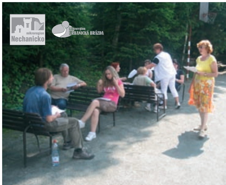
▲ Kurz v Jedlově na téma práce v týmu a zapojování veřejnosti. Čtěte na str.2.